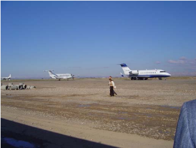
فرۆکەخانەى هەولێر – ژەنیوەریی 2004 2