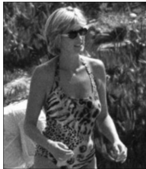
دیانا مه‌له‌وانی ده‌کات. ۱۴ ی یولیۆ ۱۹۹۷