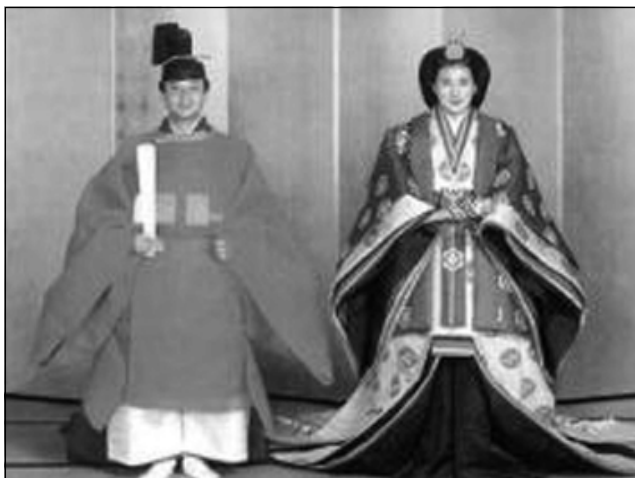
بووك و زاوا به جلى تهقليدى ئيمپراتوريهت