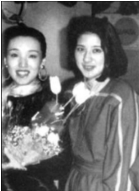
له گه ل كومي هاراي دهسته خوشكي