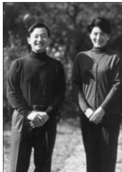
به جلی ره سمیه وه به لام به روویکی ناخوش