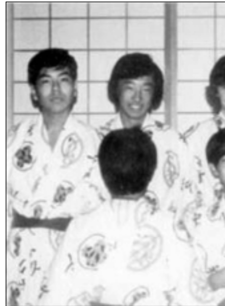
ناروهيئو له ئوسترااليا