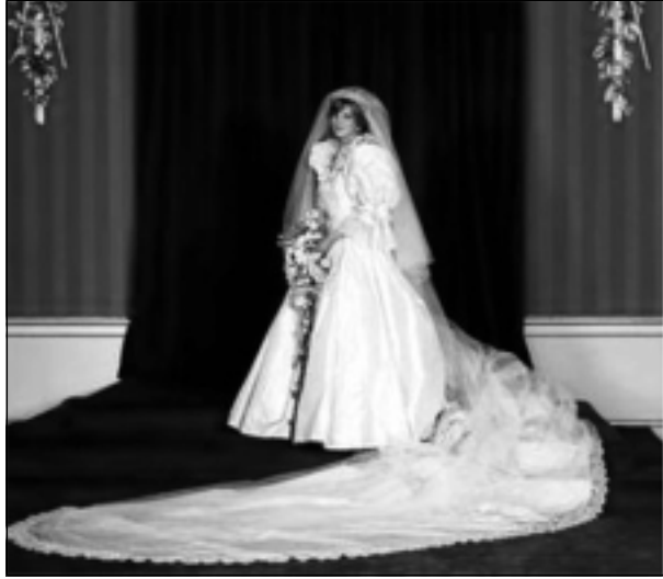
دیانا له ۲۹ ی یولیوی ۱۹۸۱