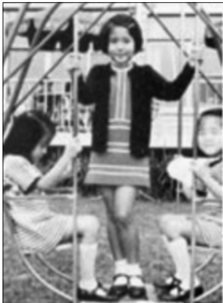
ماساكو يارى دهكات