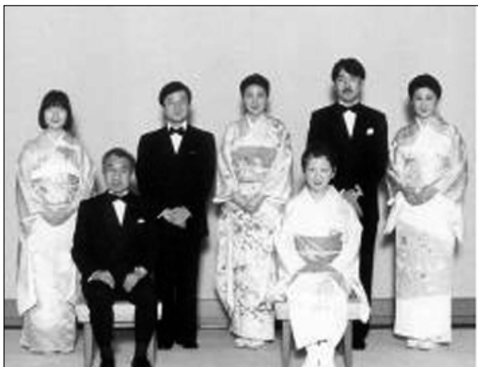
لهگه ل بنه ماله ئيمپراتور