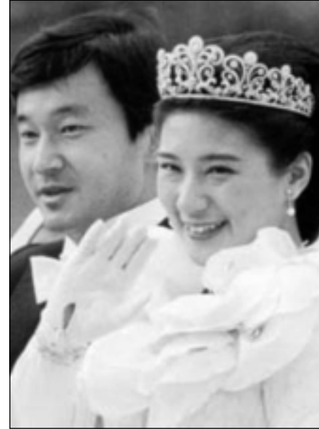
بووک و زاوا سلاو له میوانه کانیان دهکهن