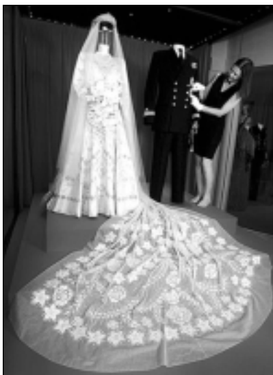
فستانی بووکینی شازن به درێژی ۱۳ پی

له یادی ۶۰ ساله‌ی بووکینی ئالیزابیثی دووهم له پرینس فیلیپ، پیشانگایه‌ک بۆ کهنجینه نازداره‌کانی ده‌کریتته‌وه. ئه‌و فستانه‌ی بووکه‌که له پرۆژی ۲۰ ی نۆفمبه‌ری ۱۹۴۷ له‌به‌ری کردبوو، یه‌کێکه له کهنجینه نایابه‌کان. به جوانترین فستانی بووکینی له جیهان ده‌ژمێردریت، چونکه ئه‌و فستانه شتیکی ئاسایی نه‌بووه، به ماوه‌یه‌کی کورتیش نه‌دوووراه، به ۱۰ هزار به‌ردی یاقووت و به‌ردی گرانبه‌ها کراوه. (نورمان هارتنل) دیزاینه‌ری بووه، بیروکه‌که‌ی بۆ (تابکۆی بریمافیرا) ده‌که‌ریتته‌وه، که هونه‌رمه‌ند (بوتشیللی) له سه‌ده‌ی یازده‌هه‌م دروستی کردبوو. تابلۆیه‌که سونبلی که‌رانه‌وه‌ی ژیانه پاش شه‌ر، ئه‌وه‌ش له راگه‌یاندنیکه ده‌سته‌ی رۆژنامه‌گه‌ری پاشایه‌تییه‌وه ئاشکرا کراوه، رهنکه سپییه عاجییه‌که‌شی بۆ ئه‌و سه‌رده‌می پاش شه‌ره‌که، که شازن له سپی به‌فرین دوور کهوتیتته‌وه، ده‌که‌ریتته‌وه.