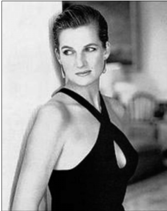
ديانای نازدارو خه‌مگین.