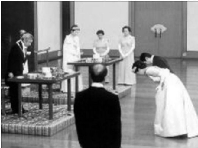
بووک و زاوا کرنۆش بۆ ئیمپراتۆر دهبن