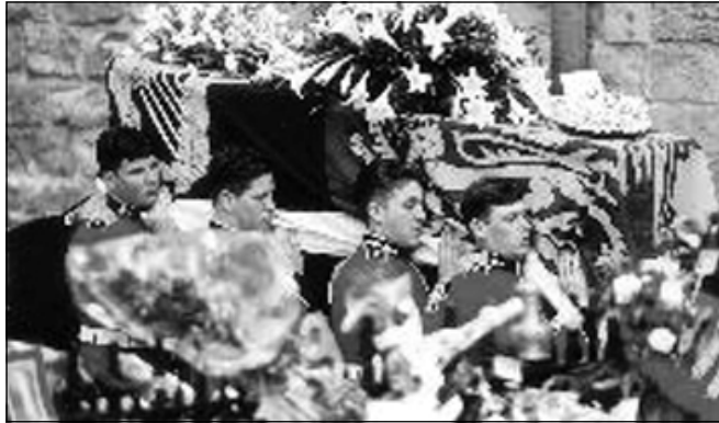
روژي گول له لهنده ن

تشارلز به هه ردوو کوره که ی وت، من به ره و فه رهنسا دهچم بو هينانه وه ی ته رمی دايکتان ئيوه ش له گه ل خو ما نابه م.