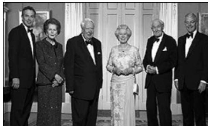
شاژن له‌گه‌ڵ ژماره‌یه‌ک له‌ سه‌رۆک وه‌زیرانی پێشوه‌ی به‌ریتانیا

تاجه‌که‌ی ئالیزابیث له ساڵی ۱۹۳۷ داریژراوه‌ته‌وه، پێشتر چه‌ندین پاشای تر له‌سه‌ریان داناوه، بۆ شاژن فیکتۆریا له ساڵی ۱۸۳۸ داریژراوه‌ته‌وه، پاش ئه‌و ئادواردی هه‌وته‌م و جۆرجی پینجه‌م له‌سه‌ریان داناوه، له ساڵی ۱۹۳۷ بۆ جۆرجی پینجه‌م ئه‌و شیوه‌ی ئیستای له ساڵی ۱۹۵۳ وه‌گرته‌وه. پاش ئه‌وه‌ی که‌میک نه‌وی کراوه‌و ۲۸۰۰ پارچه‌ ئه‌لماسی تازه‌و ۱۷ به‌ردی زفیرو ۱۱ زه‌مرودو ۵ یاقووت و ۲۷۳ ده‌نکه‌ لوئوئی بۆ زیاد کراوه.