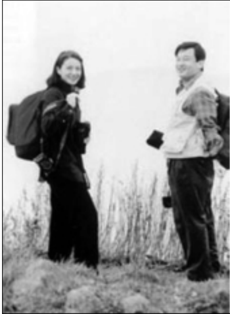
بووک و زاوا له سهیرانا