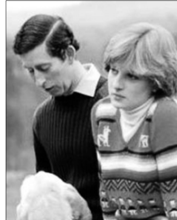
ژن و مي رديكى ناكوك

ماله كه ى هوار رۆژانه سه دان ته له فونى شه وان هيان بۆ ده هات. كه يه كيكيان سه ماعه كه ى ته له فونى كه ى به رز ده كردوه، هه چى نه ده بيست، وه لام نه بوو!