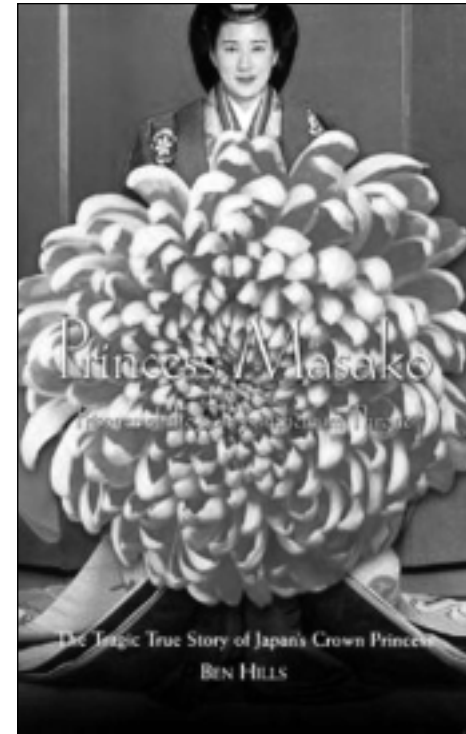
پرېنسىس ماساكو دیلی ناو كوښكى ئىمپراتورىيەتى ژاپون نووسىنى: بن هيلز و: محەمەد ئەمىن وەرگىرانى بۇ كوردى: شىرزاد ھەينى