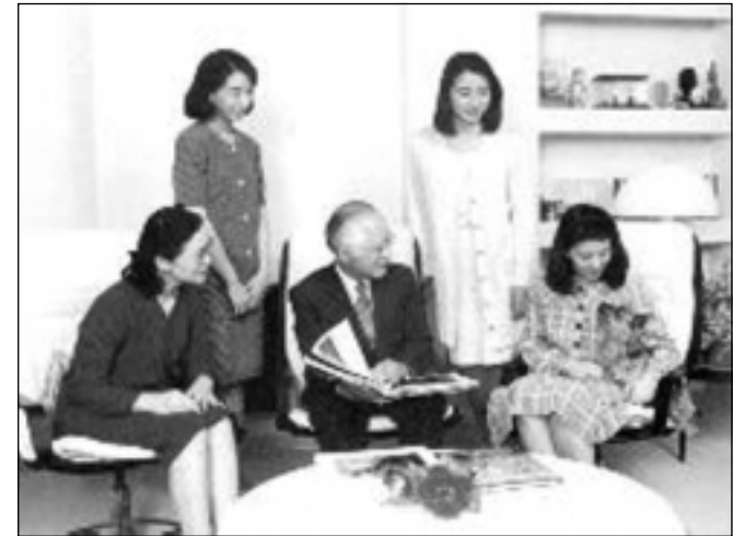
ماساکۆ دوا دیداری ماله وه بیان به رهو کۆشک