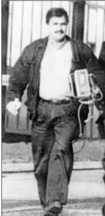
دکتور هسناټ خان پاکستانی

تا زورتر شارهزا و زانیاری له سه ر ولاتی خان هه بیټ، زور به سه ردان دهچوه پاکستان. (حمیما خان) کیژی (ئانابیل) و (جیمی سمیټ) براده ری نزیکی دیانا، ژنی یاریزانی کریکیتی پاکستانی (عمران خان) بوو، دیانا و حمیما بوونه دوو براده ری گیانی به گیانی، شه وانه به یه که وه دهمانه وه، باسی ئه وه یان زور دهکرد، کهوا چۆن یه کیچ بۆی دهکری، له هاوسه رگیری له گهڼ پیاوځکی موسلماننی تهقلیدی رابیت.