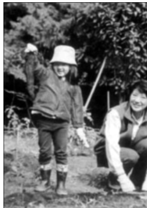
پرئنسیس لهگه ل کیزه که ی له ناو باخچه ی کوشکدا