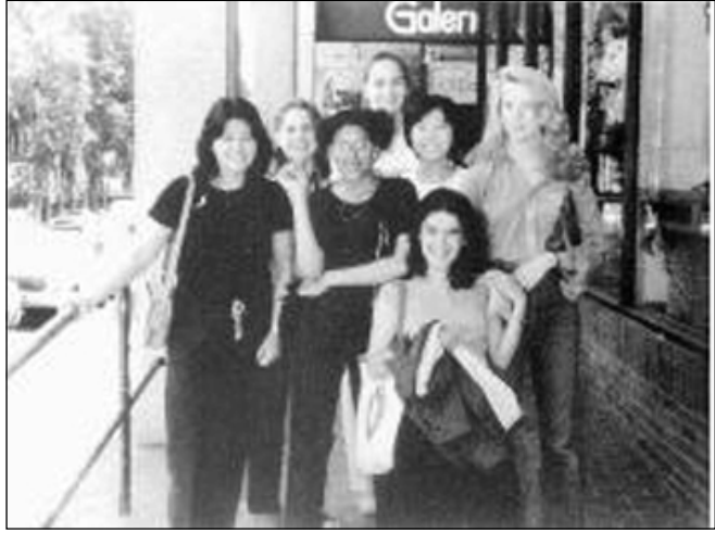
ماساكو له گه ل هاو پييه كاني