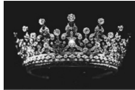
ئەو تاجە بوو شاژن ماری لە بووكينى كیژەكەى پيشكەشى كرددوو

سالانە ھاوینان ۱۷ ژورەكەى كۆشكى پاشايەتى بۆ خەلك دەكرىتەو، نمايشەكانيش پەيوەست دەبن بە ميژووى بنەمالەكە، پەيوەندى بەریتانيا بە ولاتانەو ەدبەستىتەو. لە يادى ۶۰ سالەى ھاوسەرييان ەرچى گەنجينەى زېرو زيو ەهپە نمايش دەكرين، يەككە لەو ديارىيانەش ئەو دانتیلەيە كە بە دەستى خودى (مەھاتما گاندى) يەو ەريستراو، ئەو ديارىيانەى لە دايك و باوكييەو بە ديارى وەرى كرتوو، وەك گەردانەى ياقوت و ئەلماس.