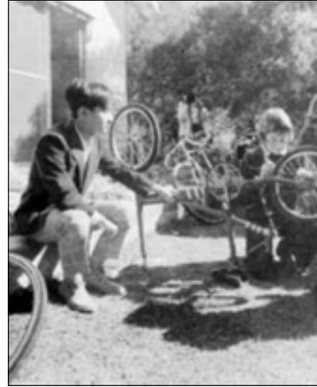
ناروهيئو به منالي