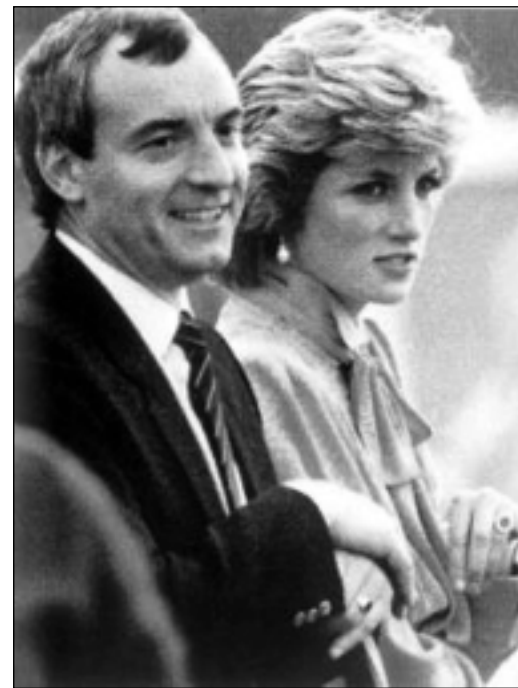
دیانا و پاسهوانهکهی ماناکی

پرینس تشارلز له پشوووهکانی کوٹایی ههفتهدا، له هایجرۆف لهگهڵ کامیلای دۆستی دهماپهوه، دیاناش لهو ژووانانهی میردهکهی ناگادار بوو. ئەو دهیزانی کامیلا له هایجرۆف وهک له ناو مالهکهی خۆی بیته، ئاوا دهسوورپهتوه. دلنیش بوو لهوهی پهیوهندی ئەو به میردهکهی زۆر دووره له برادهرایهتی. جوانییهکهی دیانا لهو مهسهلهیهدا وهک چهکیکی لاواز بهکارهاتوه. رۆژانهش رهوشه دهروونییهکانی دیانا بهرهو خراپی دهچوو. پاسهوانه تایبهتییهکهشی باری ماناکی، بهردهوام هاورپی دهبوو، ههروهها خهفتهی گهورهشی ئەوهبوو، ههردوو جگهگرگۆشهکانی ویلیام و هاری زۆرتتر ئارهزوویان بوو لهگهڵ پاسهوانهکه بمینینهوه، ههزیان له لای دایک و باوکیان نهدهکرد. ئەوان چهندین نهینی ژیان و رۆژانهی کامیلا نازاری کوشندهیان ههدا.