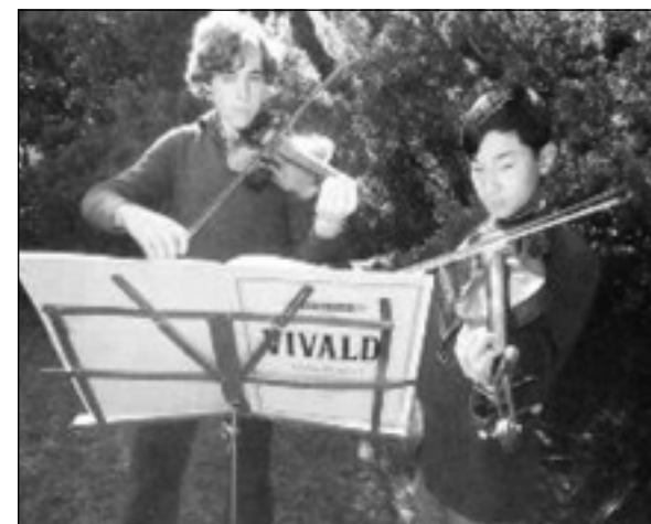
ناروهيئو و ئادم هاربرى هاوپتى كهمانچه دهژنيت