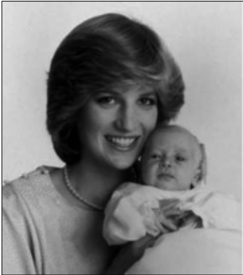
پرینس ولیهم و دیانا- یولیوی ۱۹۸۲

میژووویییه که ی گری دهدات، ئەو سیستهمه یه ولاته که له ناو ئەو گیتراوه سهخت و گۆرانکاری و دژوارهی جیهان ئارام رادهگریت.