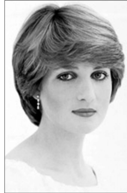
دیانا به کهس تیر نه دهکرا