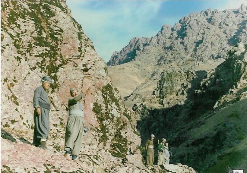
هاوینی 1987 ، نوسه ر (لای چه پ) و وه ستا محه مه دی نانه وا (مام بارام) و چه ند پيشمه رگه يهك ، له گه رمیان و قه ره داخه وه به ره وه باره گای هه ریم له چيای گارا و مه تین.

لهگهگ لهو پيشمه رگه دليرانه ماندا كه ياریده ده رمان بوون له شاره زايی ريگا و له دورخستنه وه له كه مینی جاش و سويا. ئه مه له كاتيكا كه هه موو ئه ندامانی تری لیژنه ی هه ریم ، وهك ئیمه له ناوچه كانی خویانه وه به ره وه هه مان بنكه ی (به ریرسی) هه ریم ئه كه وتنه ری.