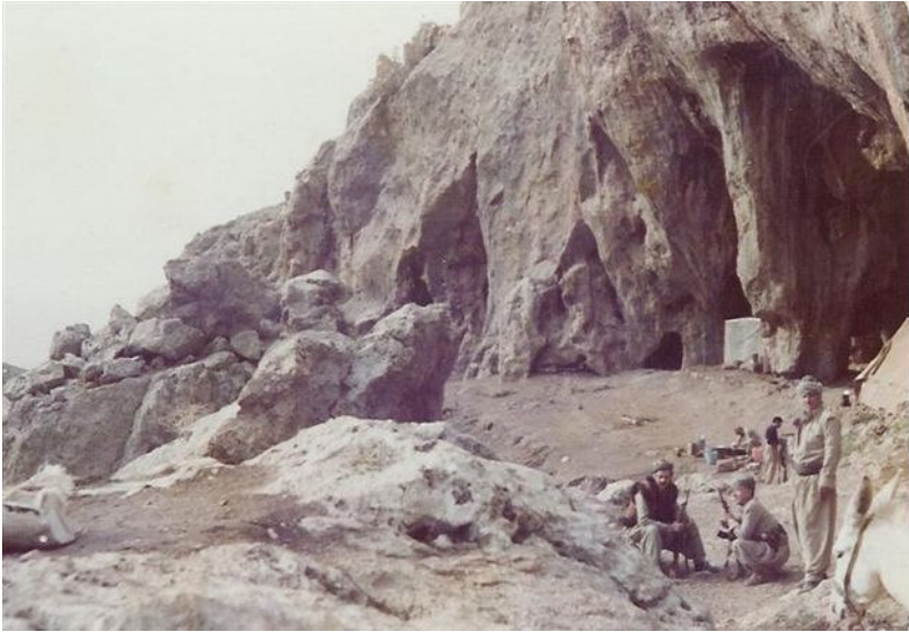
دهرواهي ٺهشڪهوتي هزار ٺه ستون ، نوسهر (به پيوه) لهگهگام سالح و شيخ سهعيد بهرنجبي

هاورپي ڪهريم و مهفره زه ڪهي بوون به چاوسا غمان و ڪهوتينه پري. له نيوهه شوه ويڪي درهنگدا گهيشتينه شاندهري ، بهو شوهه ناوهخت و درهنگيهه دابهش بووين بهسهر مالهکاندا و خزمه تيڪي زور باشيان ڪردين. پاش ناخواردن و پشودانپيڪي ڪم ، له بهره بهياندا بهرهو شاخي سورين ڪهوتينه پري ، به ناو گونده راگوپزراوه ڪهي چنارهدا تپهه پرين و دهمه و نيوهه رو گهيشتينه بارهگاي لقي هوهتي هله بهجهي حيزيمان له ٺهشڪهوتي هزار ٺه ستون. چاومان ڪهوت به هاورپيان و نهوشيروان و ڪاوهي شيخ لهتيف بهرهحمهت بيت ، بهلام چهڪداری حسڪي لي نهبوو.