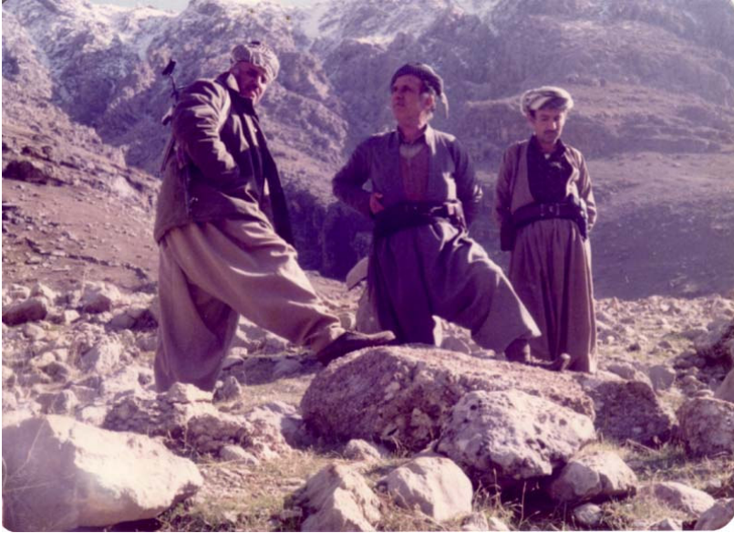
بهړپوهه راني رېڅخراوى مهلى كهركوك له سهروى كه رهجاځ ، نزيك (پلهى مهلا مستهفا) ، نوسه ر (لاى چهپ) ، مهلا شكور (مام فهتاج) و سهيد على جهباريى

رېښمائي و هاوڪاريهه كى نه بهردانهى هاوړپياني رېڅخراوى ليژنهى ناوچهى كهركوكى حشع.