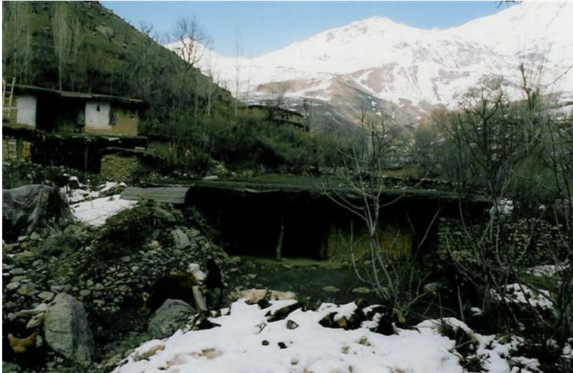
پشتتاشان (سالى 2000) ، دانىشتوۋانەكەى لە گەرانەۋە و ئاۋەدانكردەنەۋەيدان

ئەبېتەۋە و ئەكەۋنە ژىيانىكى سەخت و ناھەموارەۋە و تا رادەيەك لەيەكتەر دائەبىرپىن . ئابورى و دابىنكردى بىژىويان بىرېتېيە لە ئازەلدارىي و پارگرتنى ھەنگ و كشتوكالى ۋەك رەز ، باخ ، گوپز ، توتنى بۇنخۇش و مېۋە .