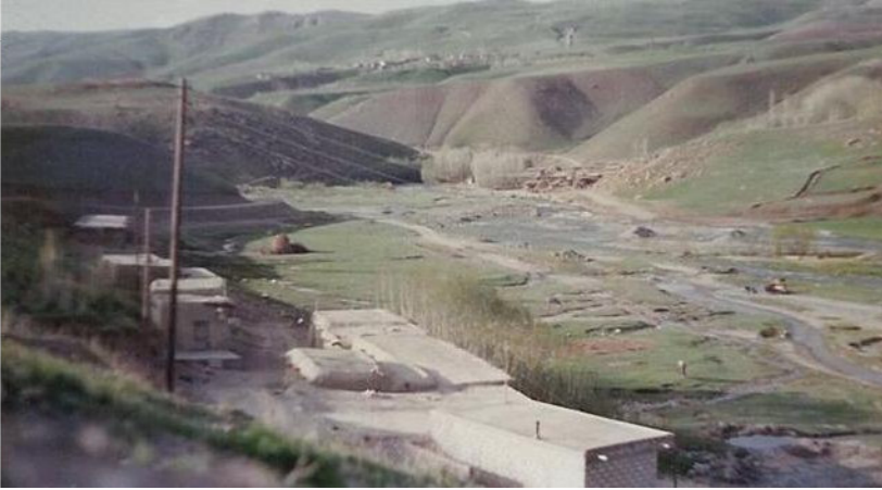
دیمه نیکی گوندی سیلوی

ټه وټنده به جیددی له سهر هاورې کهریم دوان و توانج و تانه یان لېدا و خستیانه ژیر باری ره خنه و سزاوه ، ټه گهر دهستی هه لنه برپایه و نهی وتایه راسته گونا هبارم ټه وا ټه وټندهی تر په پ و بالیان کردبوو! به هر حال ټه و زور به ناحه قی سزادرا و ټه وانهش که بهر برسیاری سهره کیی ټه و تیکشکاندنه بوون! به تاییه به تیی مه کته بی عه سکه ریی ، وهک بهرزه کی بانان دهر بازبان بوو و له بیر چوونه وه.