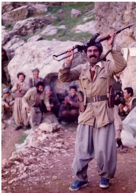
21ى ئادارى 1984 ئاھەنگى جەئنى نەورۇز لە كەرەجال لە بارەگای مەلئەندى كەرکوك و سلیمانى حشع ، ھاورپئ مەناف ، ھاورپئەكى عەرەبە ، سەماى (ھیوہ) ئەكات

ئەبووايە سەركردايەتى و مەكتەبى سىياسى و مەكتەبى عەسكەرىي حىزبىش ئەم رووداۋەى بەسەردا تىپپەر نەبووايە و خۇى لى بىدەنگ نەكردايە و ھەلۆپىستى خۇى ديارىبىكردايە ، بەلام ئايا ھىچيان كردد؟