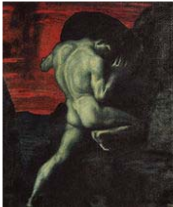
سىسيفۇس: دروستكەرى ۋىنە: فرانتس فۇن شتوك 1920

ئەۋە رۇحىكى زامدار ، ئەۋە دلى ھەنجنەھنجراۋى من ، شەۋم تىپەپاندوۋە و رۇژ لەپىشمەۋە بارى دەيان سال خەم بەخۇمەۋە بەستوۋە ھاتووم لىرە لەلات بم نامەۋى چىدى برۇمەۋە ، ئەفرۇدىتە دەشىت من لە سەدەكانى ناۋەپراستا لە ناۋەندى رۇمدا سووتىنراپىتم دەشىت خودى سىسيفۇس بوۋىتم زنجىرىكى بەھىزم لە گەردنى تاناتۇس ئالاندې بۇ توۋرەكردن دەيانجار تسۆيسم لە شىرىينى خەۋدا راجلەكاندې ، ئارىس نەبايە من دەمىك بوۋ مەرگم كوۋشتبوۋ دەمىك بوۋ ملوانكەى ئەفسانەيەكم لە گەردنى ئەۋىش كىرېۋو ، تاۋانى من ئەۋە بوۋ بە ئاسۇپۇسم گوت: تسۆيس كچەكەتى رپاندوۋە من ھىچم نەكردبوۋ پاشايەك بوۋم پاستىم بۇ خۋاى رۋوبار دركاندېۋو ، پاداشتى من سەرچاۋەيەكى ئاۋ بوۋ سزاي من سەرخستنى گاشەبەردىك بوۋ بۇسەر لوتكە بەرلە گەشىتم خلدەبۇۋە ، ژيانم لىۋانلىۋى ئازار و ژان بوۋ ،