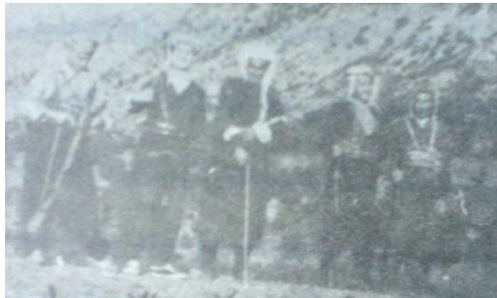
له چهپهوه: ۱- نهناسراو ۲- مهلائواره ۳- مهلاى كاژه ۴- شههید قهرهنی ۵- شههید حهسهن ئەلیاس (هاورپیکانی ئاواره)

ههی لایه لایه رۆله لای لایه هیوای دوارپۆژم له دهس تۆدایه