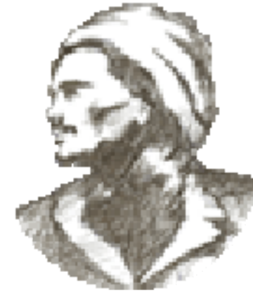
شهيد مه لائاواره