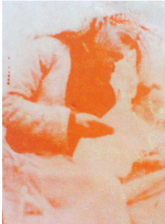
ئاواره ی نهمر بهر له ئیعدام، کاتی له دزی رژیم قسه ی ئاخری ده کات.