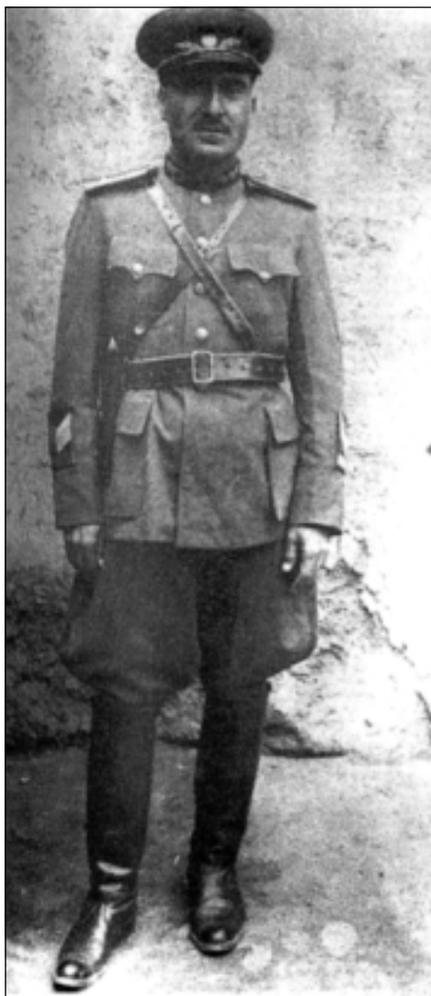
ژەنەرالی کۆماری کوردستان؛ مستەفا بارزانی