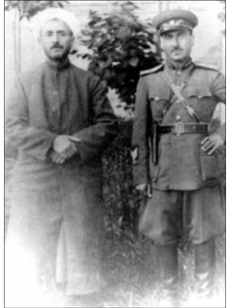
سهرۆك كۆماری كوردستان پیشهوا قازی محهمهدو ژهنه رالی كۆماری كوردستان؛ مستهفا بارزانی