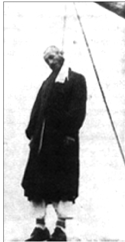
سهروک کۆماری کوردستان