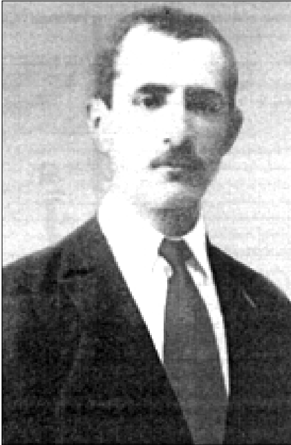
پیشهوا قازی محهمهد