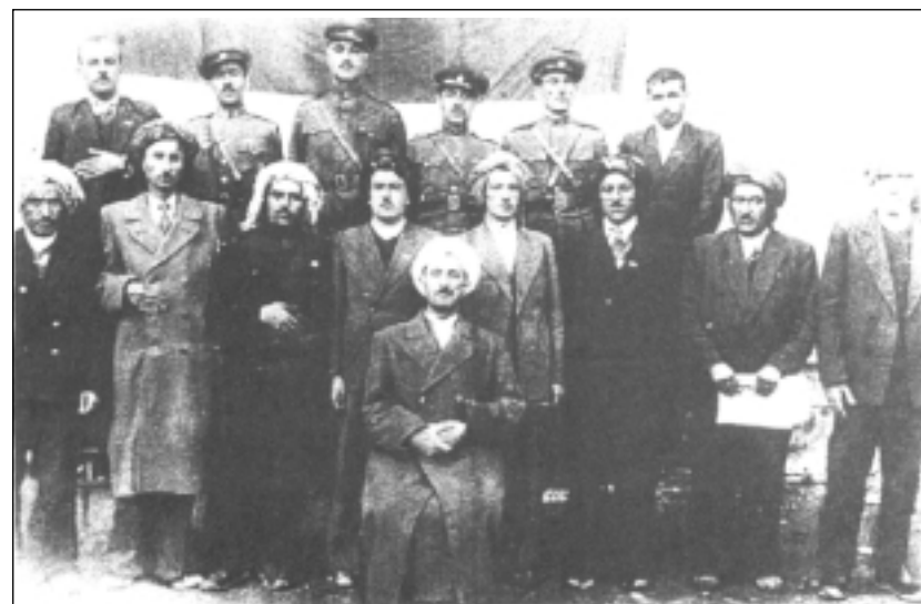
ئەنجومەنی حکومەتی کوردستان