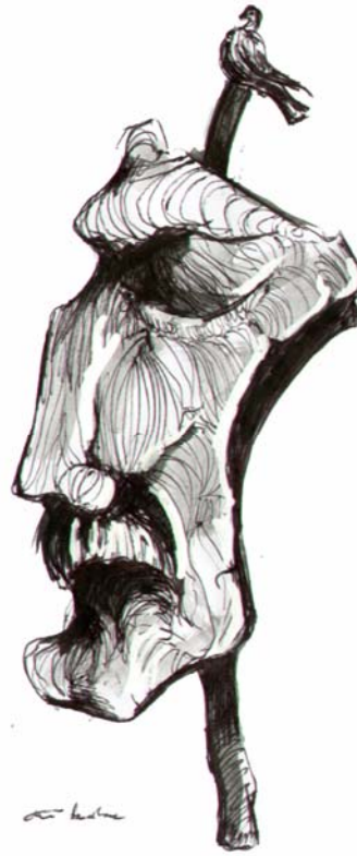
سهره‌تای دیمه‌نه ساده‌کان