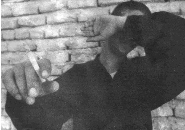
خۆدزینه‌وه‌ی تووشبووان له کۆمه‌ل

تی‌بینی: ئەو که‌سانه‌ی که ئەم مه‌واددانه به‌کار دینی, له کاتی تاقی کاری می‌زدا, هیچ شتی‌ک نیشان نادا, چونکه ته‌نیا له باری ره‌وانی‌یه‌وه شوینه‌وار دادنه‌ی و تی‌که‌ل به‌ جسمی مرۆف نابێ. تووشبووان هه‌ر کات پی‌یان خۆش بی نه‌شه‌ بوونه‌که‌یان نه‌می‌نی رۆنه‌که‌ره ده‌خۆن و دینه‌وه سه‌ر حاله‌تی ئاسایی.