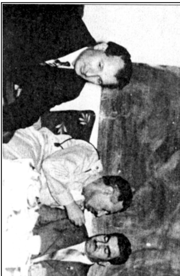
سەرۆك بارزانی نهمر - نهفسهر - قهدری جان (عیراق) ۱۹۵۸ نهم وینهیه له پهرتووکه کههه دلاوهه زهنگی (نقیسکاری کورد قهدری جان) وههگیراوه.