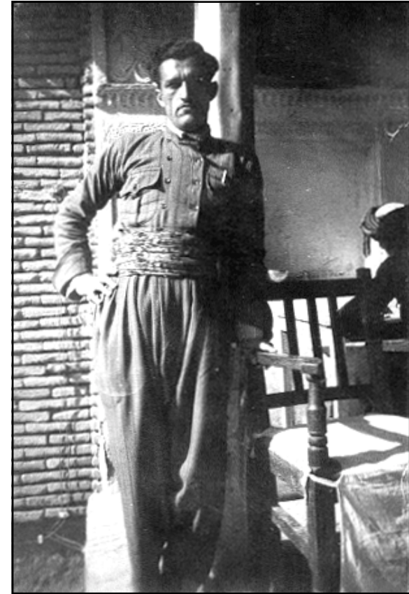
شاعیر له تافی لاییدا قهه‌داخ - سۆله