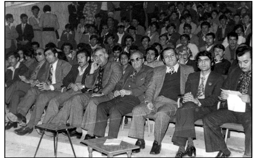
له نیتوانی رۆشنییراندا هۆلی گه‌ل - هه‌ولیر