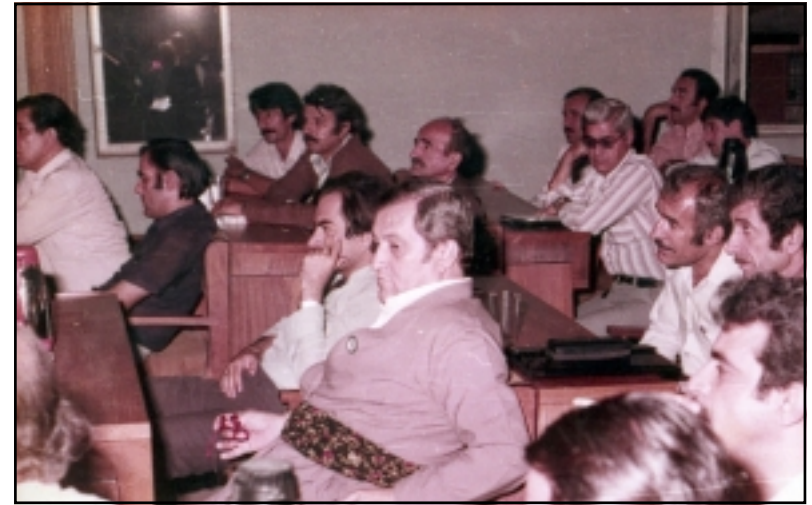
شاعیر له کۆنگره‌ی په‌کیتتی نووسه‌رانی کورددا