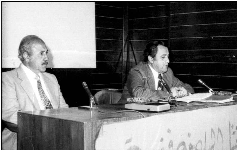
سلیمانی-زانکۆی سلیمانی نیسانی ١٩٨١