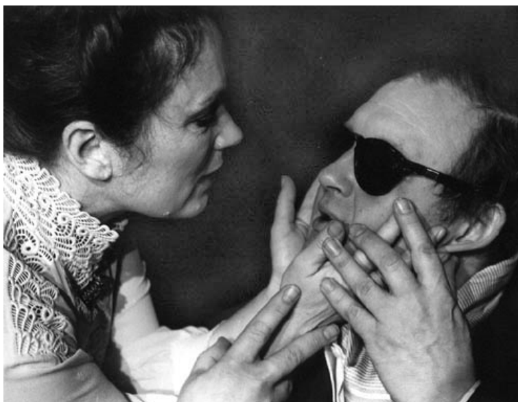
دیمه نیک له شانوییه که

تهنها پروناکییه که له شانوییه که دا هه بیته، تاریکاییه کی ئیوارانهیه، که رهنگیکی شینی کال له گهل پروناکیی کاره بایه کی که م بکه ویتته سهر ههردوو کاره کته رهکان، پیویسته کورسییهکان به قوماشیکی ئاوریشم نهخشینراو به رهنگیکی گولی یان سهوز داپوشراییت و له ته نیشته کورسیی دووه مه وه ئینجانیه که دابنریت، نه مامیکی دارخورما یان (سرخس) ی تیدا پروینراییت.