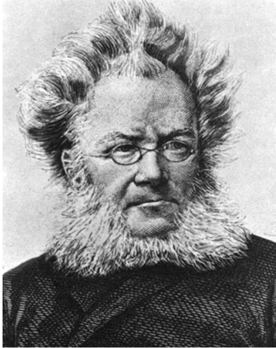
هینریک ئیپسن ..

ئەو نووسەرە نەرویجییەکی کاریگەرییەکی زۆری لەسەر (ویامز) بەجێهێشت