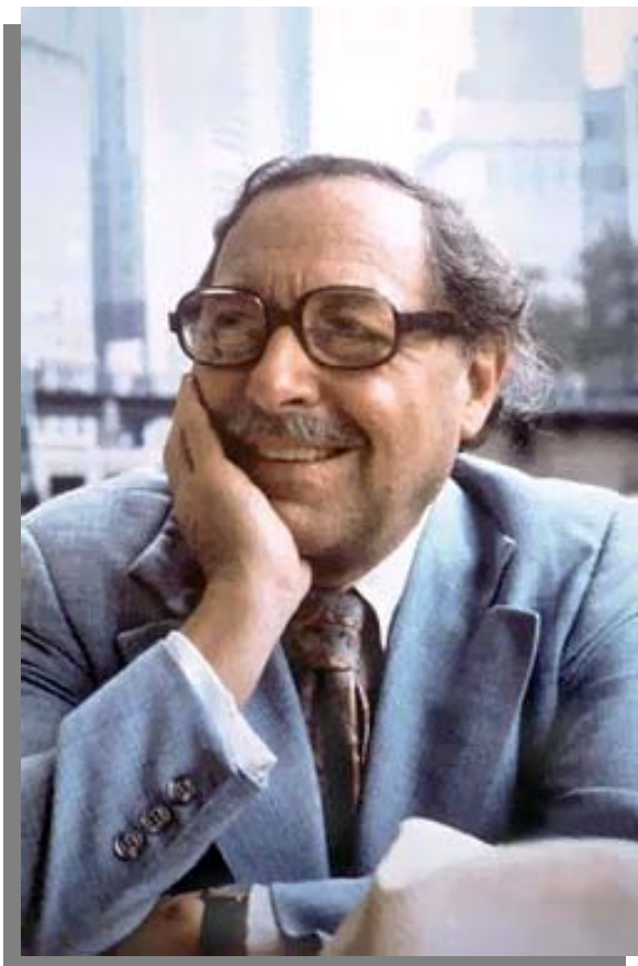
تينسى وليامز ..

ئەو شانۇنوسەي رۆلى ھەبوو لە پېشكەوتنى شانۆي ئەمەريكىدا