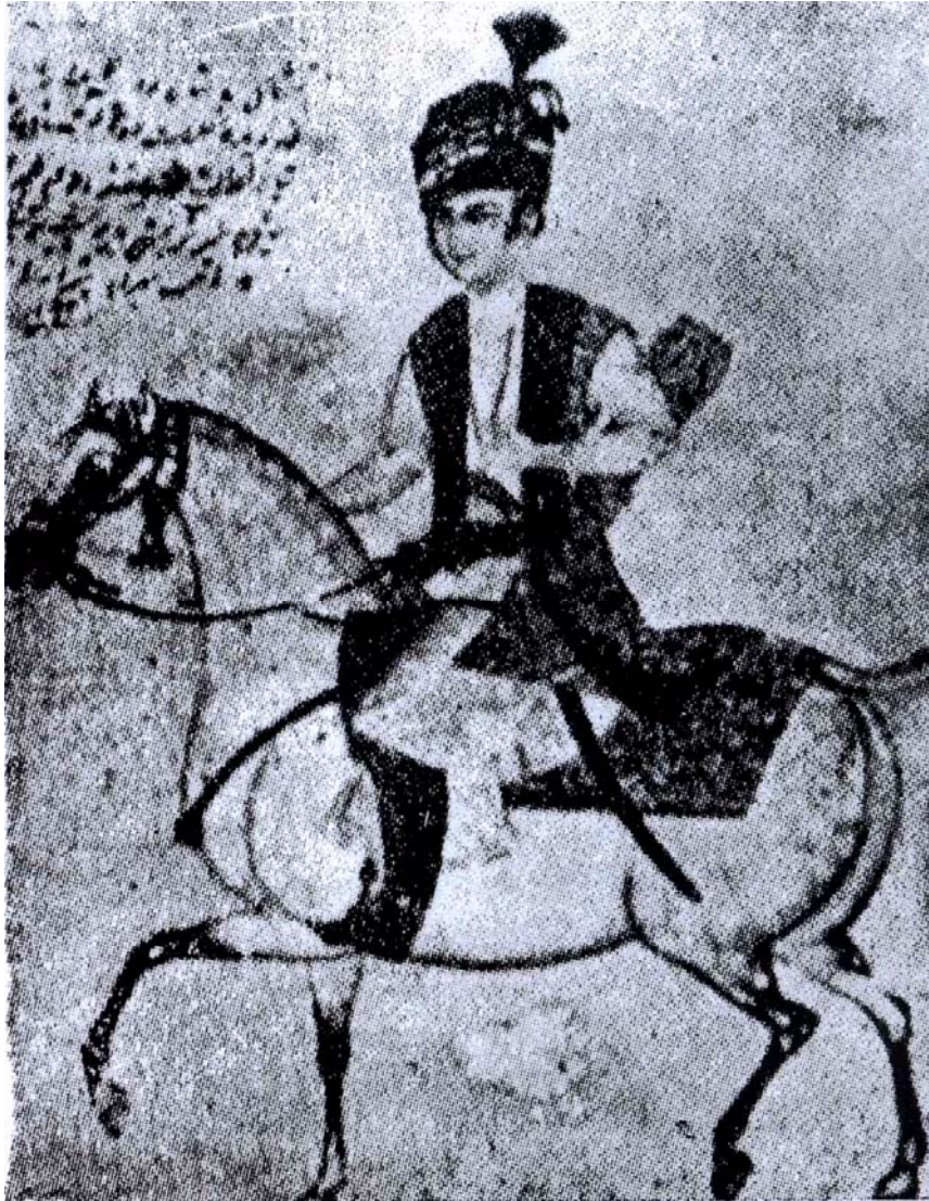
لوتف عه‌لی خانی زه‌ند - ئه‌م وینه‌یه‌ له‌ موزه‌خانه‌ی ئیراندایه

که‌سیکی تریش که‌ له‌سه‌ر داوای حاجی ئیبراهیم به‌خشا عه‌لی قولی خانی کارزونی بوو. ناوبراو هۆی سه‌ره‌کیی رزگار بوونی سه‌ید مراد خان و براکانی له‌ زیندان و گوشتنی جه‌عه‌فر خان بوو. ناوبراو له‌گه‌ڵ براکانی چوونه‌ پال حاجی ئیبراهیم و که‌وتنه‌ دانانی پیلانی کوده‌تایه‌کی خشکه‌یی دژی لوتف عه‌لی خان.