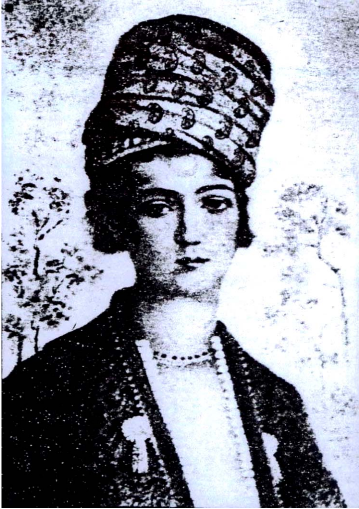
نوتف عه لی خانی زهند