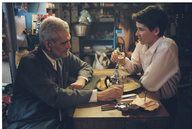
عومهر شریف له رۆلی مسیۆبرایم له گه ل مه مۆ (وینه ی فیلم)

عه رب له پیشه ی به قالی دا یانی، شه و ورؤژ ئاواله بوونی دوکان، ته نانه ت رؤژانی یه کشه ممه ش.