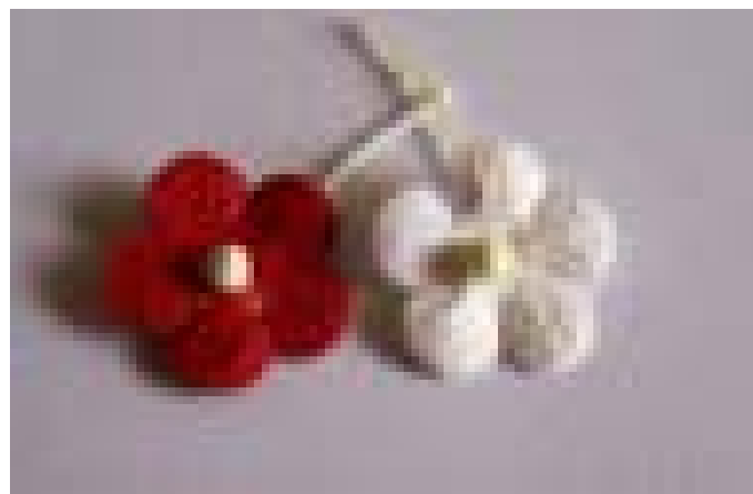
گولەکانی ناو قورعانه کانه که ی میسیؤبرایم