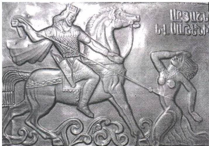
ئەم وێنەیه له ڕینگای خانەوادەیی کاسبەرەوه له ئەرمینیا هاتۆتەوه کوردستان

وه به پلهی دووهم كهركوك دههات، ههمه دانیش به پلهی سێیم دههات بۆ بلاوكردنهوهی مهسیحیهت به تایبهتی و به گشتی له رۆژهه لاتدا. لیڕمدا دمتوانین بلیین به هۆی ئەو ئازار و چهوساندننهومیهێ که دمهسه لاتداران ههیانبوو بوو به هۆکاریکی گرنگ بۆ بلاوكردنهوهی مهسیحیهت له كوردستاندا.