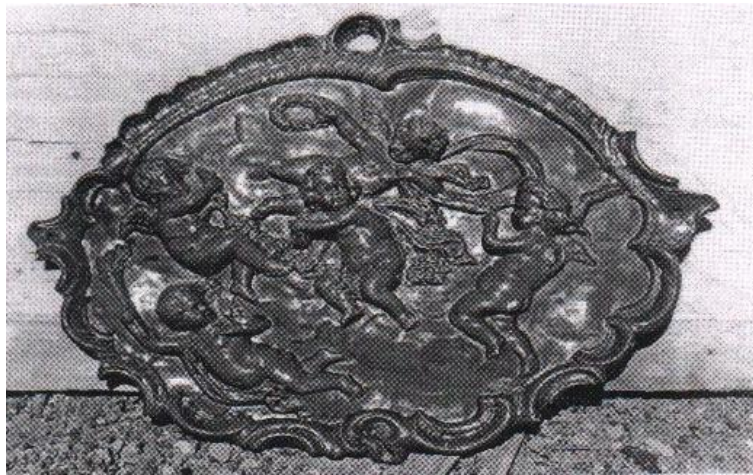
وینە ی فریشتە لە پێگای ئاینی یەهودیی و مەسیحیە وە هاتنە ناو شیۆه کاری لە کوردستان بە تاییهتی لە ناو ئاینی زەردەشتی و هی تر