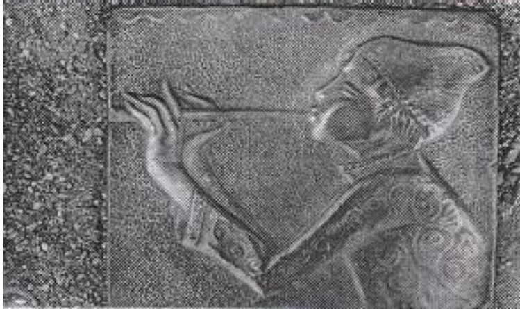
پەرستن بە مۆسیقاوہ لە کلیسای کوردیدا