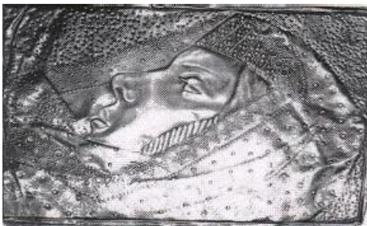
وېنەى باوہردارىكى كورد لە كاتى نوژى مەسىحى

ھەربۆيە دەبىنين كە ئاينى مەسىحى رۆلى كەمتر نەبووہ لە ئابنەكانى ترى ناوچەكە لە بەرەوېشېردنى ژيانى ئافرهت و كار و پاىەيان لە كۆمەلدا چ لە رووى كۆمەلایەتىيەوہ بېت يان زانىارىيەوہ ياخود ھەست كردن بە بوونى خۇيان وەكو مرؤف و شان بە شانى پياو لەناو كۆمەلدا.