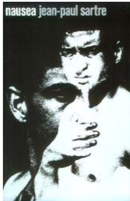
بەرگی رۆمانی (هیلنج)