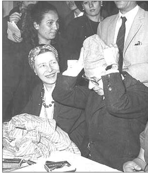
سارتەر و سيمۆن دى بۇقۇوار