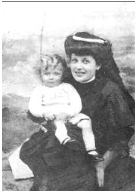
سارتهر و دایکی