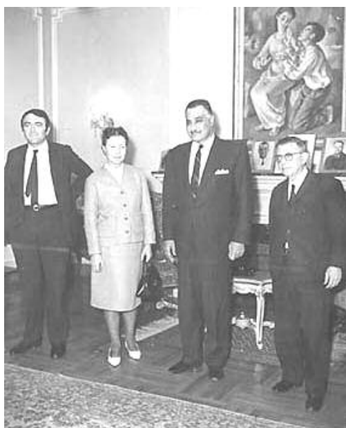
سارتەر و سيمۇن دى بۇقۇوار لەگەل جەمال عەبدوولناسردا