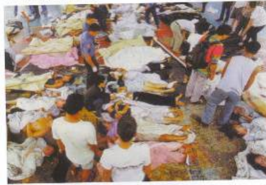
The bombing of a nightclub in Bali on 12 October 2002 caused the deaths of dozens of

وینەى دووهم: تەقاندنەوہى يانەيەكى شەوانە لە بالى لە ۱۲ى ئۆكتۆبەرى ۲۰۰۲دا بوو ھۆى مردنى چەندەھا دەرزەن خەلكى گەنج. ئەنجامدەرى كارەكە دوايى لەلايەن دەسەسەلاتدارانەوہ دەستگيركرا و بە خەندەو پىكەنينەوہ دانى بەتاوہنەكەيدا نا .