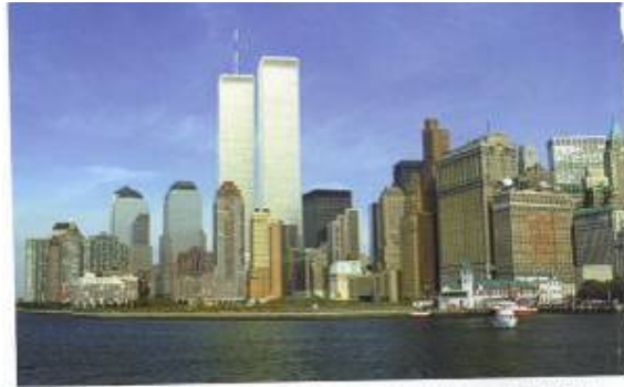
The twin towers of New York's World Trade Center prior to 11 September 2001. The impact of two commercial aircraft totally destroyed the buildings, killing thousands. Terrorism had entered a new age.

وینەى يەكەم : دوو تاوهرەكەى سەنتەرى بازارگانى جیهانى لە نیۆرک بەر لە مەرگەساتى ۱۱ى سېپتەمبەرى ۲۰۰۱، فشارى دوو فرۆكەى بازارگانى بەتەواوى بیناكانى دارمان و ھەزارانى كوشت، تیرۆریزم پىی نایە سەردەمىكى نوپۆه.