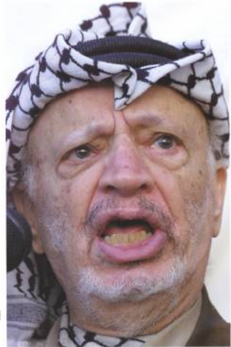
Yasser Arafat, leader of the PLO, a position he retains to this day. Despite the many... The man made out the common the Palestinian people.

ياسر عرهفاتی سهرکردهی PLO ، ئه و پۆستهی که ههتا ئه مپۆ له دهستی نه داوه . سه باری ئه و هه موو که رتبه وون و تا قمگه ریتیهی فه له ستینییه کان ، ئه و وه کو ئه و تاکه دهنگه تا قانهیه مایه وه که نوینه رایه تی خه لکی فه له ستین ده کات .