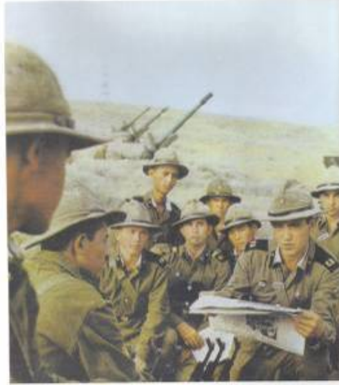
Above: British Troops in Afghanistan in the 1980s. Their withdrawal from the country left a huge army of well-trained Afghans behind. Many of these fell under the control of Al Qaeda and Osama bin Laden, who used them to propagate world terrorism.