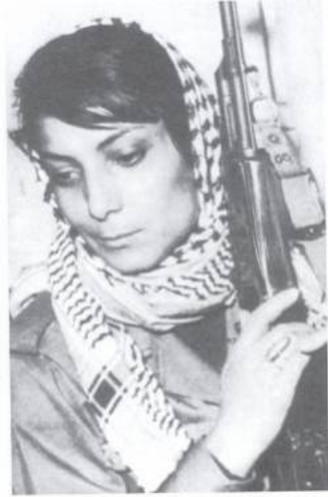
Leila Khalid, the first 'volunteer' of Ansarom. She became a symbol for the youth of

لهيلا خاليد، يهكهمين "ئەستىرەى" تيرۆريزم، ئەو بوو به رەمزىك بۆ گەنجانى فەلەستين.