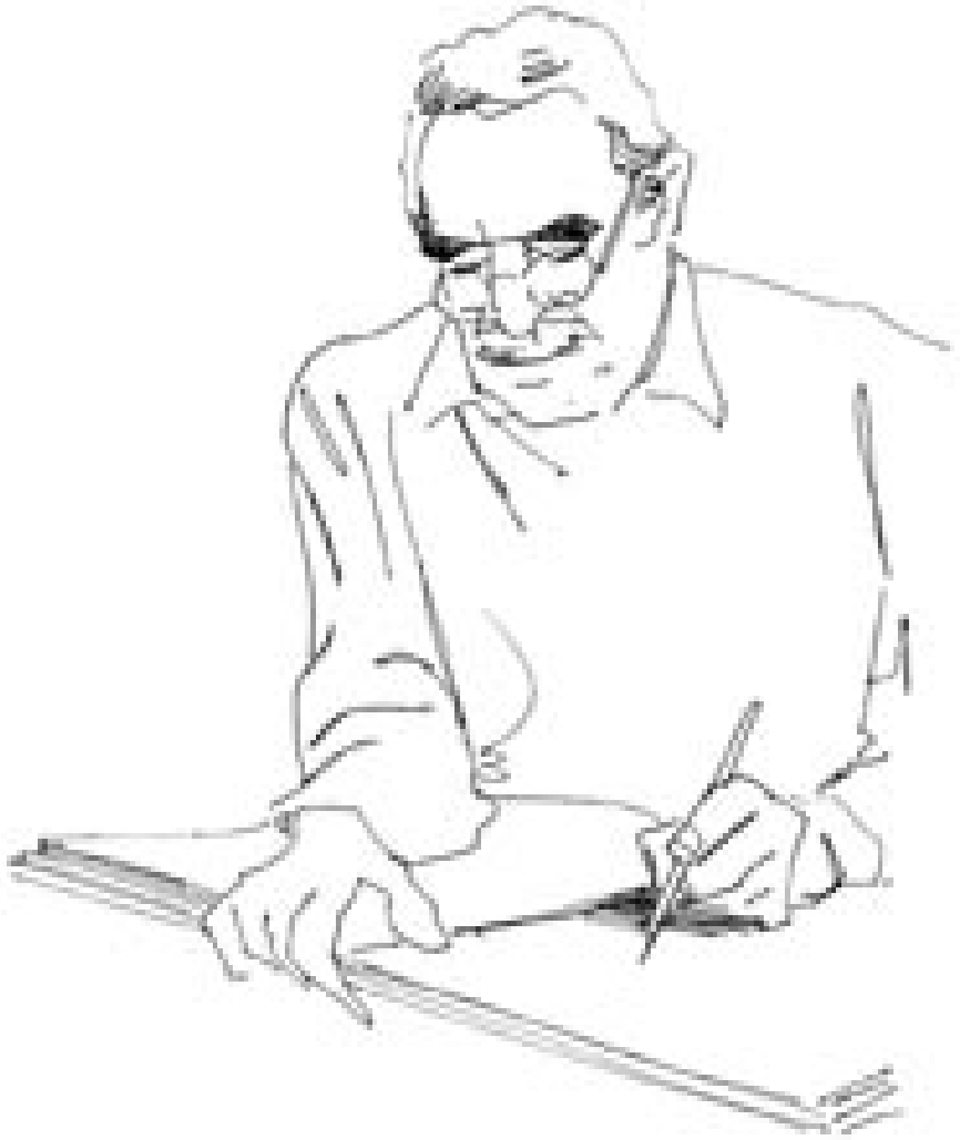
گابریل گارسیا مارکیز