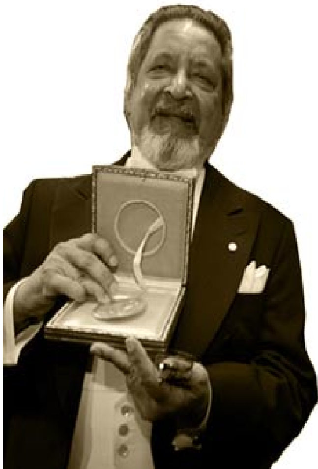
فی. ٹیس. ناپیول