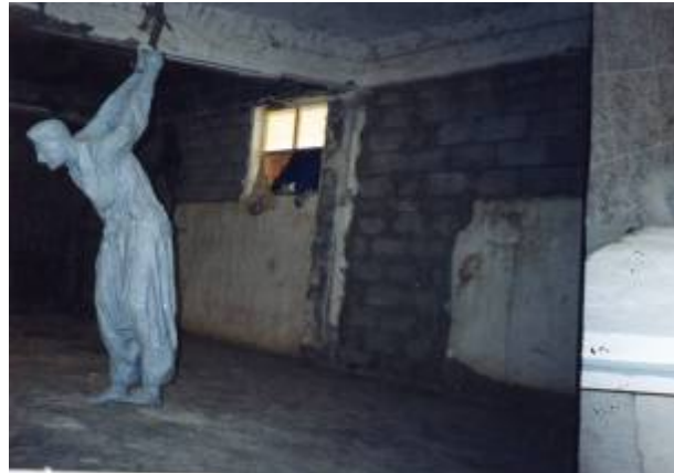
ئە مە ش ديمە نى جو ريك. له هه لوا سينه. له پشته وە

بە راستى ئەم هونراوئەيه لام زور شايستە بوو بو ئەم شوينە بويه به خوشييه وە نووسيم لهگەل داواي ليبوردين له ماموستاي بەريزم كه به بيئاگاي خوئى نووسيم. بەلام وەلام نەدانە وەم لەو پيلينانەدا لەو دەترسام؟؟ كه من بيمە دزيو ناشيرينترين مروقه! لەو كاتەدا مردن زور لام خوش بوو، چونكه دوو ريگەم له بەردەمدابوو يان مردن يان پيلينان، ئەوان زول بوون دەيانهيشتتە وە، يەكسەر نەياندەكوشتى جا بويه هەر چاره نەبوو، بەلام قورسترين وشە له زيندان (ئيعتراف) بوو ئەويش لەسەر يەكيك كه بيئاگا بيت له كاروبارى شوپش و خەبات، ئەمانيش ئەوئەندە بەدره و شت بوون ناوى بالندەت بەدايه دەيانهاني بو دانپيدانان.. ئەو وشەيه لاي من زور مايەي سەرزەنشت بوو ئاموزگار ييه كانى سەرورەر هەر له ميشكمدا دەزنگايە وە.. هه موو ساتيک كه بىرم دەكردە وە وزەي پيدە بەخشيم، بەلام ئەو ليئانە و تەمەنم زور جياواز بوو، ئەگەر، ياسايەكى مروقايتە هەبوايه، شويني ئەشكەنجەدانەكە و كەسەكان و بينا كەشيان پيکە وە دادگايبەكرد، بەلام بەداخە وە ياساي مروقايتەي ئەو سەردەمە ئەو بوارەي خولقاندبوو كه ريگەي دابوو بەو نامروقاڻە شەلم كويرم ناپاريزم، گوئ نەدەن بە چاره نووسى كەس، بويه