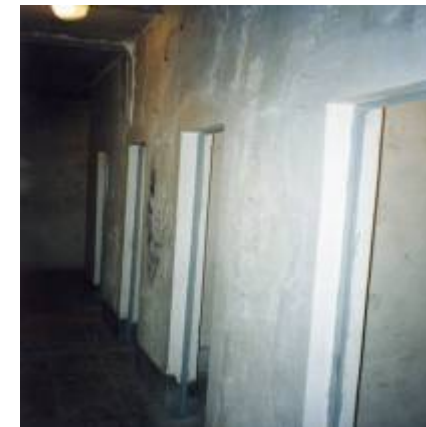
رى زېك ژوررى تاك

تەسكەدا چەند ژورېك دروست كرابوو له يادم باش نيبه ئايا سى ژورر بوو يان بەرەو سەر من له ترسى نازارى گيانم و له ترسى ئەو داها تووهى كه دېته بەرچاوم زۆر بەناگا نەبووم دياره تو چاوه پروانى پارچه پارچه كردنى خۆت دەكەيت ئەو شوپنە يە كەم شوپنى سەرەتايى بوو كه دەچوو پتە ژوررەو ئەگەر هېچ نەبوو پتايە هېچ شتېك لەسەرت نەسەپن بەس چوونە ژوررەو شەش مانگ دەمايتەو خۆ ئەگەر بۆنى رېكخراو پتە لېبھاتايە ئەو دادگا چاوه پى بوو بۆت، خۆ ئەگەر بە بەلگەو بەگريپت ئەو پېدە چيپت هەر لەویدا خويان بە ئەشكەنجە دان بىكوژن، منيان كرده ژورېكى تاكەو دەرگايان داخست لېم، بە تەقەى دەرگاكاندا