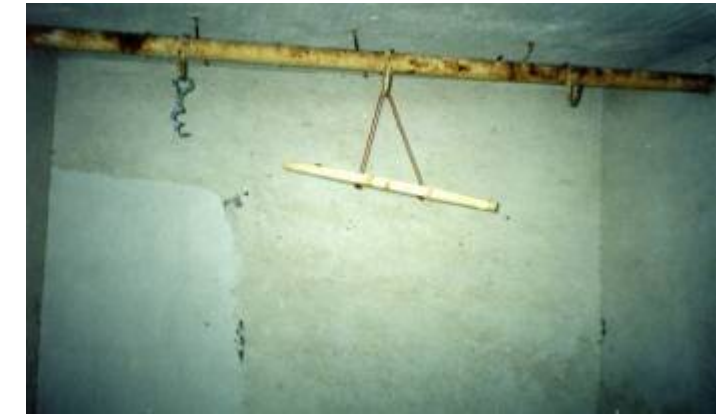
ئە مە دارى فە لاقە يە و. بۇ رىە كەش ھى (ھەلوا سين)ە لە دواوھوھ

شەروالەكەم، پېييان داكەندەم؟؟ نۆرە ھاتە سەر كۆتايترين بەرگ كە لە بەرما بوو دەريپپيەكى كورت بوو، لە بەرمدا مەھەز تاريق وتى دەي؟؟؟. بە جنيودانى خوشك و دايك دەستپيىكرد، وتى دايكەنە، وتم چى؟ وتى ئەوھى لە پيىتا ماوھ، وتم ناخر عەيبە وتى دايكەنە حيز، لاي من زۆر قورس بوو ئەو جلويەرگ داكەندە، زۆر لام ناخۆش بوو ھەرچەندە ئەوان جەللاد و خوينرېژ بوون، بەلام منيش ئەوھ يەكەم جارم بوو لە ژياندا بەو شيوھىيە رووتبكرېمەوھ، ھەتا لە كاتى مەلەكردندا قەت خۆم رووت، نەكردۆتەوھ، بەلام ھەر چار نەبوو، بۇياخچى وتەنى خستميانە سەر پليىت. منيش ئاوەرووتكرام.. ئيىستا لە زەرنەقوتە دەچم زەرنەقوتە بېچووى ئەو چۆلەكەيەيە كە ھيىشتا پەرى پيوھ نبيەو تازە لە ھيلكەكە دەرچووھ. ھەردوو دەستم لە پشتەوھ كەلەپچە كرا داياننیشانم ھەردوو قاچم پەتيكيان تىكرد.