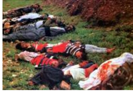
ته رمی قوربانیا نی هه له بجه