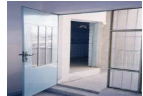
ئهمه هۆلي بهستنه وه كه يه به بۆريه كه وه له م ژووره دا په رده ي گويم. ته قى

دهستياكيان بهستم به بۆريه كه وه له سەر زهوييه كه دايننام، بهس چاوم هەر بهستراوه بوو، نه يانكرده وه بۆم، پشتم نا به ديواره كه وه، دوو سى زلله يان ليى دام و رويشتن، دواي چەند چركه يه ك گويم ليى بوو زۆر به نهيني پرسيايان، وتيان له سەر چى گيراويت، منيش راسته و راست وتم هيچ نيم، گويم ليى بوو له ولاوه وتى (پاسوكه)، ئيتير بيم كرده وه له نهخشه دانان چى بكه م، هەرچى بيم كرده وه چاره سەر نه بوو چونكه تا ئه و كاته هيچ رووبه روو بوونه وه يه كه نه بوو، بۆيه هيچ وه لاميك لام نه بوو بۆيان به لام هەر بيم له پابوردوى خۆم دهكرده وه، تومەز بهس من چاوم بهستراوه، ئەوان منيان بينى سى كهس له وانه هاوييرى خۆم بوون به لام من هەر له بيم كرده وه ئه و دهنگه دا بووم چونكه نامۆ بولام، بۆيه كاتى نيوه رۆ ئاسايى چاوو دهستيان دهكردينه وه و ده يان بردين بۆ سەر ئاو، ئەوان له پيش من تهواو بوون گويم له دهنگيان بوو بهس من مابووم ئه ويش ده بوو ليى دان بخۆم بۆيه خستميانه دواوه، كه هه موويان تهواو بوون، ئەوسا منيان برد بۆ لاي دهستشۆره كان، ويستم ده موچاوم بشۆم، عه لاي بيپره وشت ليى دام هەر له گه ل ئه و ليى دانه ي كه ئه و ليى دام ئه وه يه كه م زلله يه له هه موو ته مه نمدا كه ليى انداوم به