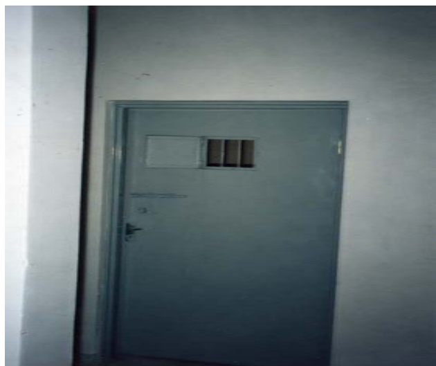
ئە مە شپوہى دە رگاى (زىندانە)

يەك يەك ناويان دەخوئىندىنەو دەيان كردين بە ژوردا. ژورنىكى 4 × 5 بوو، دەرگاگەى لە ناوہراستدا بەشى سەرەوہى دەرگاگەى بچوکی