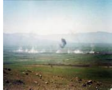
کاتی کیمیا بارانه کە ی هه له بجه