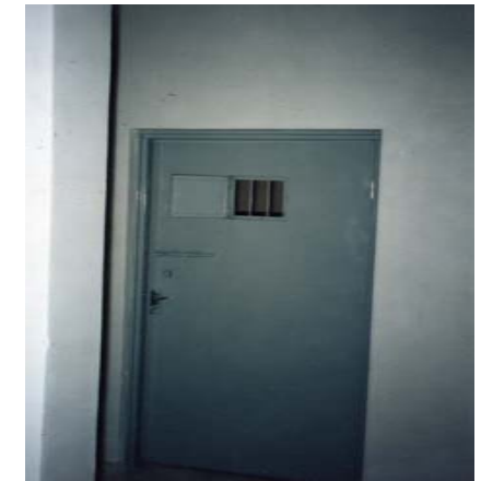
ژوررى تاك (الانفرادى)

گويم لېبوو يەك يەك هەموو دەرگاكان لەسەرم داخرايەو، بەردەم ئەو ريزە ژوررە ھۆلېكى لېبوو ئەوانەى كه كۆن بوون لەو ھۆلەدا دەخەوتن، بەلام تازەكانى ۋەكو من بۆ ناو كونه تاريكەكە من بە راستى شپو ھەموو شتەكانم بە مردووى لە دەكرد چۆن باوەر بە ژيان نەممابوو بى ھيوا بووم ھەموو شتەكانم بە مردووى لە پيش چا و بوو، كاتېك لە ژوررە تاكەكەدا بووم، دەرگاكان داخرا نيتەر مرۆقەكان ۋەك كورە ھەنگ دەستيان كردهو بە گالته و گفتوگو، بېگومان ئەمانيش زىندانين بەلام هېچ نەبېت لە من كۆتەرن، خۆ لېكوئېنەو شيان تەواو بوو، ھەرەھا لە