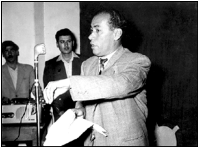
له هه موو بۆنه یه کدا ههستی خۆی دهر پرپوه