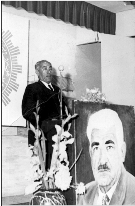
ا. ب. ههوری له یادی شیخ سهلامی شاعیردا