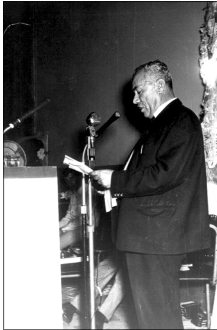
ا. ب. ههوری له یادی پیره میتردی شاعیردا ۱۹۷۰/۶/۱۹