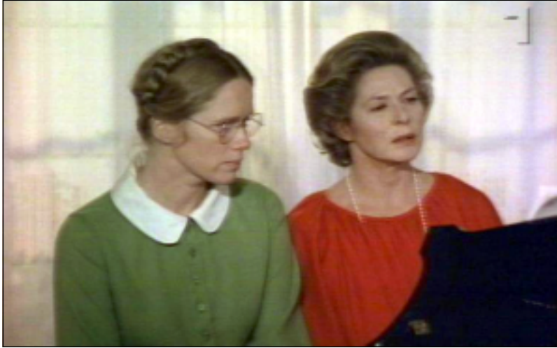
فیلمی (سؤناتای پاییز)