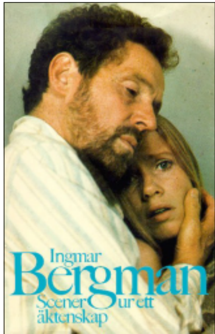
فیلمی (دیہہنگه لیک له ژبانیکه هاوسه ربه)