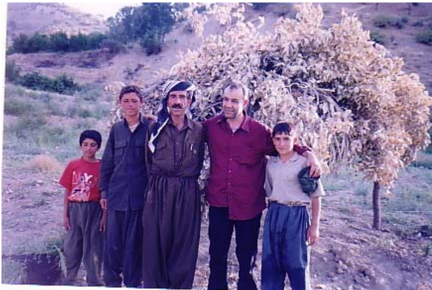
هه ندرین له گه ل خیزانیکی گوندی هه ناره، هاوینی 2005

دهکرد. بۆ ئهوهی که میخ سهبووری بهوان و خۆم ببهخشم، تهنیا توانیم داوایان لیبکه م، که وینه به کم له گه ل بگرن. پیاوه که و دوو منداله هه راشه که ی، وهک هاوخه میخ وینه که مان گرت، به لام شهرم ریگهی له ژنه که گرت، که له و وینه گرتته دا یاده کانمان کۆبکه ینه وه .