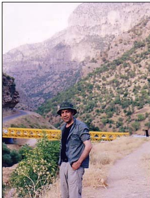
گەلی بالندە (هەندریین) حوزەیرانی 2005

لەم کۆچمەدا بەم گەری فەم و بەم دلی چرایەتەوه، کاروانیک لە نوور دەستپیکاکا: یان دەسووتی، یانیش دەبییه شەبەنگیک لە مانا