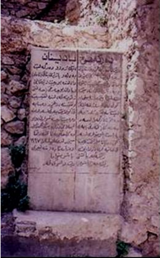
هستنووسی سهر دهرگای کونی باهدینان له ئامیدی به کامیرای ههندرین حوزهیرانی 2005