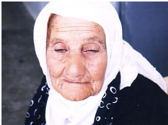
دایکم زاری، هاوینی 2005

له هیکرا ماشینه که له کولانیک به جیهیشتم، به لام "خهسته خانه ی موحه مه د باجه لان" له بهر ئه و ژانه سهره ی که چاوه کانمی داگیر کردبووم، وهک روژانی تر، به ره و ماله وه ی به له دی نه ده کردم و نیگای تاراوگه ش به ناو تاریکی ئیواره ی شوینپی یاده وه ریبه کاندای سهرگهردان ده بوو.