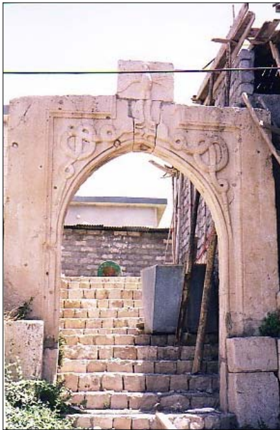
ئاميدى، ده رگاي كو نى به هدينان به كاميراي هه ندرين حوزه يرانى 2005

له ويستگه كاني داهاتوودا ئاوه زى سه روكي زانكو سوران، ئه لوه ند دزه يي ده خوينا وه، كه رولكي گرنگ له شانوي په روه رده ي نه وه ي داهاتوو و ژياني كومه لگايه كي "مه دهنى" ده نوينا، له نيازى پاكي ئه و خه مه په روه رده ييه ي خو يه وه، وه ك وي ناي ماموستايه كي كارامه، ئه گه ر وه ك ئه و بوينا خيك له چه شنى په روه رده ئاميزى خو ي له ملم بكم، ئه وه قه ولي پيدام، گه ر بگه ريمه وه و له وي بيمه ماموستايه كي هاوكارى بو پړوژه ي په روه رده ي ئه و نه وه داهاتووه ي كورد، ژنيكيشم بو بينيت!