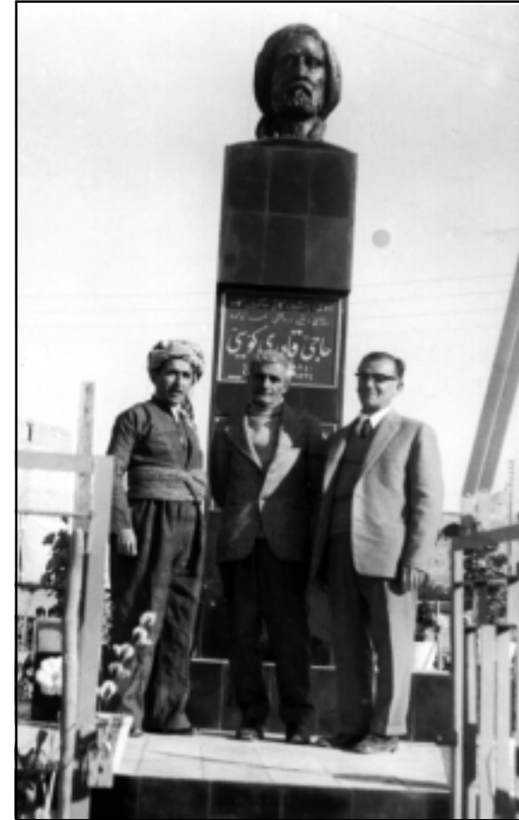
نه‌ریمان و هێمن و مه‌م له‌ ژێر په‌یکه‌ری حاجی قادر له‌ کۆیه

به‌لام نه‌گهر ئه‌و شاعیره یان ئه‌و نووسهره مرد «وه‌ک ده‌لین مانگا مرد و دو برا» تازه داوای هیچ له‌کس نا‌کا و ئه‌وی له‌ژیانا کردویه به‌بێ نرخ بژاردن بۆ هه‌موو که‌س ماوه‌ته‌وه. ئه‌وسا هه‌موو که‌س به‌بێ ترس له‌ زیان ده‌توانی ب‌لێ: زۆرم خۆشده‌ویست و خۆشم ده‌وی و چاکی گوتوه و زۆر به‌ر دلم ده‌که‌وی و نووسهریکه هه‌رگیز نامری و