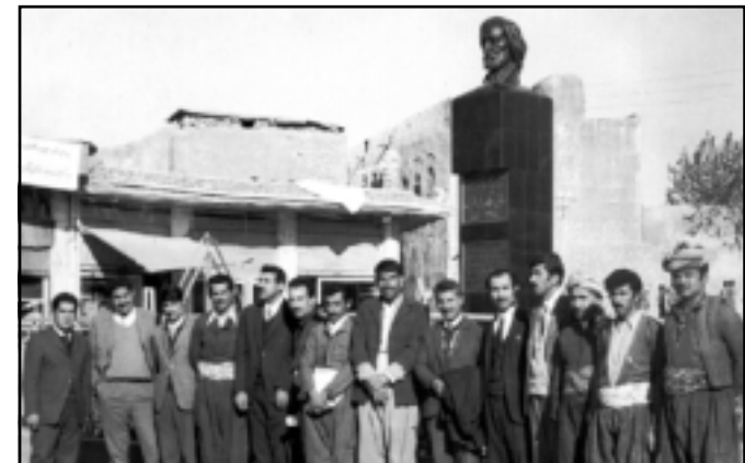
مه‌م و نووسه‌رانی هه‌ولێر له ژێر په‌یکه‌ری حاجی قادری کۆبی