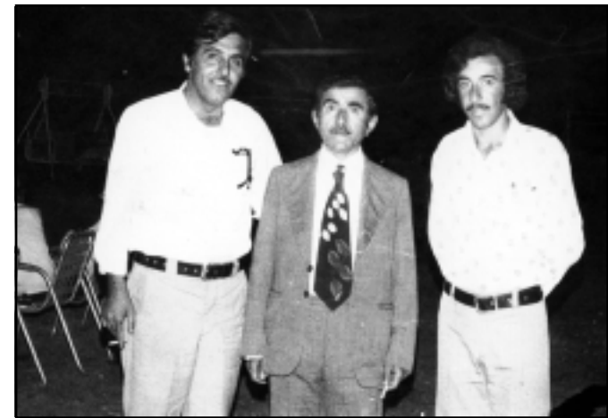
مەم لە نیوان ھونەر مەندانی شارەکەیدا

- ئەم کابرایە کیتی خۆی دەکاری من ھەلئەقورتینی و دەم دریزی ئەکات و خۆی لە دەریایتیک ئەدات کە ئەنجامی مەلەکردن لە ناویا مسۆگەر نییە؟!... ھەقە و پرسیار بکە، یا بیڕی و بکەیتەو، بەلام... جارێ گۆی بگرە پیت بلیم بۆچی دە (۱۰) شەو چۆنیەتیم وایە وەکو لە سەرەو بەسەم کرد؟!..