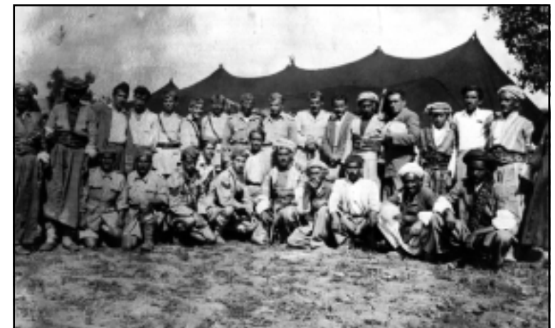
گوندی مجیسه‌ر ۱۹۵۰ له‌به‌رده‌م ره‌شمالی مه‌حموود به‌گ

ئەوا دوو سێ رۆژه له‌به‌ردام فۆتۆکۆپی ده‌سنووستیکی دیوانی سالم بکه‌م بۆ حه‌مه‌ی مه‌لا که‌ریم، که‌چی زۆر به‌زه‌حمه‌ت که‌وتوه، له به‌رلینی رۆژه‌لات ده‌لێن له به‌رلینی