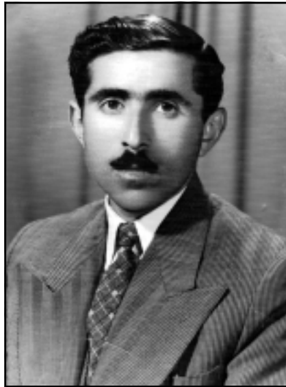
مههمهه مهولود - مههم - ي چيروكنوسوس و رۆژنامهوان و رۆماننوس