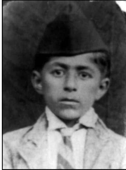
مههم له سالانى سيبهكاندا

المجلس التنفيذي لمنطقة كردستان الموقر/ اشارة للمخابرة اعلاه... للتفضل بالاطلاع مع فائق شكري وتقديري.