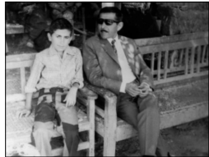
مه‌م و زاگرۆسی کوری هه‌ژار

نامه‌که‌تم پێ گه‌یشته زۆر به‌خه‌به‌ری نه‌خۆشیت دلته‌نگ بووم و غه‌یری ئاوات و دو‌عای به‌خێر نازانم چیم له‌ ده‌ست دیت.