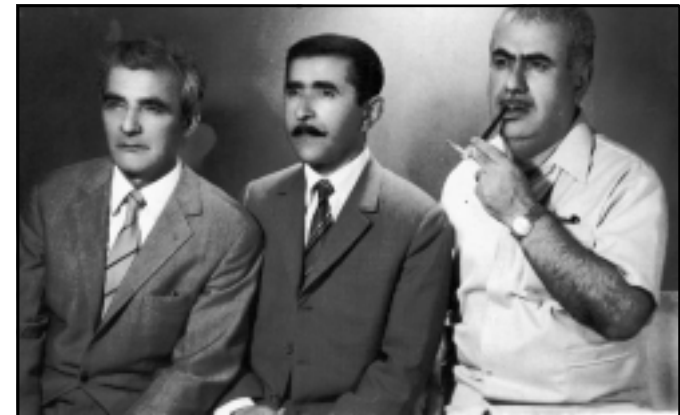
ھەژار و مەم و ھىمىم