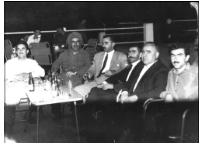
له‌ وینه‌که‌دا مه‌م و هه‌ژار «هه‌ژار به‌جلی کوردی ده‌ناسریته‌وه»