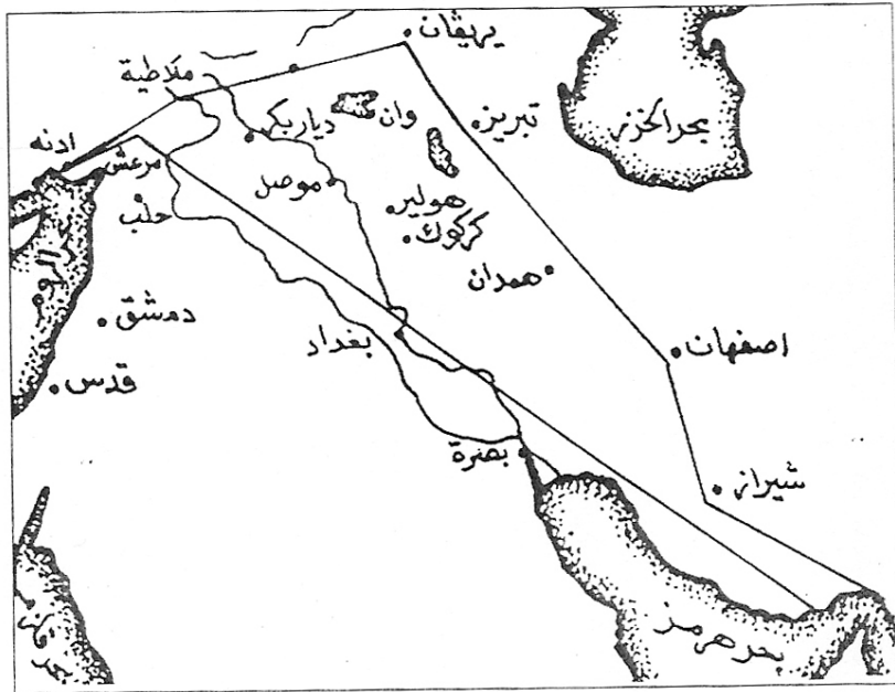
سنووری کوردستان به پیتی کتیپی: (شهره فنامه‌ی شهره فخان‌ی به دلیسی)