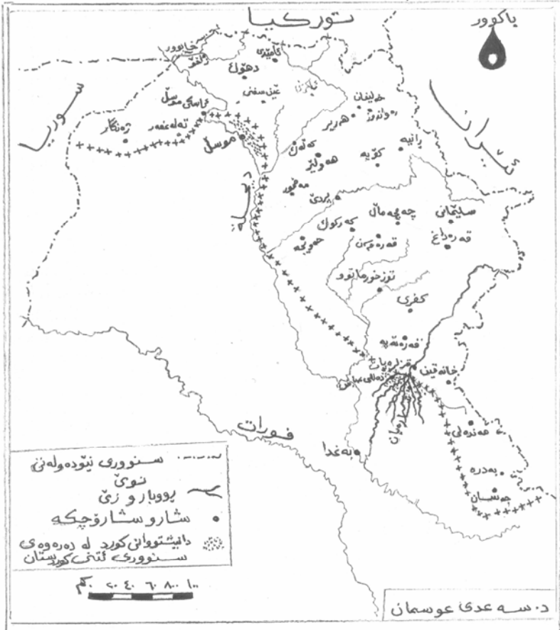
(سنووری خواری کوردستانی باشوور به پیتی توپزینه وه که)

نهم نهخشه یه له لایه ن توپزه ر کیشراوه به پشت به ستق به : مرکز دراسات علم الخرائط في كلية التربية جامعة الموصل، الاطلس المتوسط، ص ٦٨.