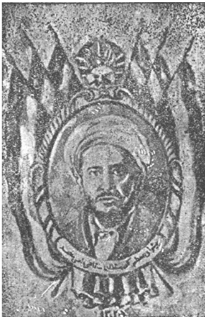
محمد ناسی رئیس جمهور ۱ کردستان