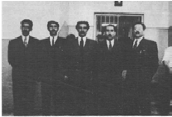
زنداد شماره ۲ قصر ۱۳۳۱

لهرانستهوه بق چهپ نیحسانئ، زهرهخت، نهرتهشیار، تیوانئ، نهرانشیان