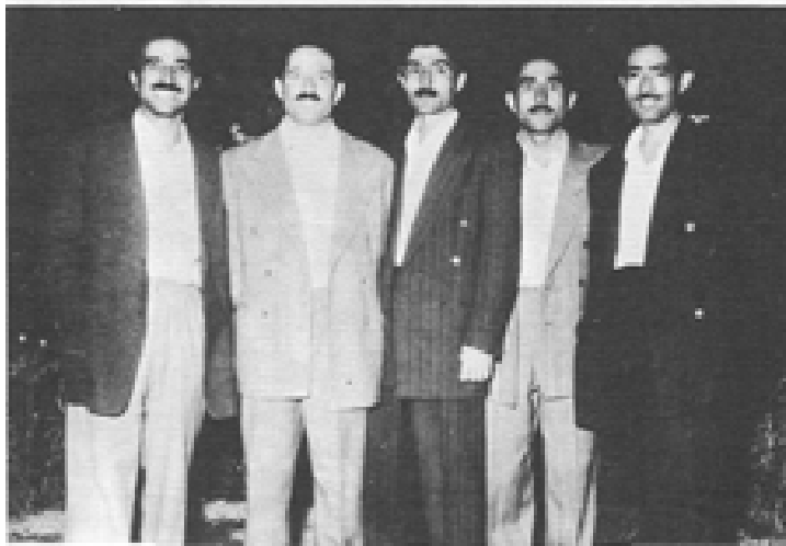
تهران، زنداد قصر ۱۳۳۰

لهرانستهوه بق چهپ نیحسانئ، زهرهخت، نهرتهشیار، تیوانئ، نهرانشیان