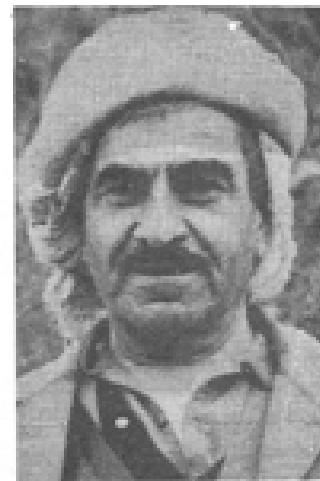
ملا مصطفی بارزانی