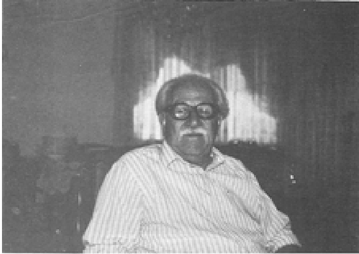
نیجستانی سالی 1377