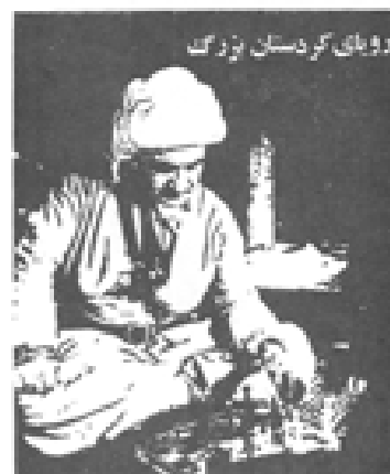
روای کرستان بزرگ