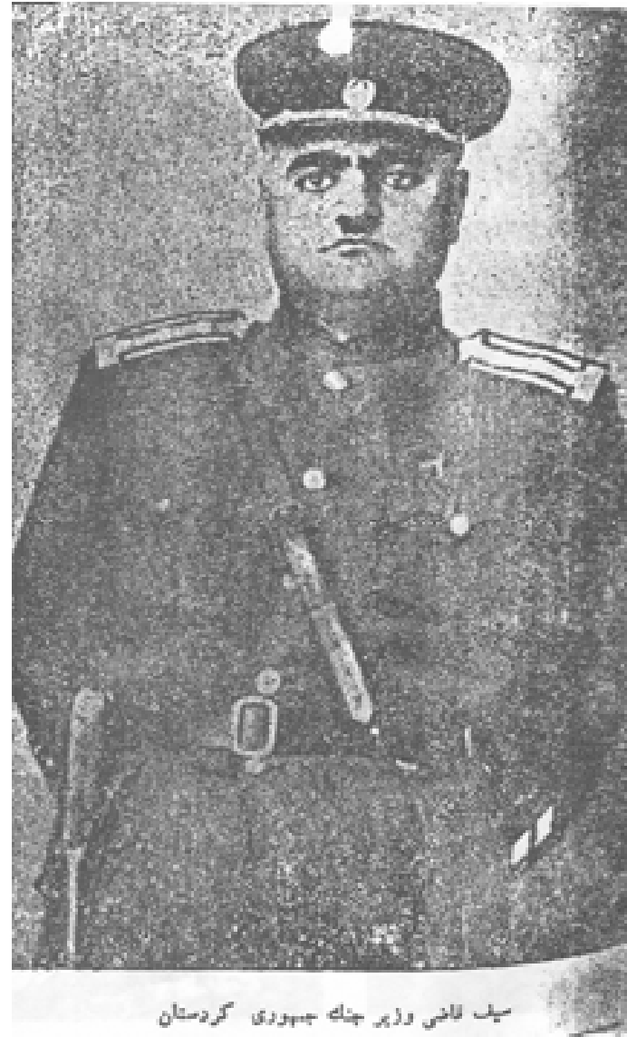
سیل لانی وزیر جنگ جمهوری کردستان

لهرانستهوه بق چهپ: نهرانشیان، زهرهخت، تیوانئ، نیحسانئ، نهرتهشیار