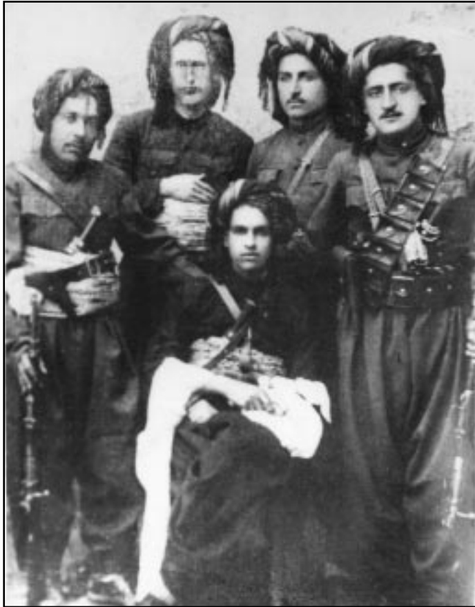
(*) له رۆژنامه ی ژماره ۱۱ «کوردستان» دا ناوی به شیک له دهسته ی هه وه ل و دووهه می قوتابییه کان هاتوه.