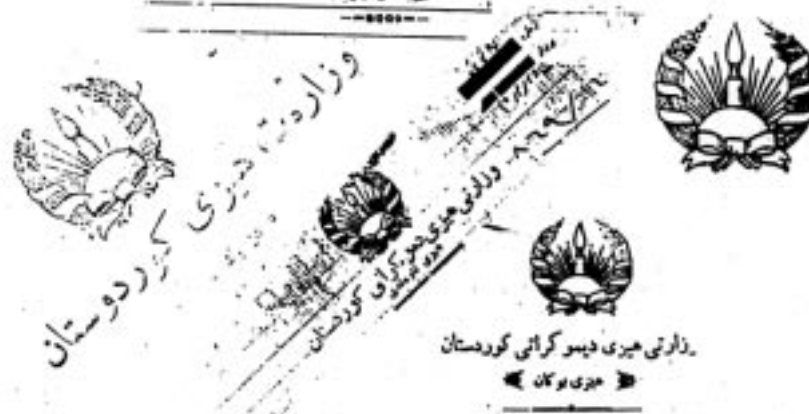
دستگوشى هيزى پيشمرگه حوزى نيموكراتى كوردستانى شىران له هاونى سالى ۱۳۵۹ تا هاونى سالى ۱۳۶۶

وزارتى هيزى دوروى كوردستان وزارتى هيزى دوروى كوردستان وزارتى هيزى دوروى كوردستان