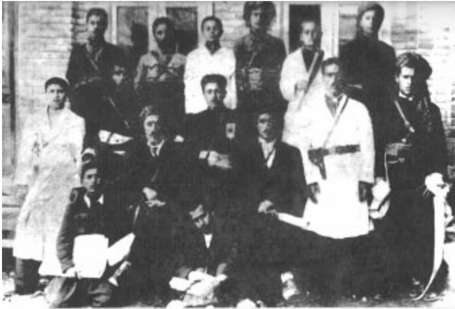
شاری مه‌هاباد، جه‌وشه‌ی چاپخانه‌ی کوردستان (*)