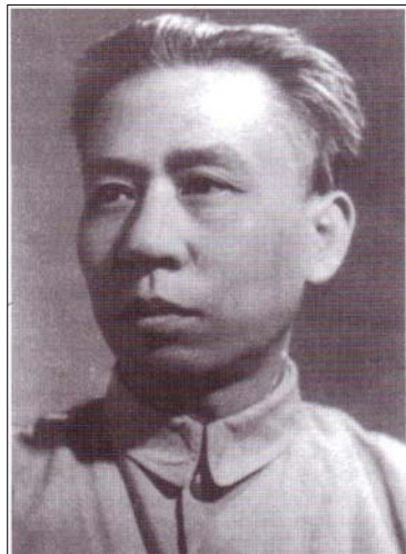
کاتيک که ماو تواني گومان له وهفاداري ليو شاوچي (له ويته که دا) دروست بکات، کانک شينگ ده ستي کرد به سوو کردن و پيتر خکردني نه و.

سه ره راي ته مانه ش، هه ر که سيک و هه ستي ده کرد که تووشی هه له گه لنيک بووه. روتشنيره کونه کان باوهر يان و ابوو که تووشی هه له گه لنيک بوون. ده بوو ديتبانان. هه موويان دانيان به هه له کانينان دادندا. ته نانه ت ليو شاوچي، دانپيدانانه که ي خوي نووس ي. به م پييه، کاتيک که خه لک بيتان ده لين، که نه وان قه ت باوهر يان به وه نه هيئاوه که هه له يان نه کردوه، نابي قسه که بيان قبوون بکهن.