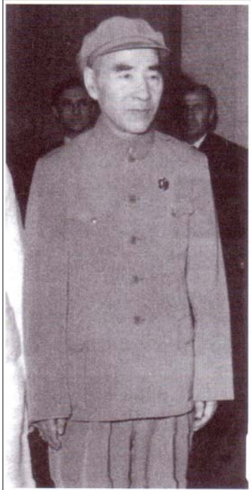
خەرىكە پىلانگىرپى بەدۇ دەكات، ترسەكە لى زۇرتىر بوو.

لە ياز دەمى ئەيىلى ۱۹۷۱ دا، لىن پىياۋ لەگەل لىن لىگۇتۇدا و ھاو كسارە پلەيە كە كانىدا، چاوپىكەوتنى كىرد تا ھەلپە رىستانە تىرىن و ئالۇز تىرىن ستراتىژى خۇيان داپرىژن. لىن پىياۋ ئەم پىلانە لى نائ بە ((پىلانە كىتۇ سەر لەفەلە كىدراۋى يەشى))، كە وا بىرىار بسو لەگەل دەستپىكىردنى پىكىدادان بەدرىژاى سىنورى چىن و سۇقىت لە ۲۵ لى لىل دا، وەرى كەرى. پىكىدادانە كە دواتر بەربلاۋ دەبوو و قەبرىانكى مىللىسى بەدىدە ھىنا و دەبوو ھۇى ھەلۋە شاندىنە ھى رىتورە سى يە كە مى تىشرىنى يە كە م، وەك نىشانە لى سالىژۇ دامەزاندنى كۆمارى گەلى چىن.