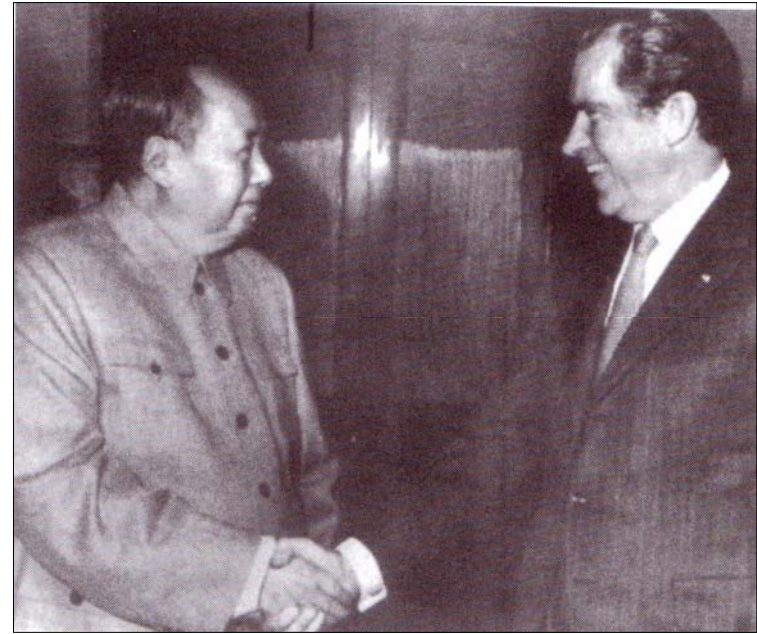
ماو و سەرۆك نىكسون لە رەوتى سەردانى دىپلۇماسى بىن وئىنەى نىكسون بۆ چىن لە ۱۹۷۲ دا، لەگەل يەكتەدا، دەست لى دەدەنەو.

ھەندىك لە كىشەكانى لىن پياڭ، لە ھەلۆئىستى ئەو لە پىئوھندى لەگەل كاروبارى سىياسەتى دەرەدەدا، سەرچاوەھيان دەگرت. لىن كە خاوەنى گەرموگورپىيەكى شۆرشگىپانەى راستگۆيانە بوو، لە دىرزەمانەو خاۋزىارى شەپى پارتىزانى بوو بە دژى رۆژئاۋى ئىمپىريالىستى، بەتايەتى ۋلاتى سەرەكى سەرمایەدارى، واتە ۋىلايەتە يەكگرتوۋەكانى ئەمريكا.