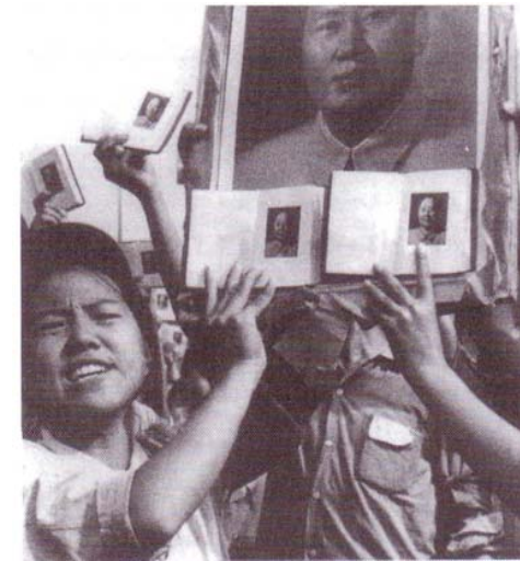
سەربازە گەنجە ماويستەكان لە سالى ۱۹۶۶ دا، ((كتىپى سوورى)) ماو نىشان دەدەن، كە ئايشىكە لە سەروشتى تارادەيەك شيوەپەرسىتى خۇشەويستى ماو لەنىو خەلكدا.

لە ۱۹۶۵ دا، شەرپىكى زۆر توند لەسەر دەسەلات لە چىندا دەستى پىكرد، كە نىكەي دەيەيەك درىژەي كىشا و لە ۱۹۶۶ دا رىبەرى چىن بەفەرەمى، ناو (شۆرشى كۆلتورى) لى نا. ماو ھەولیدا، لەرىگەي شۆرشى كۆلتورىيەو، خەلك، ۋەرزىر، كرىكار و بەتايبەت خوتىندكار و قوتايىيەكان، بەدژى دۆرمنەكانى لە حيزبى كۆمونيست و دەزگاي