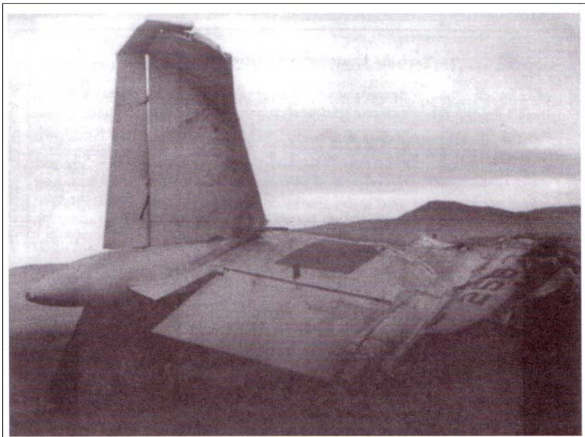
كاتىك كە بۆ لىن روون بووئە، ماو پېلانەكانى ئەوى بۆ كوشتنى خۆى ناشكرا كردوو، هەولیدا، بەفرۆكە لە چىن هەلبىت، بەلام فرۆكەكە لە مەغۆلستان كەوت و لىن و بنەمאלەكەى كوژران.

لەم كاتەدا، لىن تىگەيشتەبوو كە وەفاشكىتییەكەى ئىدى شاراوە نىيە. برىارىدا، لە كۆماری گەلى چىن هەلبىت و پەنا بباتە بەر يەكىتى سۆفیهت. ئەو شەوه لىن، هاوسەر و كۆرەكەى و ژەنەرالىتىكى وەفادارى هەواى و دوو هاوكار، سواری چەند سەيارەيەك بوون و بەمەبەستى فرۆكەخانەى شان هاى گوان، بەرپىكەوتن. سەربازەكانى ماو راست لەپشت سەريانەوه بوون. ئەوان بەرەو (لىمۆزىن) ى دژە گولەى مۆدىلى (نالای سوور) ى لىن، تەقەيان كرد، بەلام نەياتوانى هىچى لى بگەن. سكرتيرەكەى لىن پياؤ (هەندىك دەلێن پاسەوانە تايەتییەكەى)، لى و بىن پۆ، دەيهەويست كە پىش بە هەولتى لىن پياؤ، بۆ هەلاتن، بگرىت. لىن پىساوى لەسەيارەكە فرەيدايە خواری و لە حالپىكدا كە لەسەر زەوى كەوتبوو فېشەكپىكى لە باسكى راستى دا.