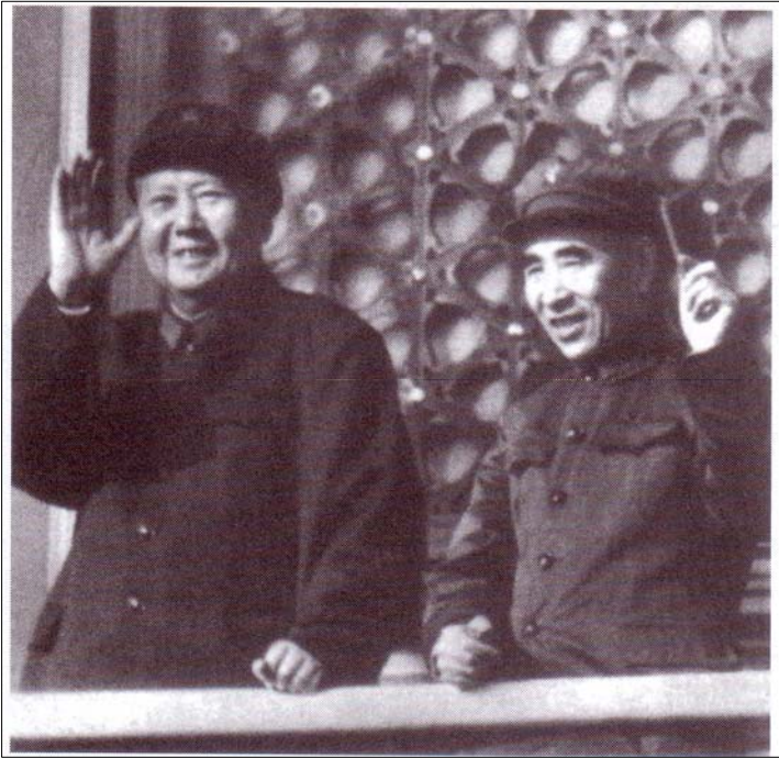
ماو و لین پیاو له بهرامبهر جه ماورد، له حالیکدا که لین کتیبی سووری ماوی به دستهوه گرتوه. پیلانی نه زانانی لین پیاو بۆ له ناوردنی ماو، بوو به کاره ساتیک بۆ خۆی.

به شیوهیه کی ناسایی، ئەم رووداوه دەبوو بابه تیککی زۆر ئەرینی بییت، به لām لین که چەل بوو و له پێوهندی له گەل که چه لیبیه کهشی دا، زۆر ههستیار بوو، هه میسه کلاوی له سههر دهنه تا که چه لیبیه کهی داپۆشیت، ئەم وینهیه بۆ یه که مین جار، به بی کلاو و که چه ل نیشانی ددها. لین تهریق بوو بیتهوه یا نا، به لām ههروا له پلهی دووه می حیزیدا، راست له دواي ماو، مایه وه. به لām دوژمنه کانی زیاد له هه رکاتیککی تر دهوریان گرتبوو. کانگ شیتنگ، که زۆری نه مابوو له بهر شیریه نجه ده مرد، بوو به جیگری چین پودا و پلهی چواره می له حیزیدا گرت به دهسته وه و له پۆستی وه زاره تی راگه یاندنی چین دا، رۆلی ده گپرا. ئەو به لیها توتویبیه وه، به دژی لین پیاو کاری ده کرد.