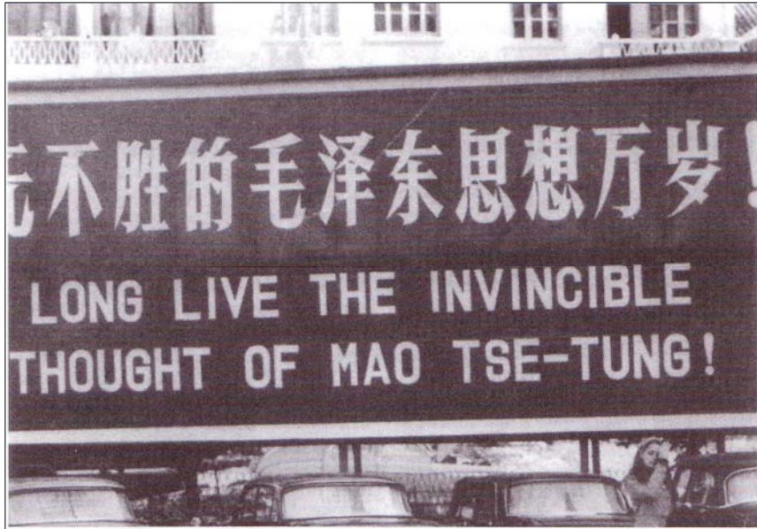
پؤسته رگه لیک مهزنی وهک ته مه (له گه ل دروشی بژی ته نندیشی تۆکه می ماویسته تۆنگ) به سهرنج دان به نه بوونی نازادی ده برین، یه کیک لهو ریگایانه بوو، که چینیه کان ده یان توانی بوونی خؤیان ده برین. وهها پؤسته ریک له شه یی دهسه لات له نیوان ماو و لیؤدا، به جؤریکی باش خؤیان ده نواند.

له زانکؤ کانی چین دا، یه کیک له ریگا کانی خؤده رخت و بوونی ناشکرای خویندکاره کان و ماؤستاکان، ناماده کردن و نواندنی پؤسته رگه لیک بوون، به چهن دین نیشانه ی گهره وه. تهو پؤسته رانه دروشه گه لیک شؤر شگپیری - وهک (( بژی سه رؤک ماو )) یا (( مردن بؤ ئیمپریالیسته کان )) - یان، به نیشانه گه لیک مهزنه وه راده گه یاندن (زمانی چینی پیی نییه، به لکو له باتی تهوه هه زاران نیشانه ی هه یه) و له شه قام و بیبا گشتییه کاند، ده خرانه پییش چاوی خه لک.