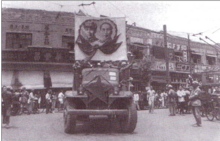
لە كۆتايى شەرى ناوخۆى توند لە چىن دا، دانىشتوانى شانگھاي بەھلگرتنى پۆستەرىكى ماو لە شەقامەكاندا، بۆ سەركەوتنى كۆمۇنىستەكان ناھەنگ دەگىرن

لە ۱۹۱۱ دا، حكومەتى گەندەل و كۆن و ناشايستەى پاشايەتى ھەرەسى ھىنا. چىنيەكان نامانجەكانى سۆسيالىزم و كۆمۇنىزمىيان وەك رىگايەك بۆ بەدەستەيتانەوہى كۆنترۆلى ولاتەكەيان و بەرەو باشتەردنى ژيانى خەلكى ناسايى چىن، چاولى دەكرد. كۆمۇنىزم بەلئىنى دەدا، كە زەوى بداتە جووتيارەكان بۆ كشتوكال و بۆ كرىكارەكانىش ھەلومەرچىكى باشت بەدى بىنى، كە لە كارگە چكۆلە، بەلام لە ھالى پەرەسەندەكان دا كارىيان دەكرد. لە ۱۹۲۱ ھە، ھىزى كۆمۇنىستى چىن بە رىبەرى ماو بەلئىنى دەدا، كە جولانى رووہ نەمانى چىن راوہستىنى، ولات لەژىر دەستى بىگانەكان نازاد بكا و حكومەتى گەندەلەش لەنىو ببات. شەرىكى ناوخۆى توند لەنىوان كۆمۇنىستەكان و نەتەوہخوازەكانى چىندا، لەسەر دەسلەلت سەرى ھەلدا. ئەم شەرە لەسالى ۱۹۴۹ دا كۆتايى پىھات و ماو ھاوپرىكانى لەھىزى كۆمۇنىستدا، زالبوون بەسەر تەواوى خاكى سەرەكىى چىن دا زالبوون. بۆ ماوہيەك زۆرىك لە چىنيەكان وايان ھەست دەكرد، كە كۆمۇنىستەكان سەردەكەون كە دەولەتتىكى سەربەخۆ، جىگىر و خۆشگوزەرانتە بەدى بىنن.