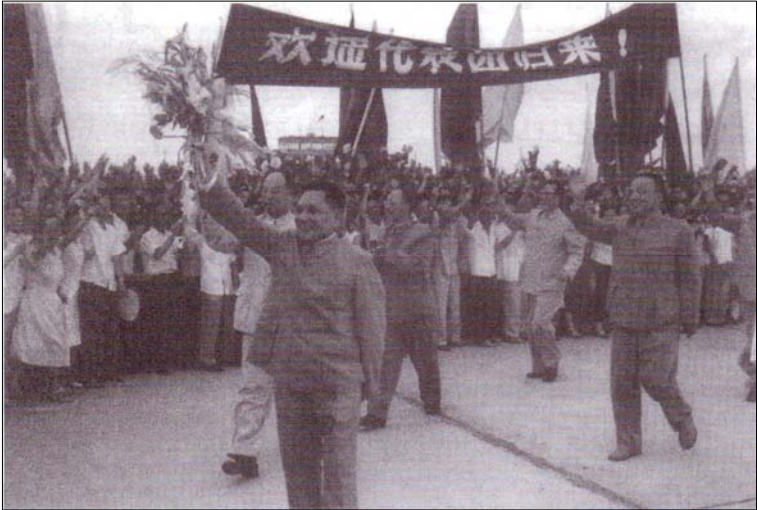
دىنگ شىاۋ پىنگ لە نىۋان نوپنەرەكانى ھىزبى كۆمۇنىستى چىن دا، دەۋات. ماو، (دىنگ)ى، بە بەرەستىكى مەزن لەسەر رىنگاي خۇي بۇ گەيشەن بە دەسلەتتى تەواو، دادەنا.

ئەۋەي كە بەراستى كىشەي لەسەر بوو، دەسلەتتى سىياسى بوو. بەلام پىشتىوانە كانى ماو، تامانجە راستەقىنە كەيان دەشاردەو. ئەوان بانگەشەيان دەكرد، كە لىۋ خەرىكە ھەول دەدات