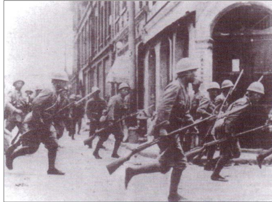
سەربازە ژاپۆنییهکان لە ۱۹۳۷ دا، شانگهای داگیر دەکەن. ماو لە هاوکاری کردن بۆ دەرکردنی ژاپۆنییهکان لە خاکی چین، رۆژنیکي سەرەکی هەبوو.

حکومەتی ماو لە سێدارەدانی نزیکە یەک ملیۆن دژە شۆرشێ لە تشرینی یەکەمی ۱۹۴۹ هە، تا تشرینی یەکەمی ۱۹۵۰، پەسەند کرد. سەرچاوە بیانییهکان وایان مەزەندە دەکرد، کە کۆی کۆژراوەکان تا کۆتایی ۱۹۵۲، نزیک بە دوو ملیۆن کەس بوون.