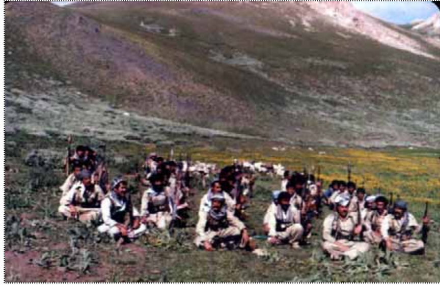
دۆڭۆ، سالى 67، لكى دوو، پيش عەمەلىياتى گرتنى پاىه گاي "شېروانى"