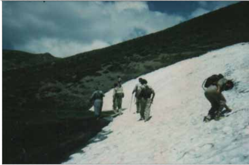
جۆزہردانی 69، دالانپہر، شیمال، حہرہ کہ تی پیشمہرگہ