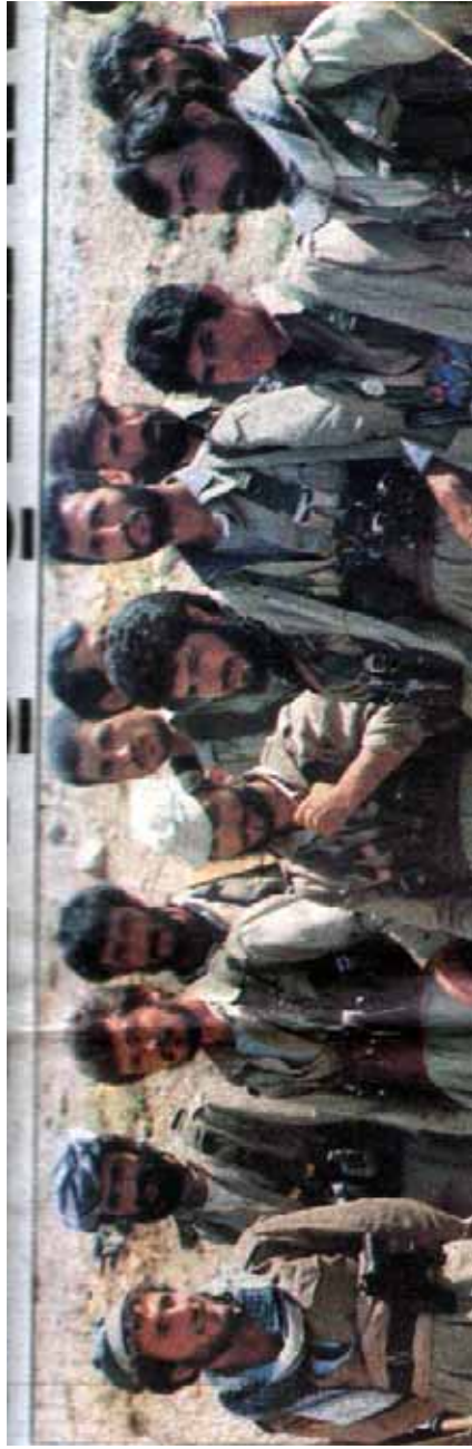
بەشىك لە پىشمەرگەكانى ئارووندى شىمال - بە كامپىراى وڤىنگى رۇژنامەى "حورىيەت"