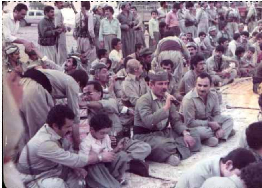
دەفتەری سیاسی - گەوره دئ، جەژنی چلەمین سالی دامەزرانی حیزب