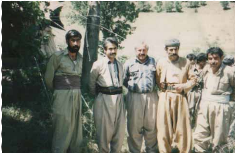
سالی 69، لہ راستہ وہ: سالہ ح رہبہ تی، سہید برایم ہاشمی، تہ پوور، مستہ فا ہیجری و سلیمان کہ لہ شی