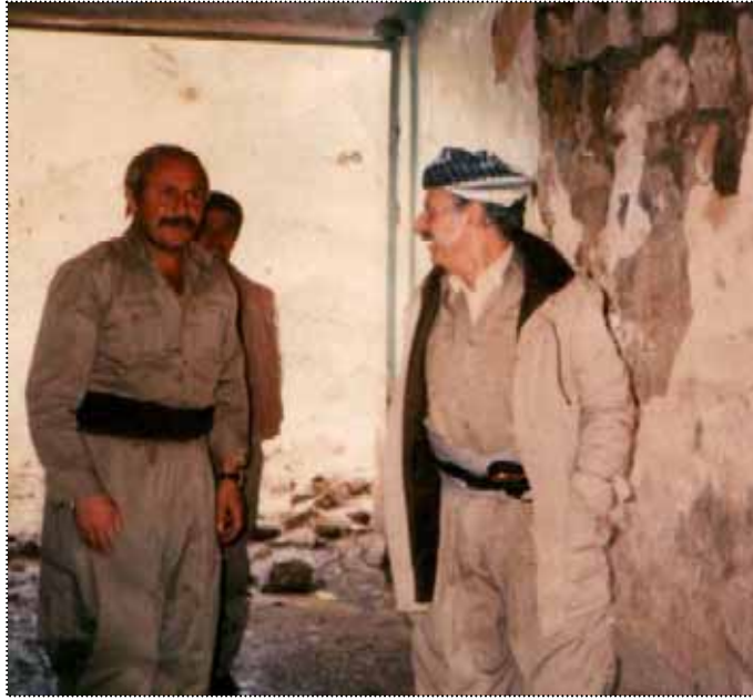
11- مەڭبەندى شىمال، 67