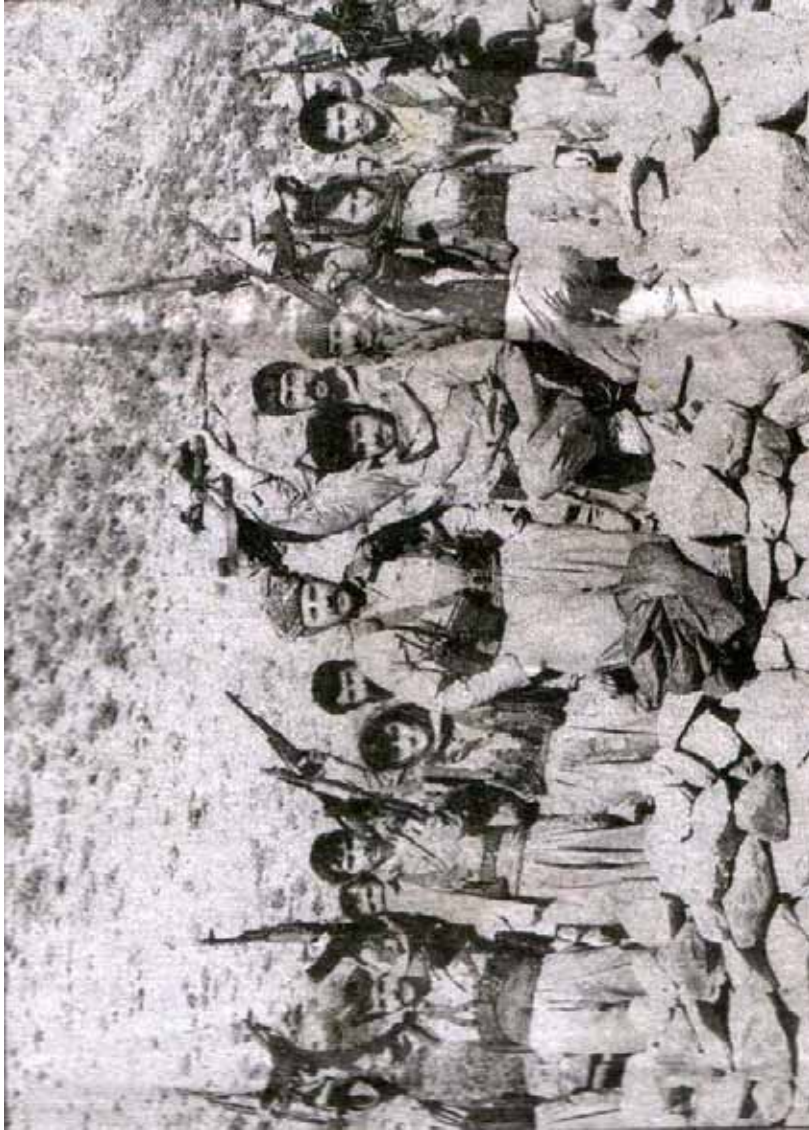
بەشېك لە پېشمەرگەكانى ناوهندى شىمال