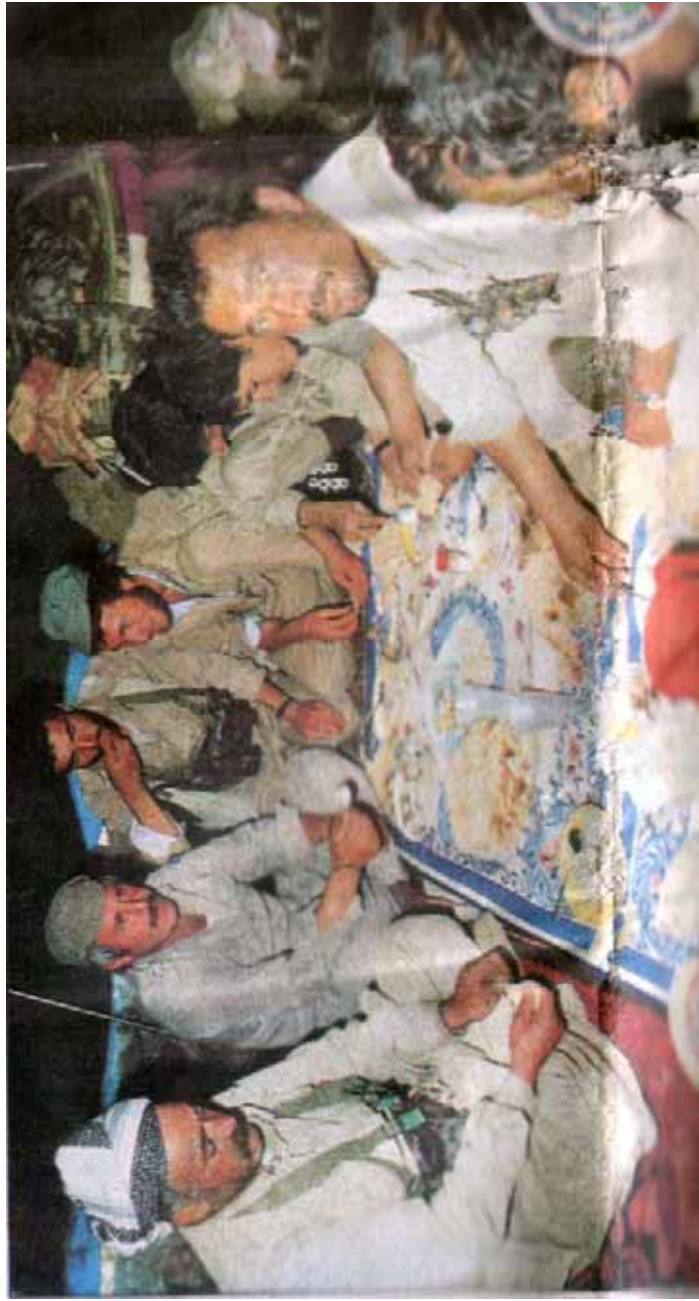
هەوالئیزی رۆژنامەى "خوردیەت" لەگەڵ نووسەر و چەند پێشمەرگە بەک لە کاتی نان خواردندا