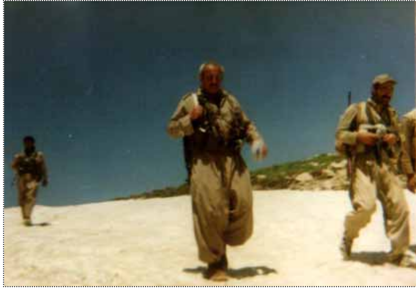
سالی 1369، دالانپەر، شیمال. شهید به هرام نازادفەر، تەیموور