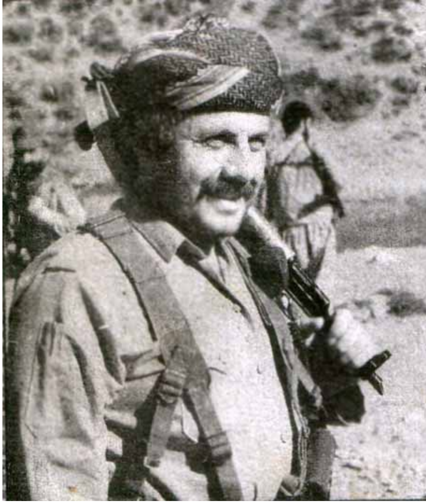
نوسەر بە کامیڤرای ھەوالئیری رۆژنامەى "ھورییەت"