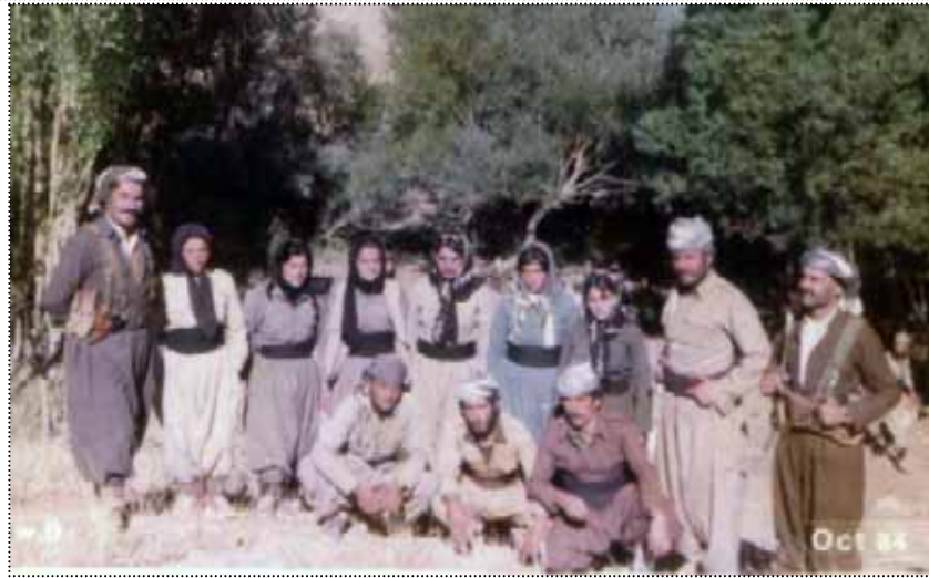
بەهاربەندی دیواندەرە، سالی 1363. سێ بووک و سێ زاوا لە گەڵ چەند پێشمەرگە ی دیکە