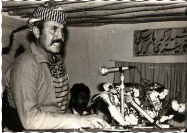
كانىمىتو، سالۋنى كۆنگرەي 7، سالى 64