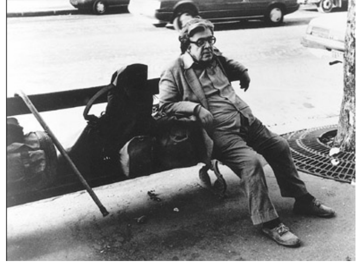
نیریش فرید له پاریس، له ههشتاگانی سهدهی بیستدا...