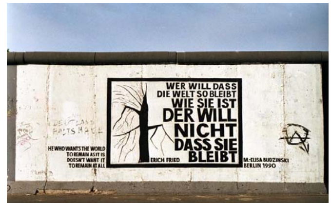
125. Juli 1991

شعریکی ئیریش فرید له سه‌ر دیواری به‌رلین...