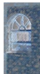
ئهحمه دی مهلا

(ئارف ده که ویتته شاری ژنیف به گه ره کی کارووژدا تیده په ری. له م دواسالانه نام نابوو رووباری سیست. مه به ست رووباره کهی