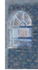
ئه حمه دی مه لا

له مه نفا نیشتمانه که م دۆزییه وه تا ده هات وه ک چناریکی به رز هه موو سه رله به یانییه ک له پیش ماله که مدا ده روا، ته می گه ره کی ئاکاسیا (۸) ، شه خته ی لی ره واره کانی ژوورا (۹) ، دو که لی جاده ی تراموه یه که ده یانناسییه وه. بینیم وه کو بیوه ژنه