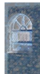
ئهحمه دی مهلا

فیکره یه کی سه ره تاییه، به لام شیعریه له مانا تاییه تییه کانیدا. سنوور له نیوان مادده و غهیره ماده نامینیت. به رجسته کان ده چنه قه پیلغی یه کتریه وهو دونیا له گۆرانکاریه هه میشه ییه کانیدا، له جه ژنه کانی خونویکردنه وه دان. هه موو شتیک مافی ره وای خوی ده سته که ویت له بریاردانی خو نویکردنه وهو خو بووژاندنه وهو خو ده رخستن. شتی وه ستاو جیگیر نامینن، پیناسه کان