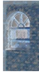
خەونە کانی زولە یخا

غوسلی ھەرزە کاریم بە تەپوئۆزی کووچە کانی شیخ عومەر و چلپاوە کانی گەراجی نەھزە شاھرزای پیللۆھ کچانە کەم بوون. لە مەرقدی غەوسی گەیلانی دەرویشە شیتە کانی ھیندوستانم بینی دوای نوێژی ھەینی شینی ئاسمانیان لە دەور غەزەب کۆدە کردووە. لە باخچە کانی زەورا خۆم بەقەد ئەستێرە کە ھەلۆاسی و بەشیک بووم لە باخچە ھەلۆاسراوە کان. ھەلیانواسیم بەقەد ئازاری