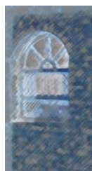
خهونه کانی زوله یخا