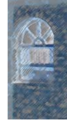
ئه حمه دی مه لا

ژن وه ک په نجه ره رووخوش وه ک هه ژار ماندوو وه ک سیاست دلدار وه ک دیکتاتور غه مبار وه ک کورد بیعار وه ک عاره ب شکودار وه ک فهره نسی جووتیار وه ک ئیسپانی قوشمه چی وه ک ئیتالی تاریک وه ک سوپسری