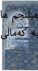
خهونه کاتی زوله یخا

هیلنجم هات کاتی بینم ئازادی له سه ر کورسی به که مالی ئیسراحت، خوئی به فه قیانه