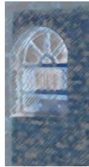
خهونه کانی زوله یخا

جرووکم هر هندی بوو. پیاچ رهش دهچووهوه بیزاریی، سپی دهچووهوه هزو غه مگین دیار بوو بهار. تا توانیم قورم له بهار گرت. مستی قوره رشی جهه نهم هردوو پیلاوه سه ربازییه که میان قووت دا، ماریک به ته نیشتمه وه زمانیکی له رانم دهسووی، زمانه که ی دی پیلووی دهلیسیمه وه.