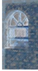
خهونه کانی زوله یخا

ژن وه ک په نجه ره رووخوش وه ک هه ژار ماندوو وه ک سیاست دلدار وه ک دیکتاتور غه مبار وه ک کورد بیعار وه ک عاره ب شکودار وه ک فهره نسی جووتیار وه ک ئیسپانی قوشمه چی وه ک ئیتالی تاریک وه ک سوپسری