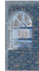
ئه حمه دی مه لا

بایه ک بوو هه موومانی وه ک یه ک ده چه مانده وه، وه ک یه ک ده بوایه هه نییه له خاکیکی زر ختم کهین، وه ک یه ک سهیری یه ک ئاراسته، وه ک یه ک چه ک له شان و شهر له گه ل عه ده مدا بکهین، وه ک یه ک له چکی شهیتان بیوشین، وه ک یه ک سهیری یه ک خال کهین که ئه ندیشه مانی تیا چه پسه.