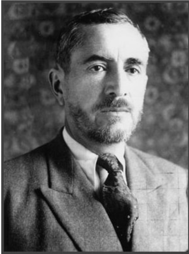
سەرۆك كۆمارى كوردستان پيشه‌واى نەمر قازى محەمەد