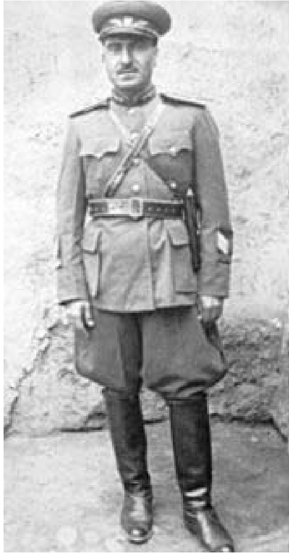
ژينيرال بارزاني نيمر