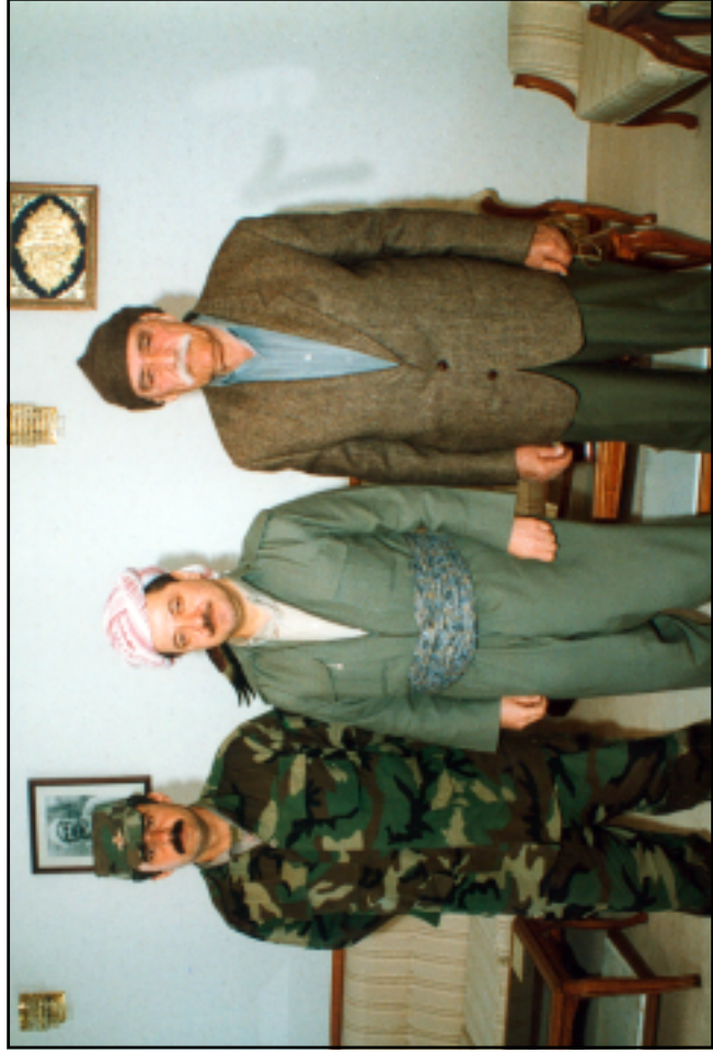
له چار پيښور ټيټيکي سهرورک مهسعود بارزانيديدا لاي چپ: خه پرو لالا رهسورل لاي راست: هيني