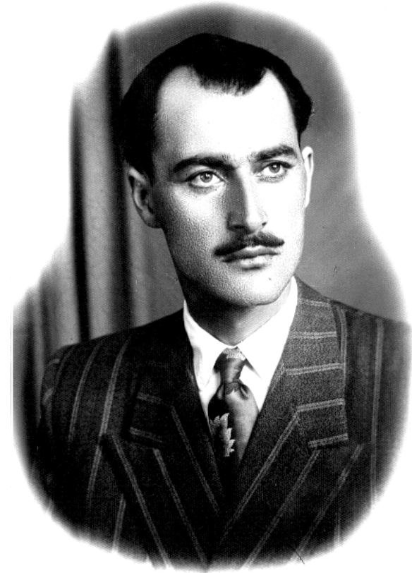
هتدی سالی ۱۹۵۳: ته وریز - ئیران