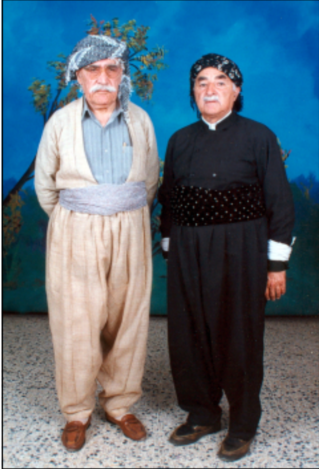
لای راست: همه‌دئه‌میناغای ره‌سولئی قوزغان لای چپ: هیدای. سالی ۲۰۰۰ میلادی له هه‌ولیر