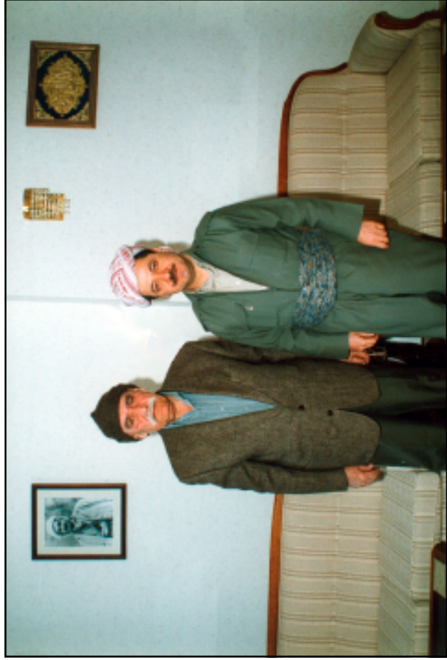
هيني له خزمهت سهرورک مهسعود بارزانيديدا له سهری رهش