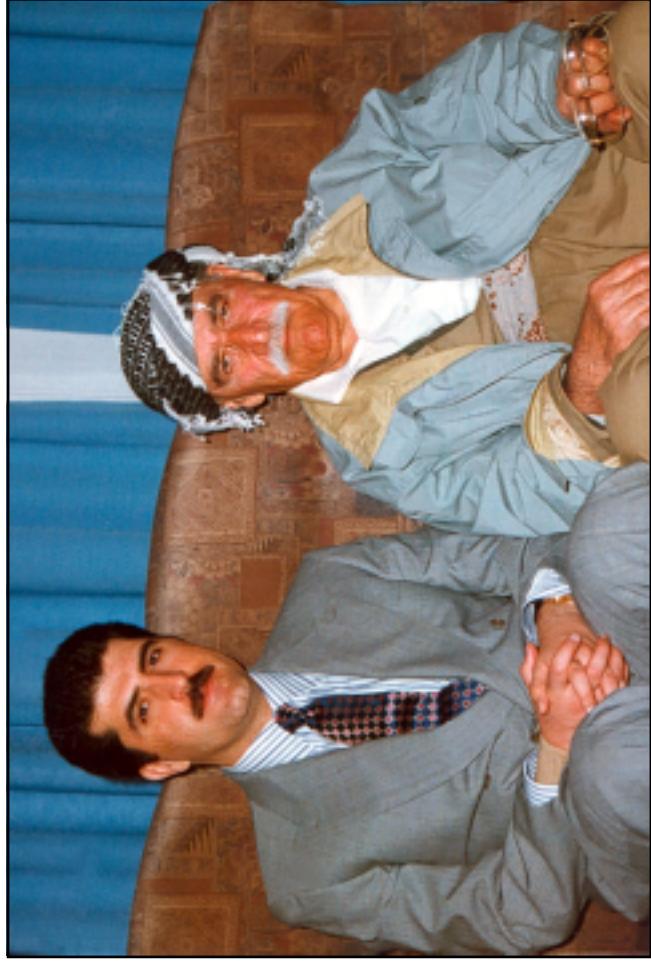
نووسہر لہ خرمہت نیچیرقان بارزانیدا