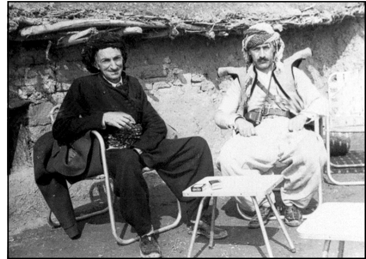
هیدی له خزمهت شیخ عوبه یدوللای نهخش بهندی دا له گوندی زینوی

منبش هەر حیسابی په کتیک له وانم بو دهکرا به لām له ماوهی کاری ئه و چند ساله دا له گهل شوړش جه ماعه تیش دهرفه تی هه لسه نگانندیان پین درابوو، ئه و جار ئیتر به پین ئه مری بارزانی و، ته نانهت به پین ئاگاداریی خوځ له شوپنیکه وه بو شوپنیکه تر ئیشی منیان دهگوری چونی به باشیان زانیبا.