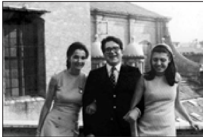
رۆمانو و لهگهڵ دوو خوشکی خۆی