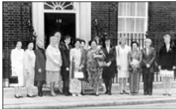
فلاڤيا له گهڙ ھاوسه ره کاني سه راني به که تپي ئه وروپادا