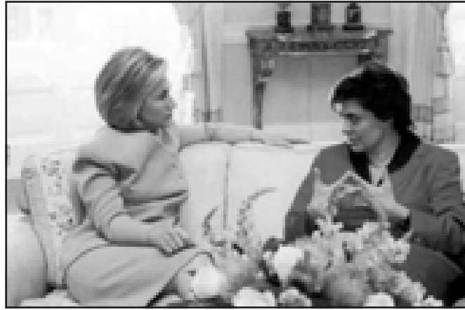
فلاڤيا له گه ل هيلارى كلينتون