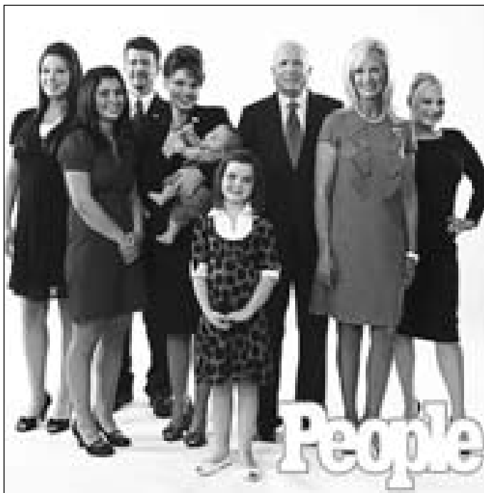
بنه‌ماله‌ی ماکین و سارا و خیزانه‌که‌پان