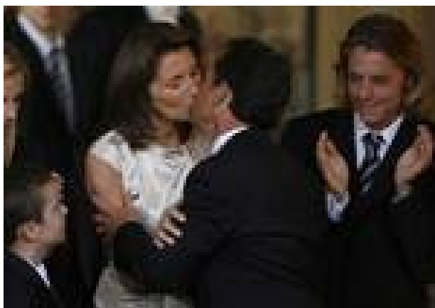
ساركوزى و سيسيلىا