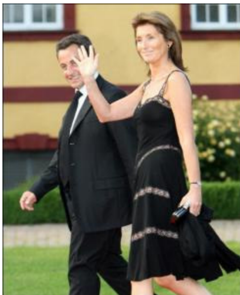
سارکوزى و سىسىليياى ژنى