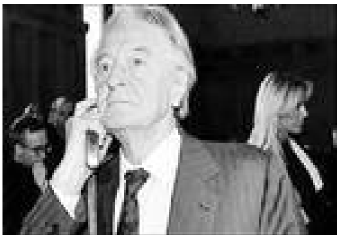
رۆلان دوما وەزىرى پىئشو