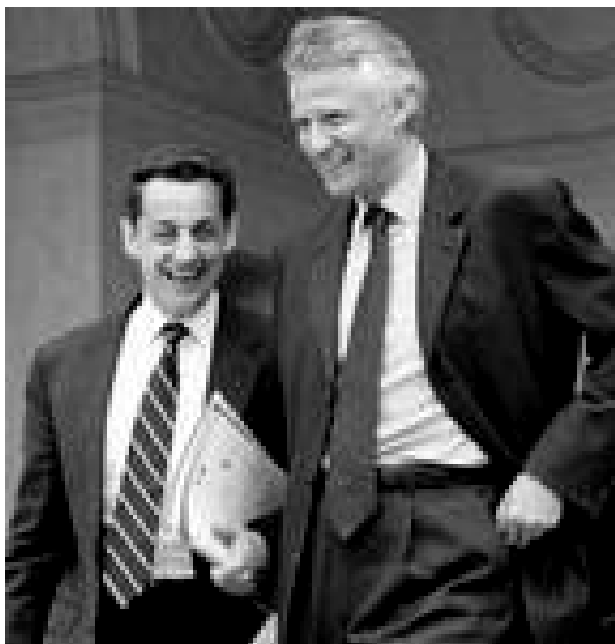
فيلبان و ساركوزى دوو كهسى ناكوك و ناحهز