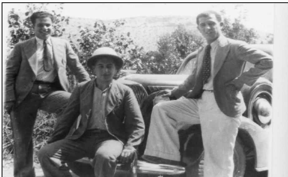
پښه مزى له گهڼ کورپانى پورى، موخته سه م و محه مه د فه تاح چه له بى