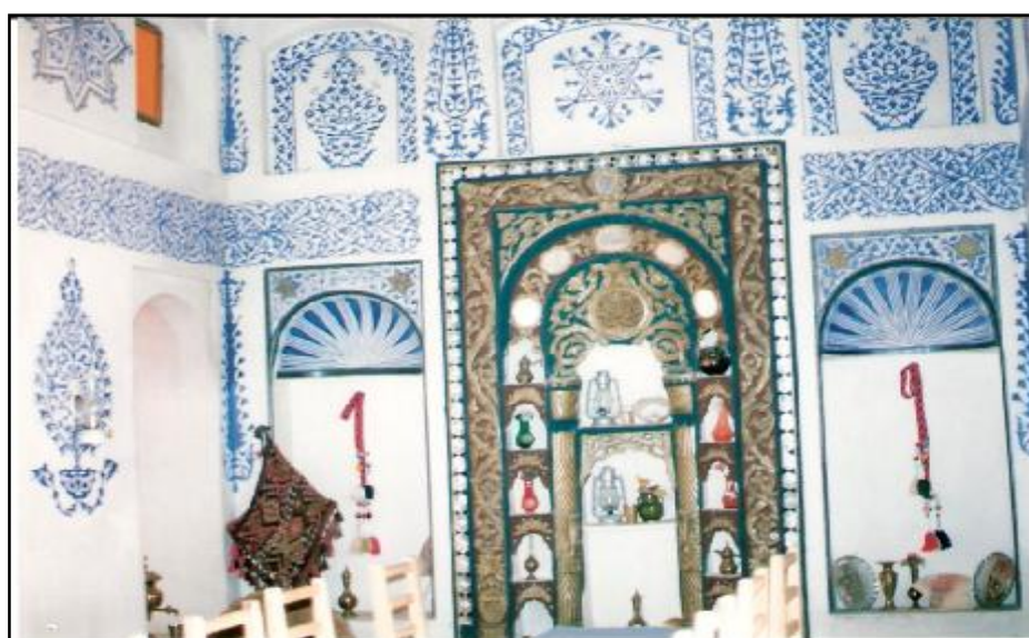
دیوه‌خانی حاجی ره‌شید ناغا له قه‌لانی هه‌ولیر