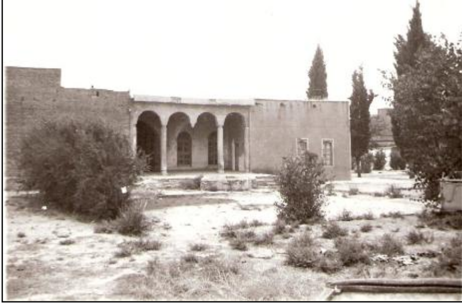
قهسرى عهتاللا ناغا كه مالى باوكى ردهمى بوو