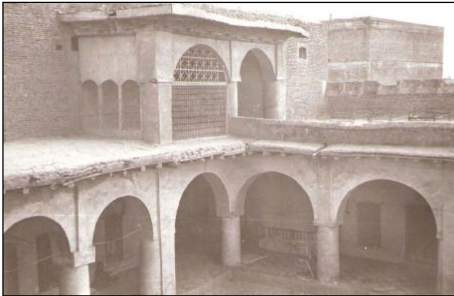
وینہی قہسری عہتاو للاً تاغا کہ مالی باوکی پرمزی بوو