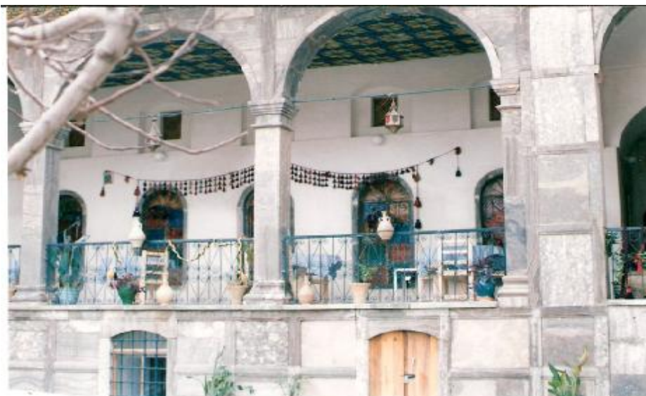
دیوه‌خانی حاجی ره‌شید ئاغا له قه‌لاتی هه‌ولێر