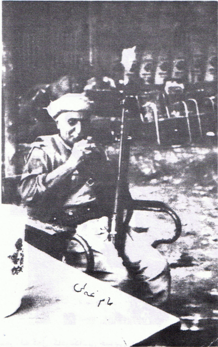
مام علی رحمہتی کہ : " ۱۲ ایمامی وہ لانا بوو، ببوو بہ کورد "