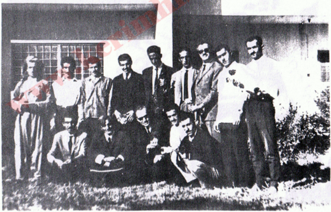
اموستا هيمن و نووسر له گهل كادره كاني حيزبي ديموكرات له كلالي كادر دا