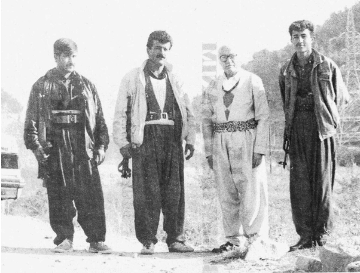
له گه ل بر ايانی پيشمه رگه له ريگای شه قلاوه