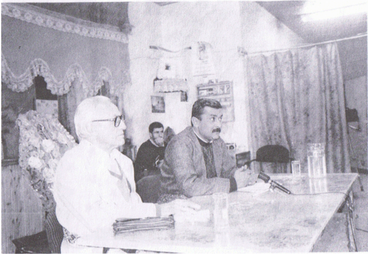
له هه ولتیر له کۆرتیکدا له گه‌ڵ چهند نه‌دی‌ب ورۆشه‌نبیری کورد