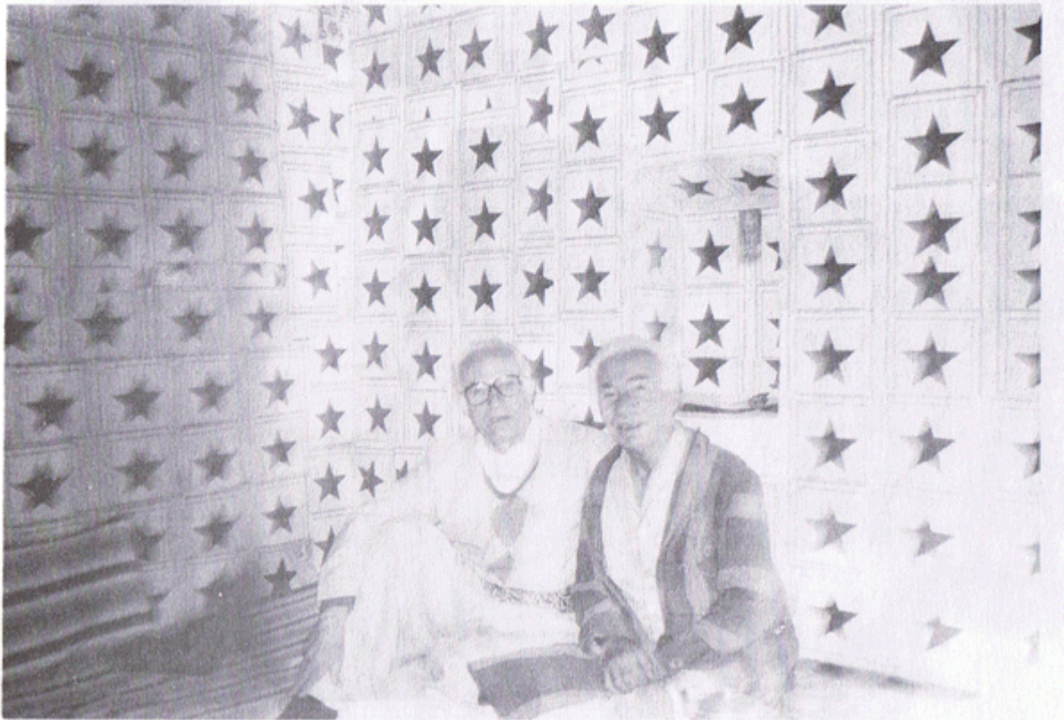
له شه قلاوه له خزمهت ماموستا سه عید ناکام دا