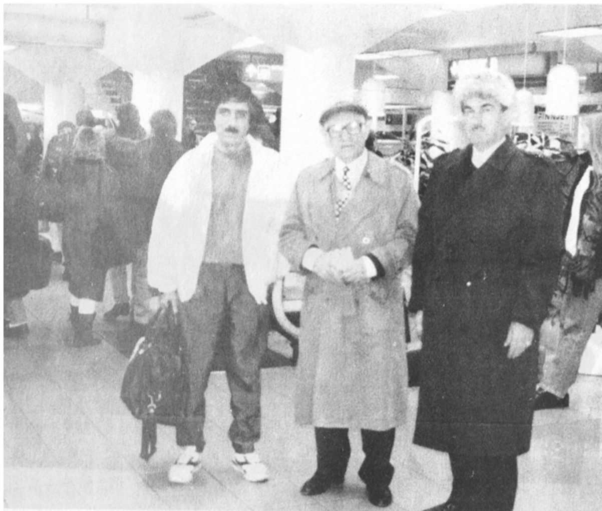
له فینلاند له گه ل ما موستا مه لامحه مده دی شه لماشو و حوسینی ره بهر