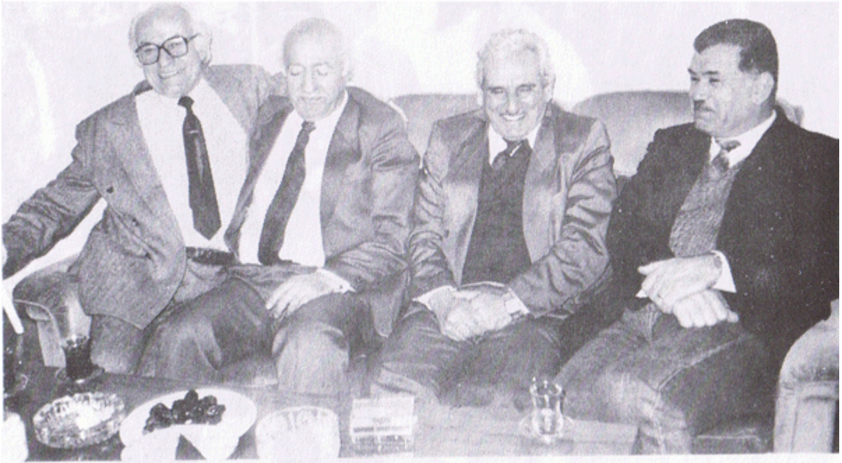
له ستۆکهۆلم له مالی خۆمان