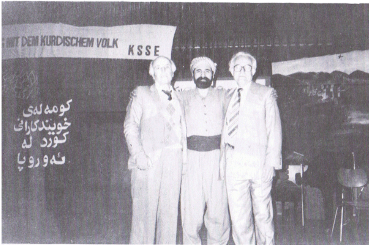
له گه ل غه نی بلوریان و شوان په روه ر