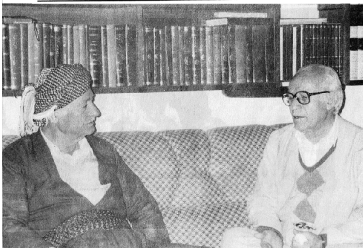
له گدل کاک عه زیز محه ممد له هه ولیر