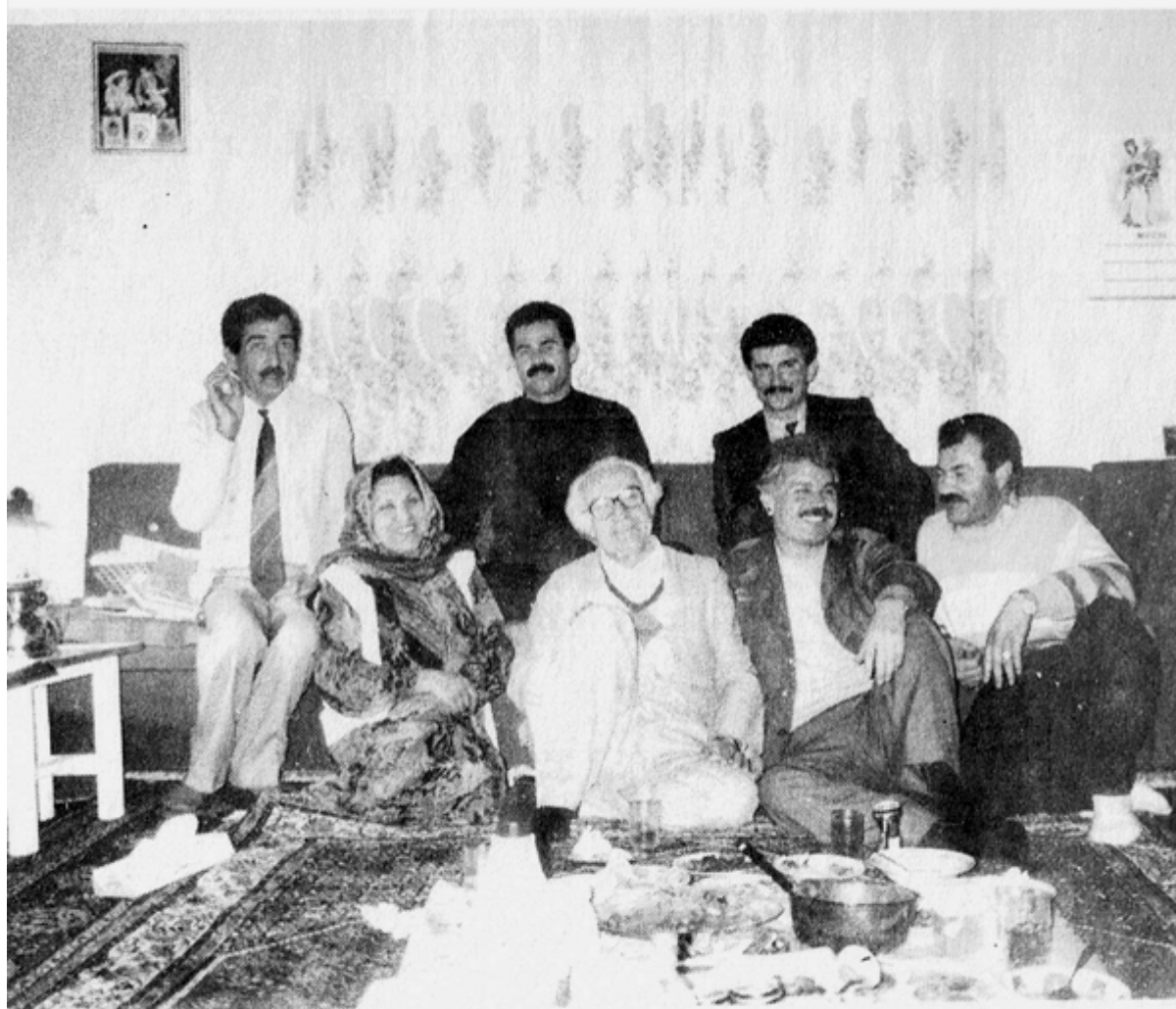
له هه ولیر له مالی کاک مومتاز چه یدهری