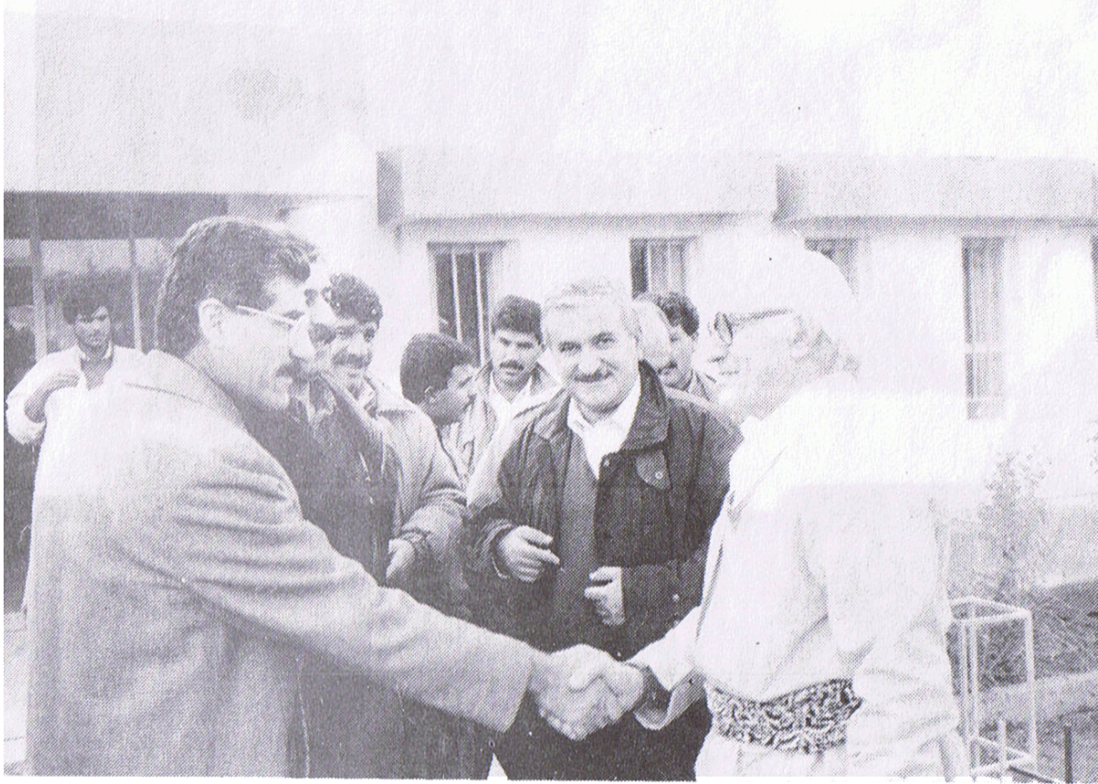
له باره گای به کیتی نیشتمانی کوردستان له سوله میانی