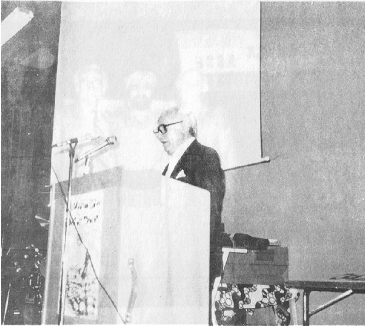
له تہ لمان له سیمینار کدا