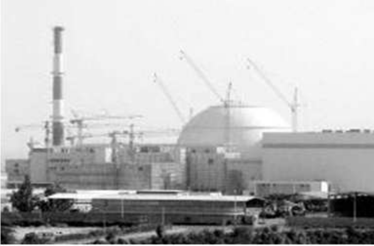
پروژەى ئەتومى خەونى ئىرانىەکان لە بۆشهر

ئەو كتيبه به ههشت بهش له رۆژنامهى (ئەلقبس)ى كويتى له كانوونى يەكەمى 2006 بۆلاو كراوه تەوه.