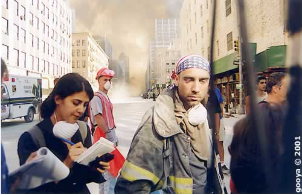
رۆژنامه نووس (كاميليا) له ئەنتەرنێتەوه.