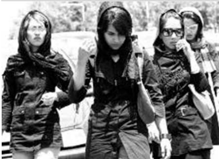
دهسته کیژیکی ئیرانی به رووبۆشی رووکراوه.