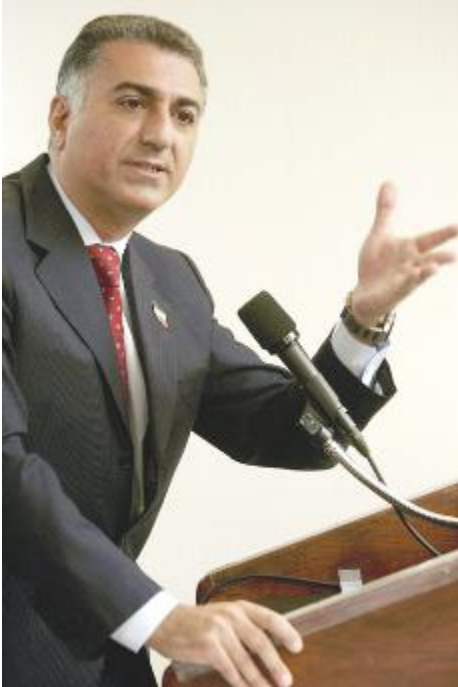
کورې شاهه نښاه