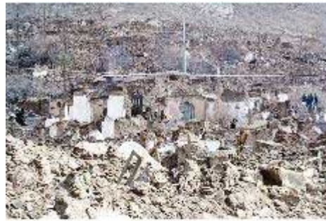
كه لاهه كاني شاري بلم

ٲه گهر گريٲه ك به به نجه بكرٲته وه دداني ناوٲت.