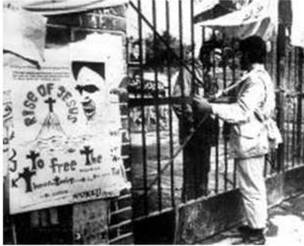
ویندهی گیرانی سه‌فاردهتی شه‌مریکی له تاران.