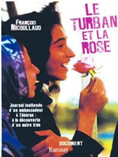
وینہی بہرگی کتیبه کہ بہ زمانی فہرہنسی