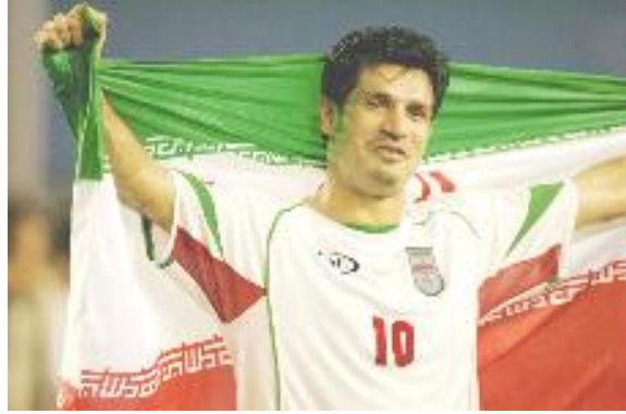
ویتهی وهرزشوان عهلی دائی