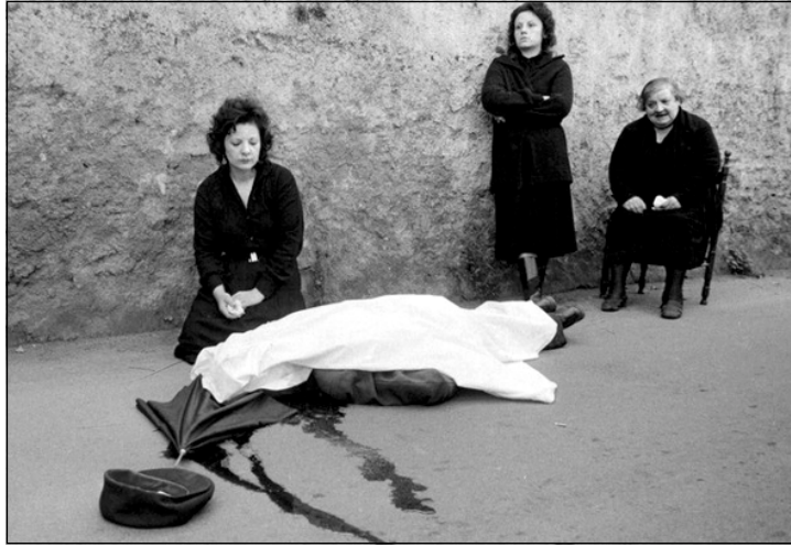
کوشتنی که سیتی بازرگان له رووسیا له لایه‌ن چه‌ند مافیایه‌که‌وه