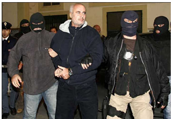
دهسنگيرکردنی که سڼکی ديکه له گه وره مافياکانی ئيتاليا