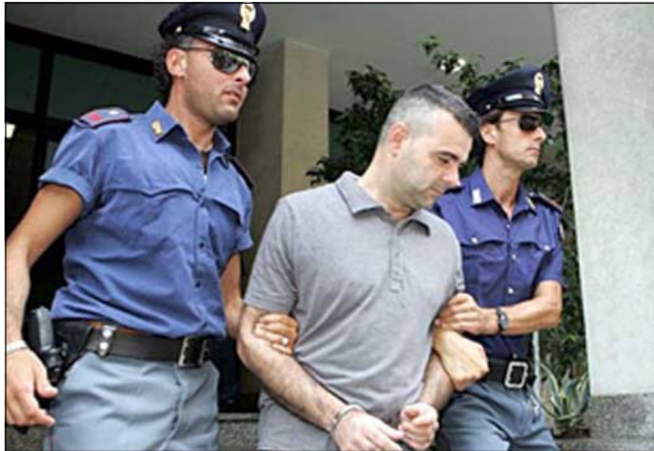
دهستگیرکردنی مافیایه کی ئیتالی