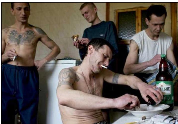
گرووپیکی مافیا له پاش نه‌نجامدانی کاریکی دزی