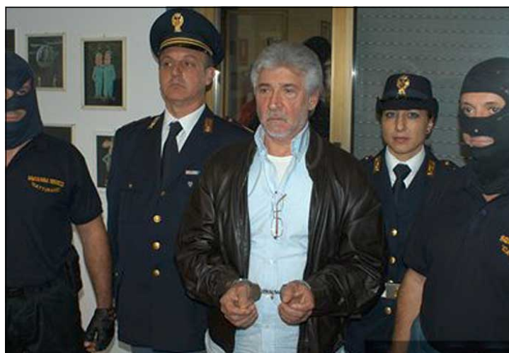
دهسنگيرکردنی په کيک له گه وره مافياکانی ئيتاليا