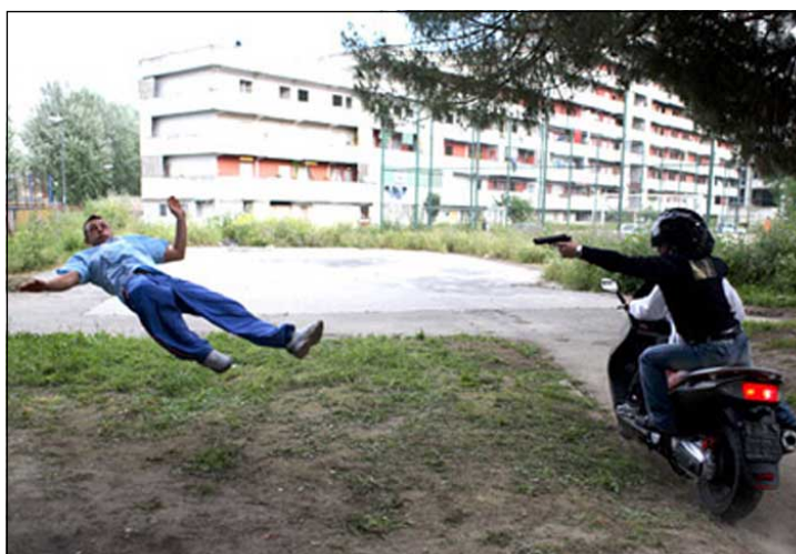
نه‌نجامدانی کاری کوشتن له لایه‌ن مافیاکانه‌وه