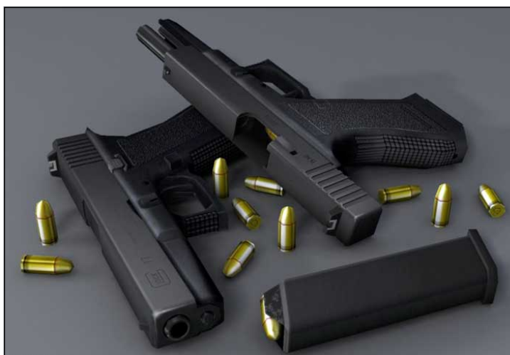
چند پارچه چکیتک که مافیاکان به‌کاربان دهه‌ین