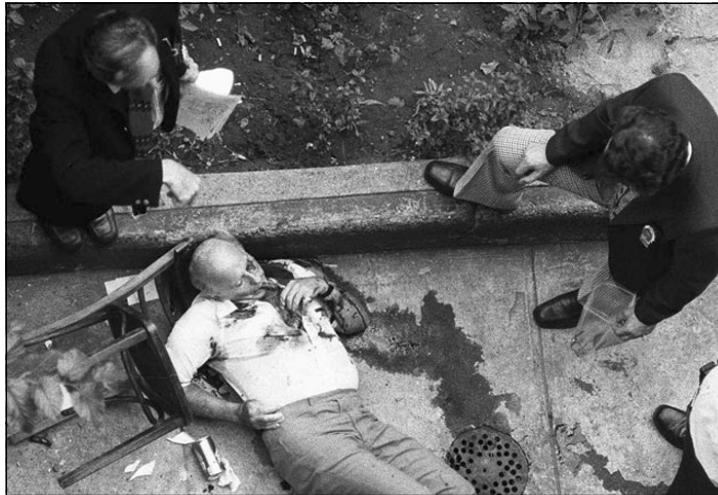
کوشتنی که سیتی له لایه‌ن کوویتیکی مافیاه