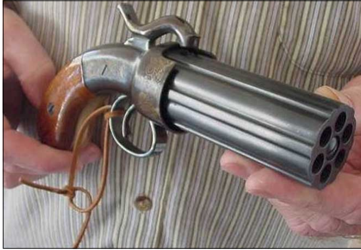
جوړه چه کیک که مافیای ئیتالی به کاریان هیناوه