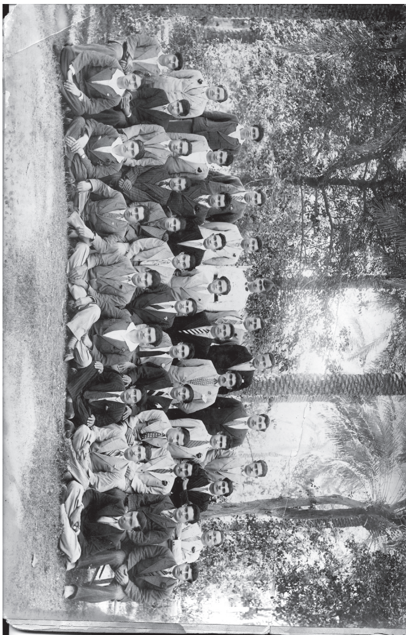
لاوانی کورد له به‌غداد 1923