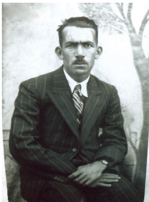
فایه ق زیور