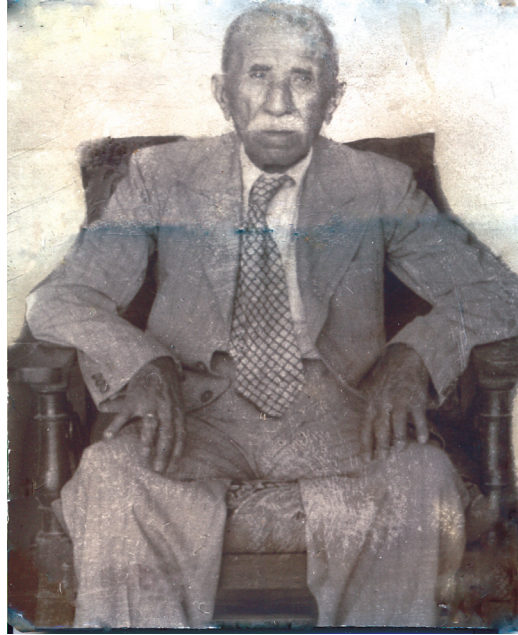
عەزىمى بابان باپىرى نووسەر