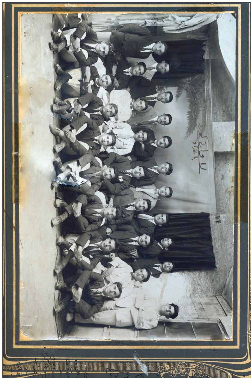
لاوانی کورد له غداد ۱۹۲۶