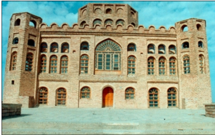
له قه لای شیروانه (کفری) (۱)