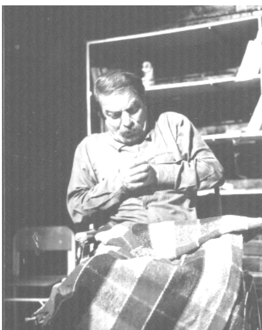
ءيمھنئك لھ نمايشى رؤژزميرى براكان

ھېماو رھمزھ كھ ٺھو حالئئھ ٺازايھئى و نھبھرديبھى مرؤفى دھسھلانئ بھرامبھر بھ گيانءاران.