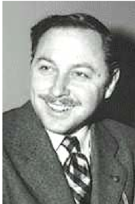
Tennessee Williams