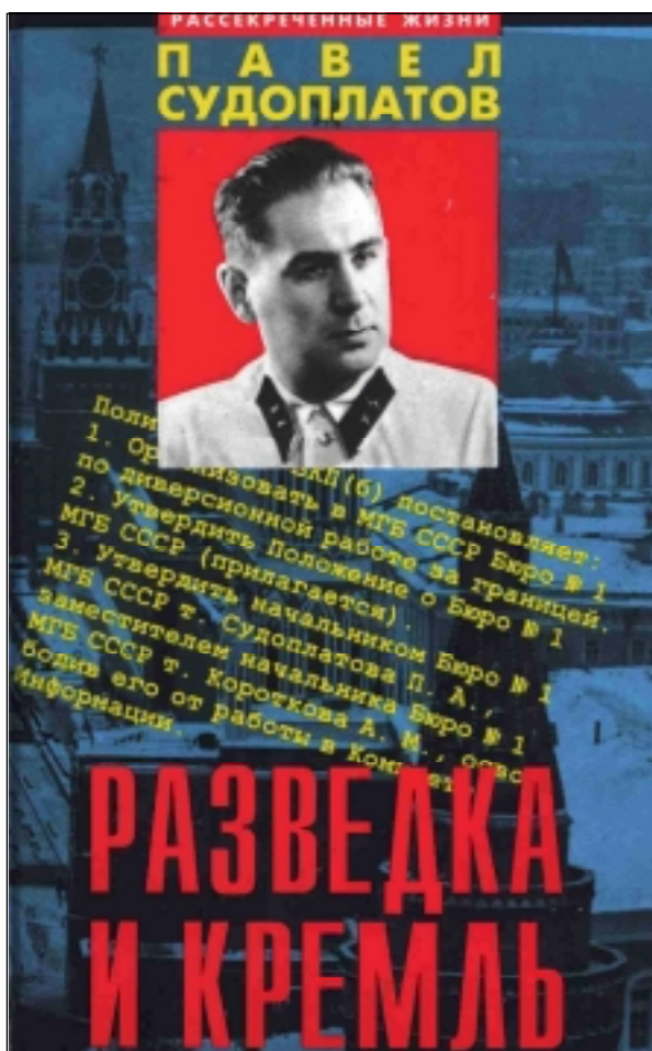
وینہی بہرگی کتیبہکہ بہرووسی