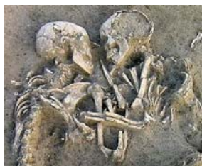
هەرچۆنیت، بارى نرخاندنی ئەو

یەكێكیش كە پیتشر جەنگاوەر بووه لە ریزهكانی پیتشمەرگە، بەناوی موسا عەبدوللا موسا، گێرایهوه كە لەسالەكانى 1987 و 1988دا بەچاوی خۆی چەندین هێرشى بینیه، ئەوهیشی بینیه كە چۆن براكەى لەگەل كوریکیدا بەمردووی باوشیان بەیەكدا كرددوو.