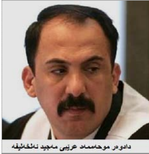
دادوهر موحامد عربي مجيد نه لگه نامه

دیمه نې به لگه نامه کان له ناستې نواندني ته و راستيانه دا بوون که تاوانباران پر و سه که يان به مه به ستي قر کردني کومه ل و جوړه ها تاوانکاری چه په لي تر يې ته نجامداوه، وهک ته و تاره زووه ي بوويانه له بيدا دانه کوشتن و به کارهيناني جوړه ها چهک که له سه ر ناستي جيهاني و رهوش قه دهغه ن، وهک ره شېگيري ناياساي و به هه لويستي نابه جي و به زور دوور خستنه وه و راگويزان و چه وساندنه وه و ليکدا برين، ههروه ها جوړه ها تاوانکاری له شيوه ي کومه لکوزي و سيستماتيک بوون، وهک ته وه ي تاوانبار علي حه سه ن نه لمه جيد له کاتي دادگايي کردندا داني پيدانا به وه ي تاوانکاري به کانيان به