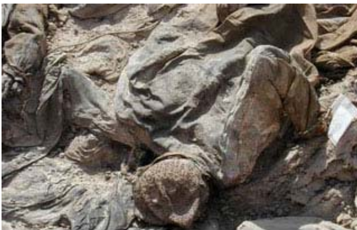
نای که شوور هیه مرۆف چیژ له مدمه نه وه رگرت !!!؟؟؟

ئه وه یشمان له لا سه یرنه بیت که سه ددام سووربوو له سه ر ئه وه ی مرۆف به گولله یان له سپداره دان نه کوژریت، چونکه خۆی و ئاموزاکه ی چیژیان له وه وه رده گرت که به کومه ل له و گورانده دا زیند به چال بکرین که شو فیری ماشینه زه ویدره کان (شوقل) یان که ره سه ته و وه ی ئه دا زیارانی له شکرو ده زگا کانی تر هه لیده درین و ئه وانیان تی فریده داو خو له که یان به سه ردا ده کردنه وه تا له و شه وه زه نگه تاره دا گیان بسپرن. ئه وان پتر چیژیان له گریان و هاواری ئه وان ه وه رده گرت که تازارو فرمی سکیان تیکه ل به و خا که ده بوو که ده می پر ده کردن و هه ناسه ی لیده برین.