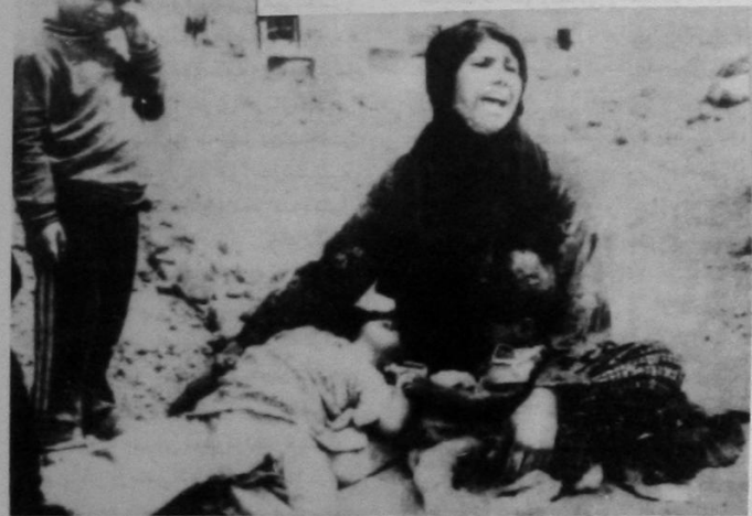
وینمه‌یه‌کی ژن و مندالی کورد له ژیری بمباران دا

منال ئێعدام کراون. ته‌ه‌می هێندی منالی ئێعدام کراو ۱۳ ساله بوون. به کۆ بیره‌ی قانونه‌کانی دێ‌وه‌ته‌وه‌ی ئێعدام ئێعدامی لاوانی که‌مه‌تر له ۱۸ سال قه‌ده‌خه به. سالی رابردوو ریکخراوی نه‌ته‌یه‌ی به ککرتوه‌کان رای‌که‌یاند که له نه‌ته‌یه‌ی شه‌ردا ۲۵۰ هزار که‌م کۆژراوه و ۵۰۰ هزار که‌م بریندار بوه، وه دوو میلیۆن که‌م ئاواره و ده‌ر به‌ ده‌ر بوه. راپۆرتی شه‌و تۆ به‌ ده‌سته‌وه‌ن که له ئێران دادیلی شه‌ر پاش خۆ به‌ده‌سته‌وه‌ن دان کۆلله بارا کراون. چونکه ئابووری لاوازی ئێران - ناتوانی دیلی شه‌ر به خۆ بکات. راپۆرتی کومته‌ی مافی مرۆتی بار- لمانی ئینگلستان که لێره‌دا کورت کرا وه ته‌وه نه‌ ته‌جه ده‌کرتی که کوشتار، - تالان، ئازار و شه‌شکنجه، بێ شیل‌کرد- نی مافی مرۆتی، دریزی هه‌ به‌ وه‌کی له سر و مالی خۆی شه‌مینه *