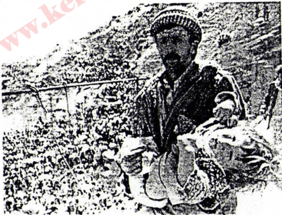
تو بلی ئهم منداله ئهم روژهی له بیر بچی؟