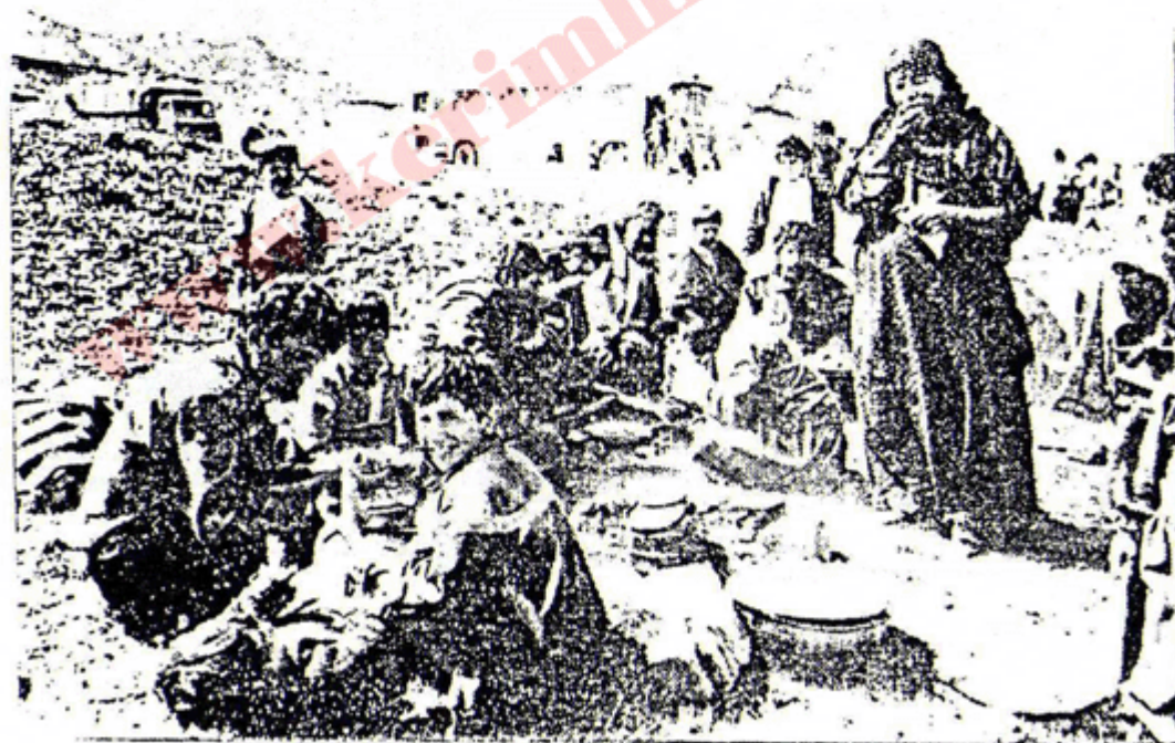
بی پهناو بی دهرهتان له چیا