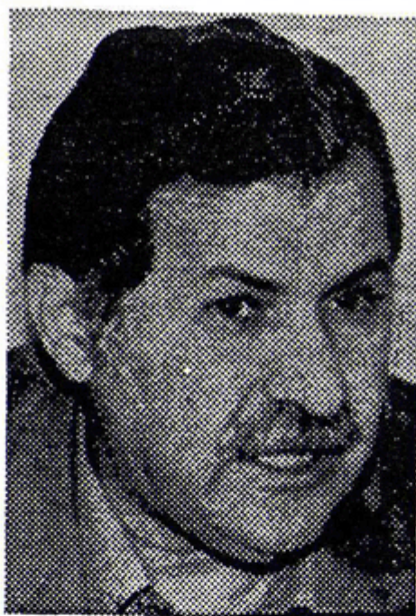
مام جه لال

" جه لال تالهبانی که ۲۶ ی مانگی مارس بو کوردستان گه رایه وه، له زاخو هزاران کوردی چه کدار پیشوازیان لیگرد. ناو براو له کاتیکا چاوی پر بوون له فرمیسک، له هه یوانی مالیکی دهستی بو خه لک راده وه شانده به بونهی سهر که وتنی پارتیزانه کانی کورد به سهر (دیکتاتوری به غدادا) پیروز بایی لیگردن و گوتی : — " شهر تا نازاد کردنی هه موو عیراق دریژهی دهبی . جه لال تالهبانی به لایه نگره کانی خوی گوت : " نیمه ده توانین له دوا روژی عیراقدا نه خشیکی گرنگمان هه بی. چونکه ۱۳ سال شه زمونی شهرمان هه یه و ده توانین له ناوچه نازاد کراوه کان بهرگری بکهین . " روژنامهی شیران تایمز : ۲۹ ی مارس ۱۹۹۱ "