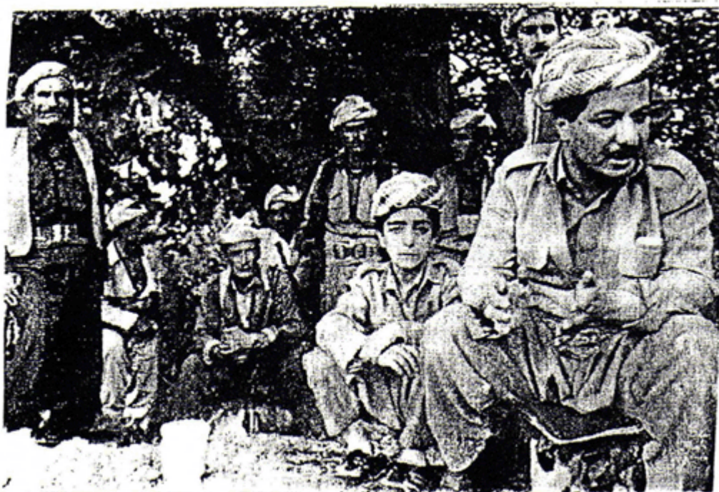
بیر له چاره نروسی خه لک ده کاته وه