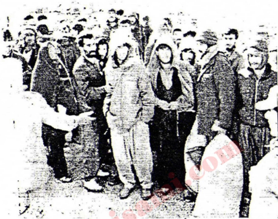
له سنووری ئیران پاسدار رایانگرتوون —