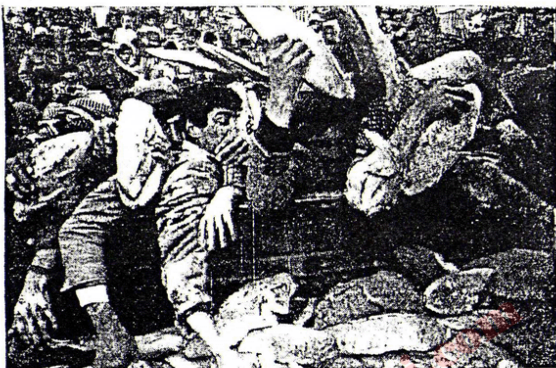
کھلہ کھیہ بوّان ، هاوار به مالّم !