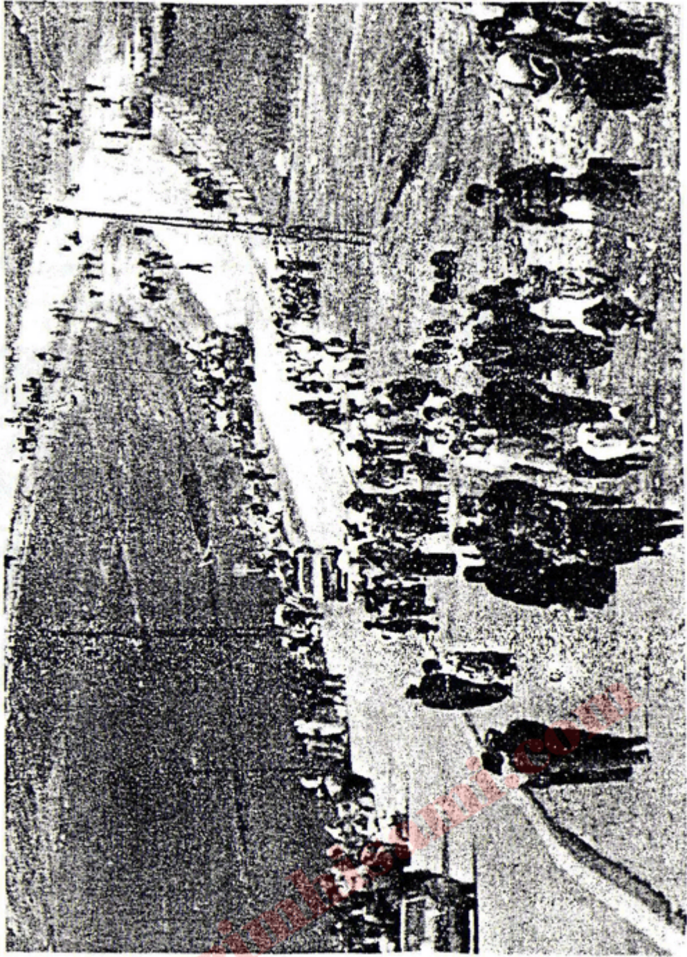
لیقه و ماوانسی کورد به ره شیران