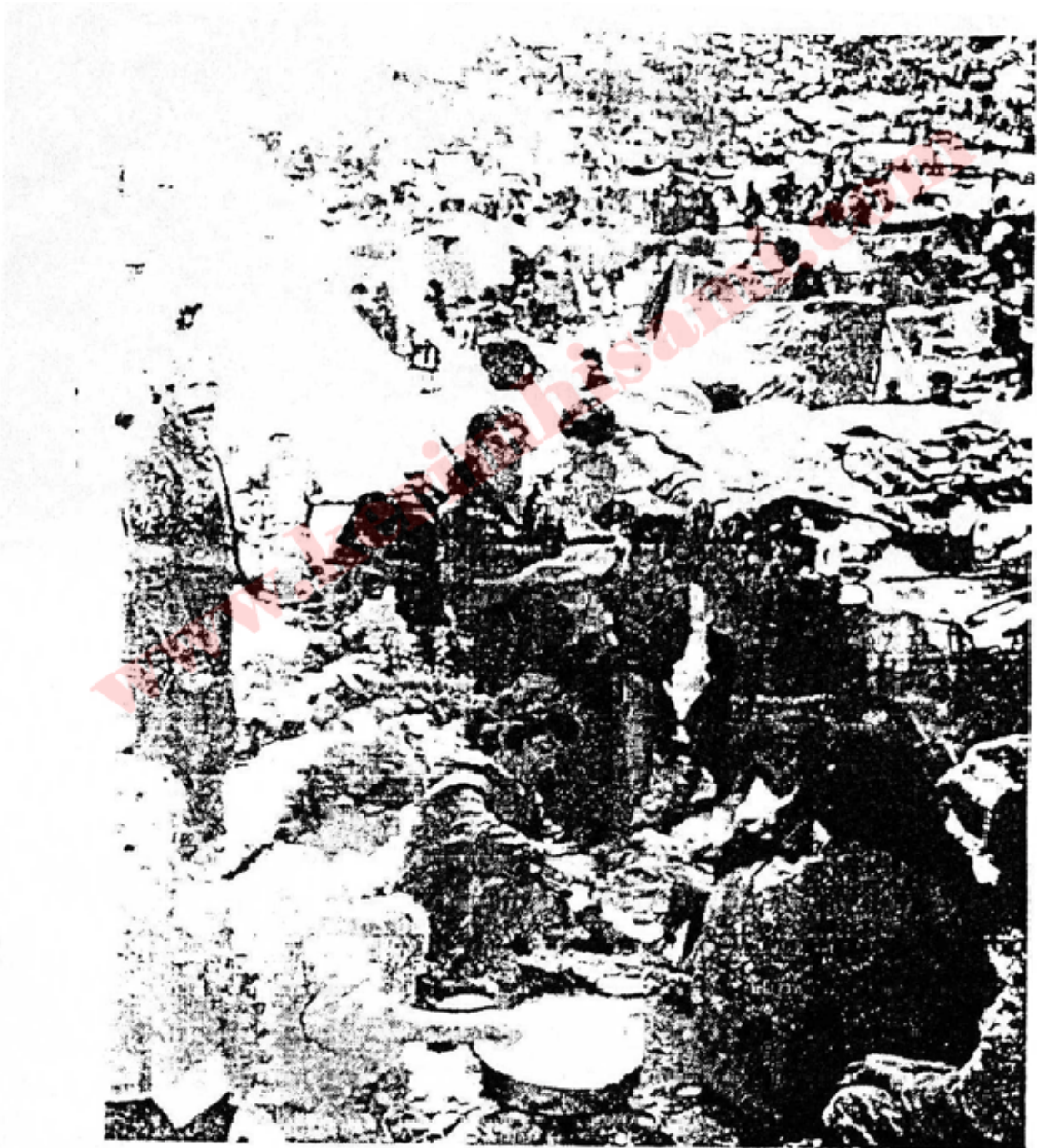
کی بہر پرسی دہر بہدہری تہم ہہموو ژن و مندالہ یہ