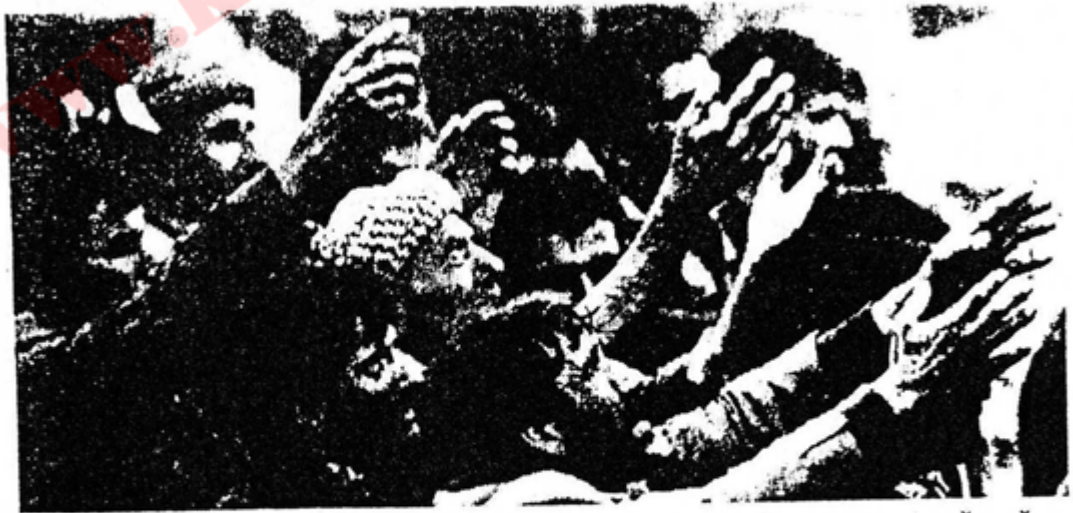
بو قوزتنہ وہی نانیك لہ حہوا ٹہم دہستانہ بہرہو عاسمان چوون