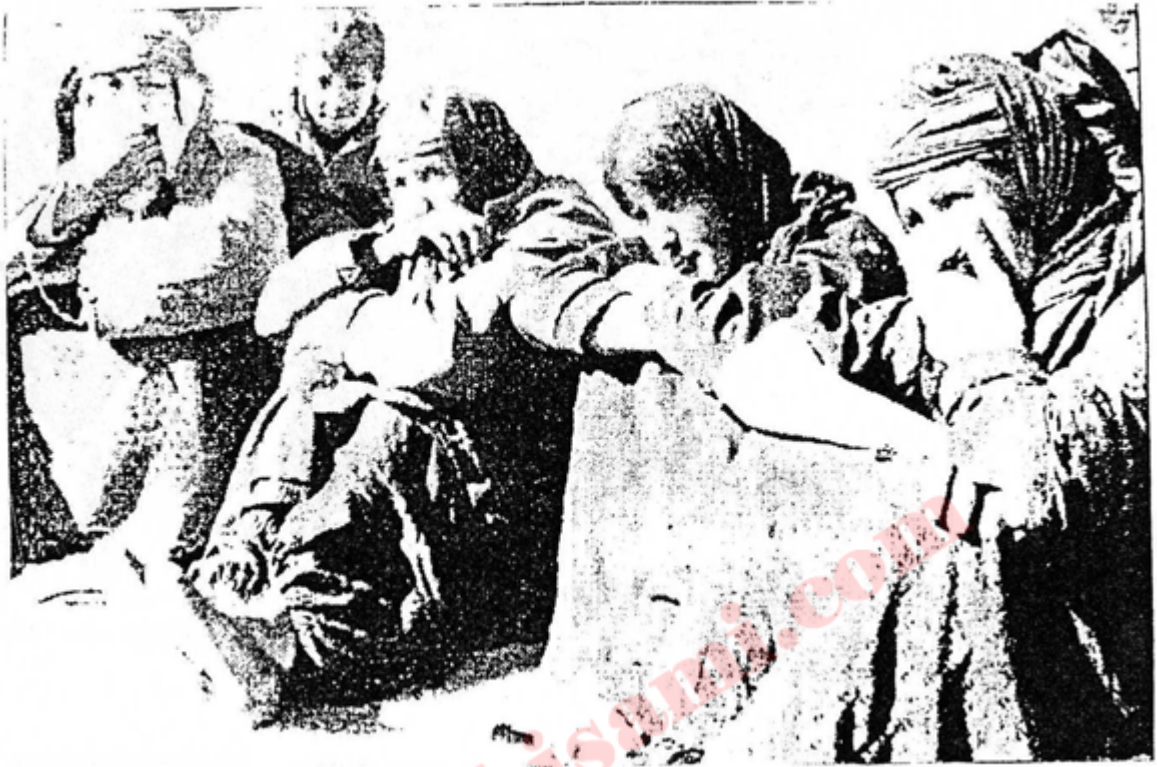
بی دہسلاٲ بیر لہ دواروژی نادیار دہکہ نہ وہ