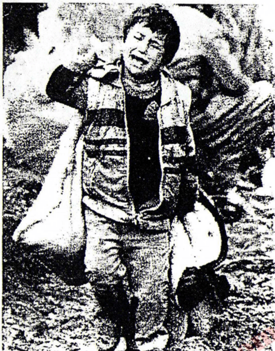
بو دواروژ کار کوشته تر دهبی