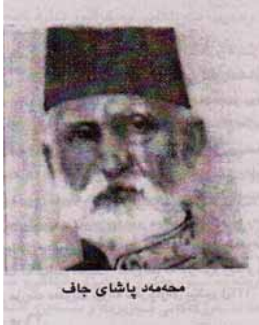
محمد پاشای جاف