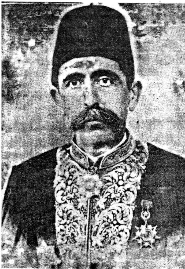
مه‌حمود پاشای جاف به به‌رگی پاشاییه‌ره