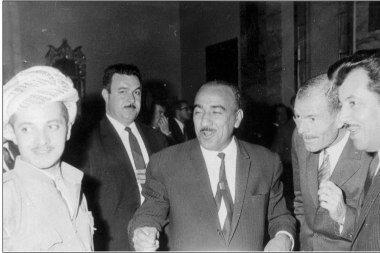
من اليمين : صلاح عمر العلي وعزت ابراهيم الدوري وصالح مهدي عماش ومحسن دزهبي ومسعود البارزاني في بغداد ، آذار ١٩٧٠