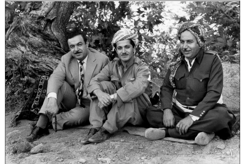
مسعود البارزاني يتوسط شمس الدين المفتي ( ممثل الثورة الكردية في طهران ) ومحسن دزهيبي ، في منطقة حاج عمران صيف عام ١٩٦٧