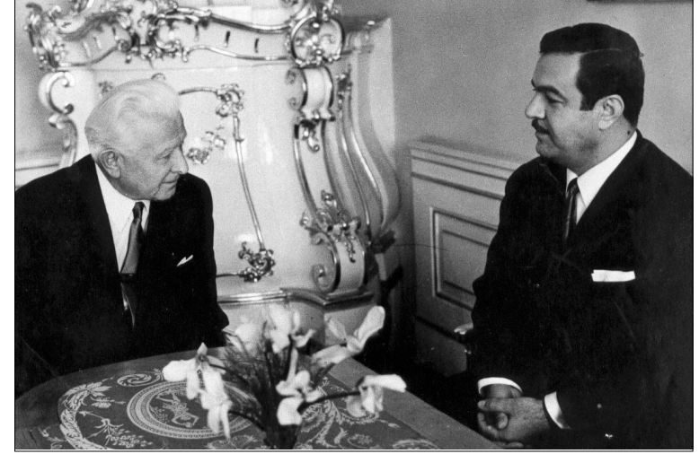
الجنرال سفوبودا رئيس جمهورية جيكوسلوفاكيا أثناء إستقباله محسن دزهبي بعد تقديم أوراق إعتماده كسفير للعراق في براغ ٢٦ آب ١٩٧٠