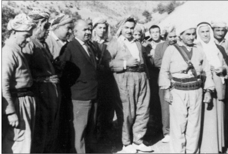
مصطفى البارزاني بانتظار وصول رئيس الوزراء طاهر يحيى الى منطقة ناويردان في ربيع عام ١٩٦٨ ، ويظهر في الصف الأول كل من محسن دزهيبي ومحمد أمين محمد علي وكاظم زياد آغا ويдалله كريم ، ويظهر في الصف الثاني فرنسو حريري والحاج شاكور الدوري...