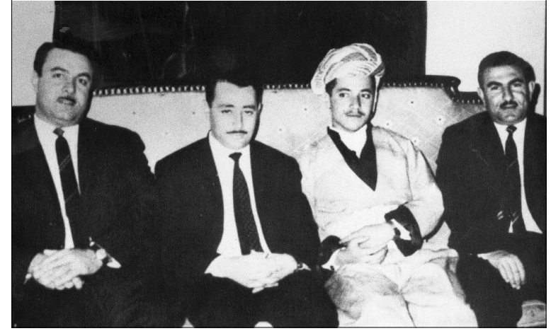
مسعود البارزاني (الثاني من اليمين) ومحسن دزهبي (الرابع من اليمين) وإثنان من المسؤولين العراقيين في القصر الأخضر ببغداد عام ١٩٦٧