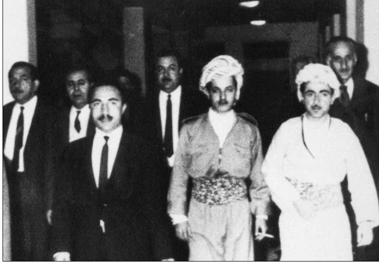
الوفد الكردي المفاوض عند وصوله الى القصر الجمهوري ببغداد في آذار ١٩٧٠ ، ويظهر في الصف الأول إدريس البارزاني ومسعود البارزاني ومحمود عثمان ، وفي الصف الثاني صالح اليوسفي ومحسن دزهبي ونوري شاويس ونافذ جلال