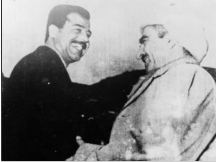
مصطفى البارزاني وصادق حسين في منطقة ناويردان بقضاء جومان ، آذار ١٩٧٠