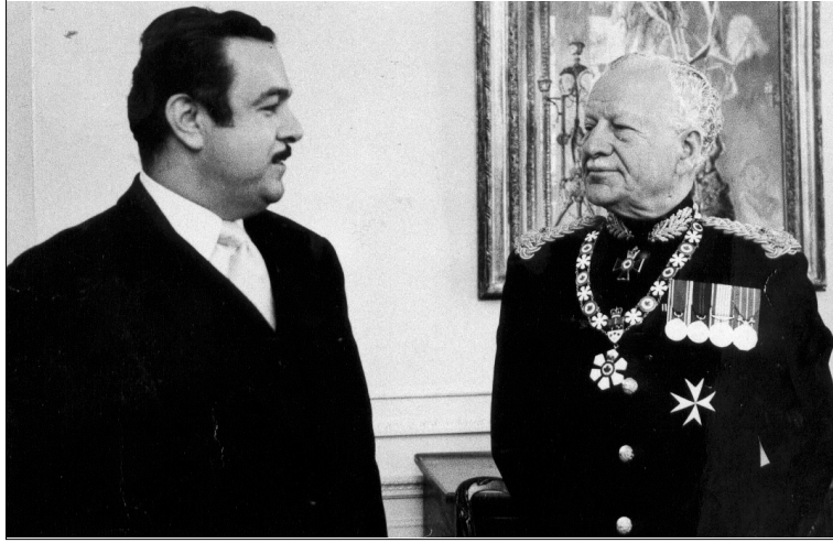
حاكم كندا العام رولاند ميچنر خلال إستقباله محسن دزهبي بعد تقديم أوراق إعتماده كسفير للعراق في كندا ، نيسان عام ١٩٧٣