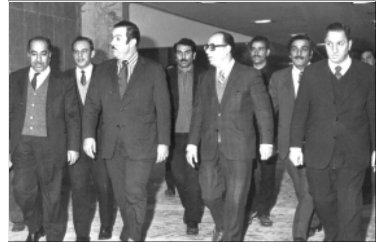
محسن دزهبي وزير الأشغال والإسكان مع كبار موظفي الوزارة خلال تفقد أحد المشاريع ، تشرين الثاني ١٩٧٣