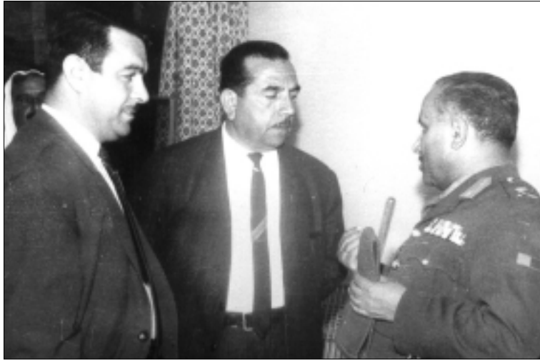
من اليمين : اللواء حمودي مهدي رئيس أركان الجيش ونافذ جلال ومحسن دزهبي ، بغداد عام ١٩٦٧