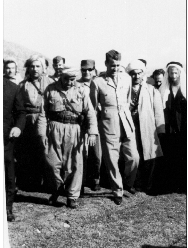
الزعيم الكردي مصطفى البارزاني في استقبال رئيس الجمهورية عبدالرحمن عارف بمنطقة جنديان ، في تشرين الأول ١٩٦٦ ، ويظهر في الصورة الشيخ ناظم العاصي وعبدالرحمن القاضي ونافذ جلال والعميد الركن زكي حسين حلمي قائد الفرقة الأولى ، وفي أقصى اليسار محسن دزهبي