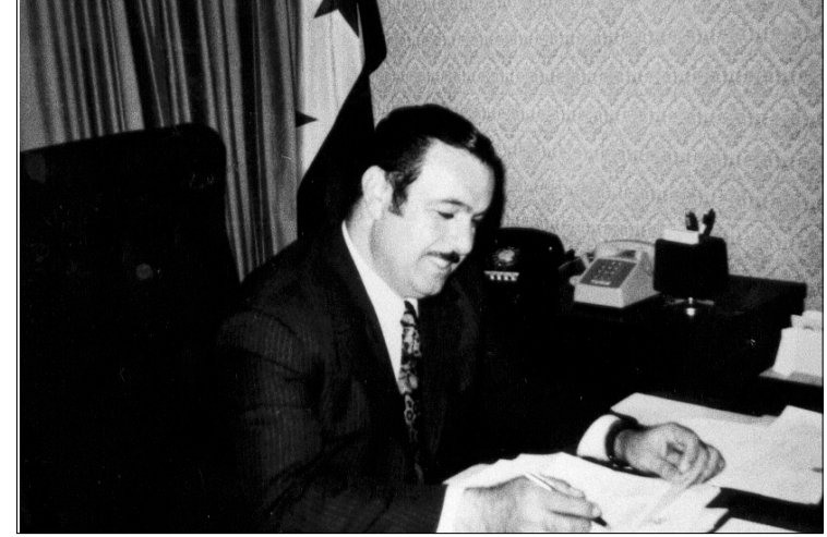
محسن دزهبي سفير العراق في كندا في مكتبه الرسمي بالسفارة العراقية في أوتاوا عاصمة كندا عام ١٩٧٣