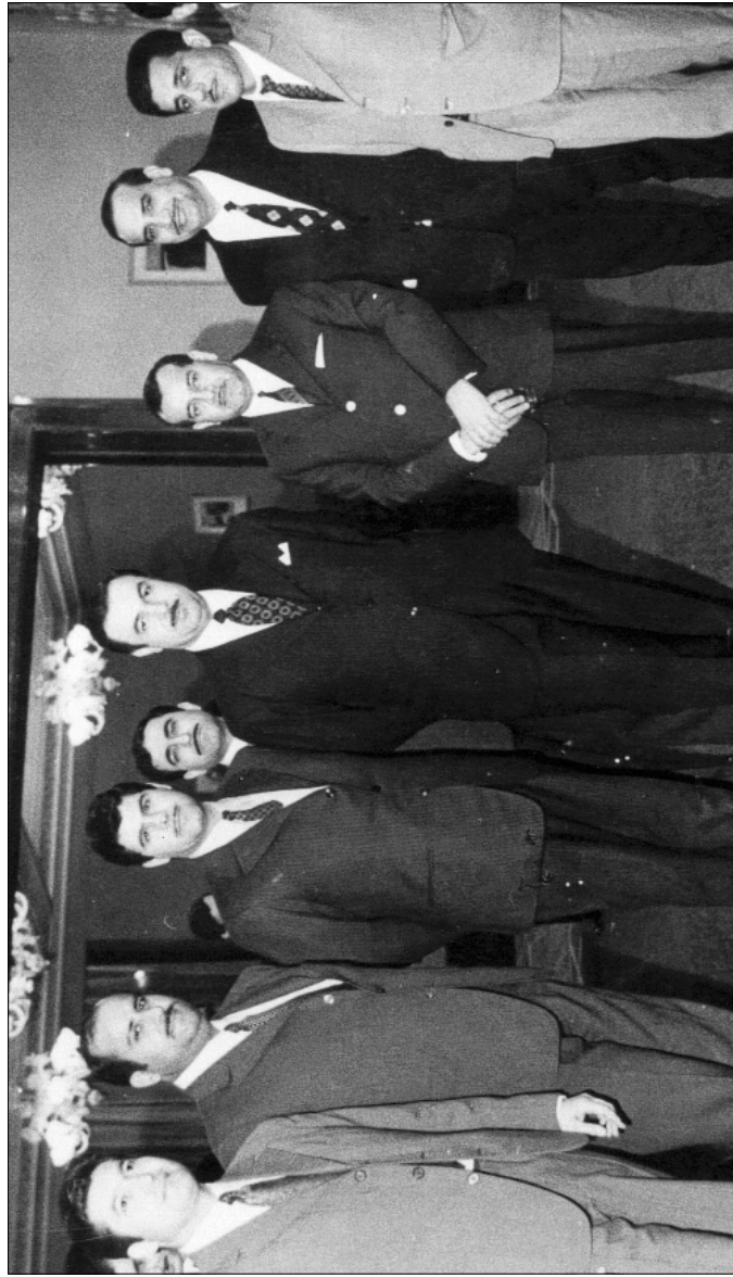
محسّن دزهيي سفير العراق في براغ والي جانبه عمدتاك خيرالله مطلقام (خلال زيارته لچيکوسلواکيا) والي جانبيهما اعضاء السفارة العراقية ، اواخر صيف ١٩٧٠