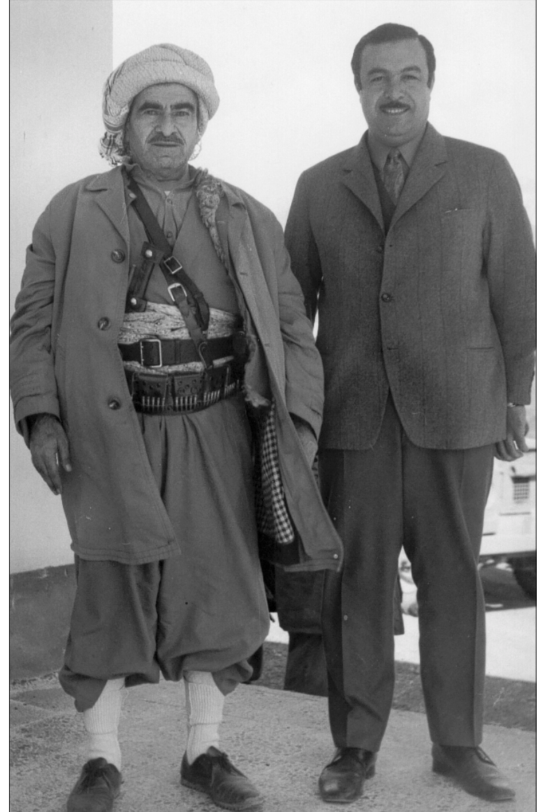
الزعيم الكردي الراحل مصطفى البارزاني مع محسن ذهبي في قصر السلام بقضاء جومان ، كانون الثاني ١٩٧١