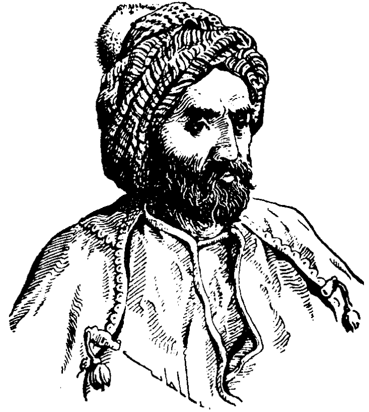
نہ حمہدی خانی (1707-1650)