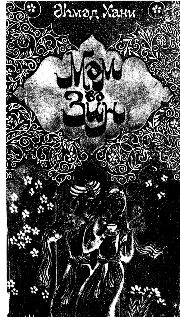
مہم و زین چاہی باکو 197