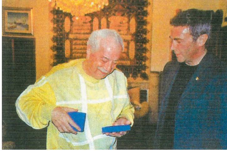
النازي البعثي عدي صدام حسين يستقبل النازي النمساوي يورك هايدر